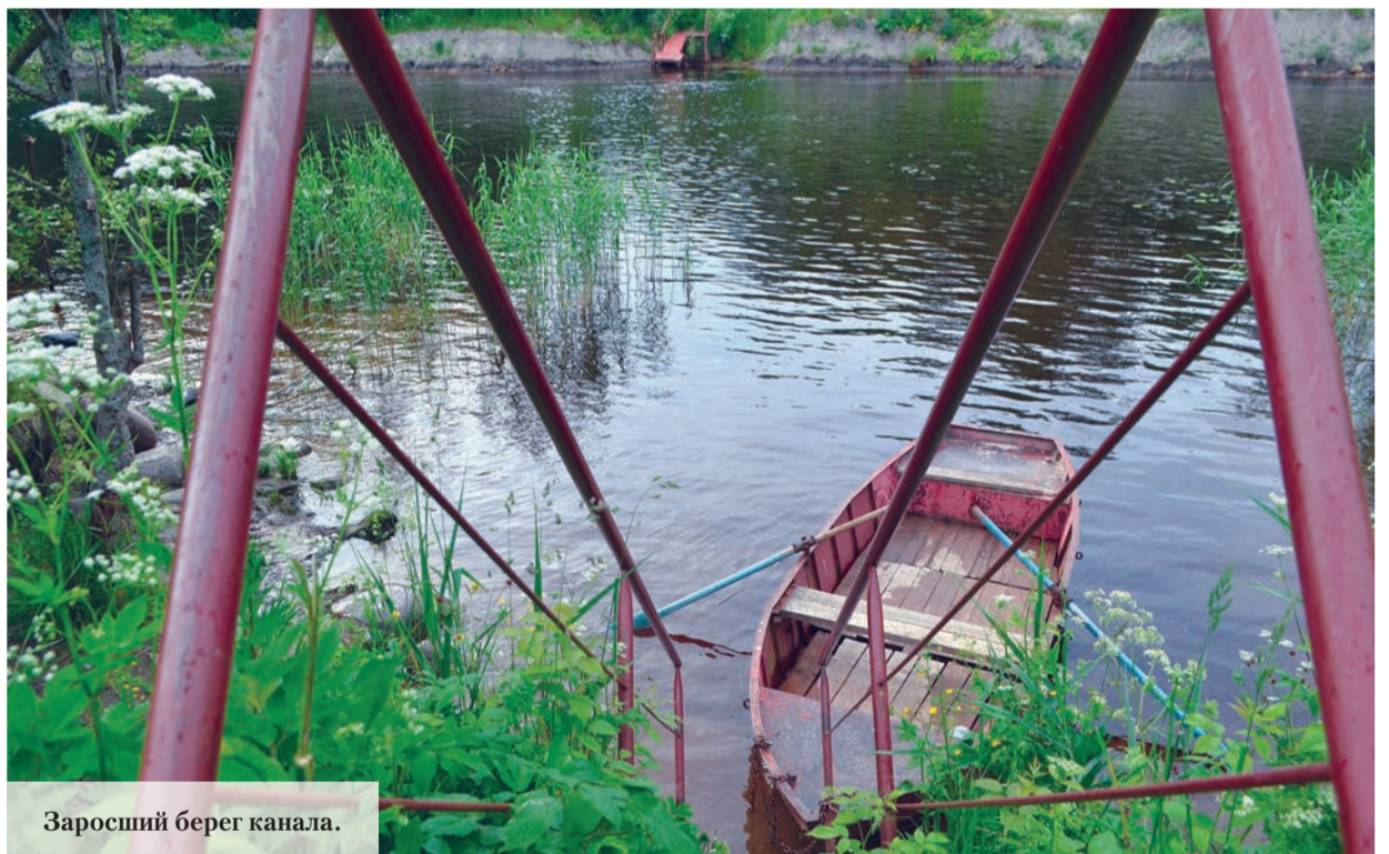
Заросший берег канала.

«Большая Ладожская тропа» – это масштабный проект кольцевого маршрута вокруг Ладожского озера, который объединит в себе создание пеших, конных, велосипедных и лыжных маршрутов, а также трасс для квадроциклов и снегоходов на территории