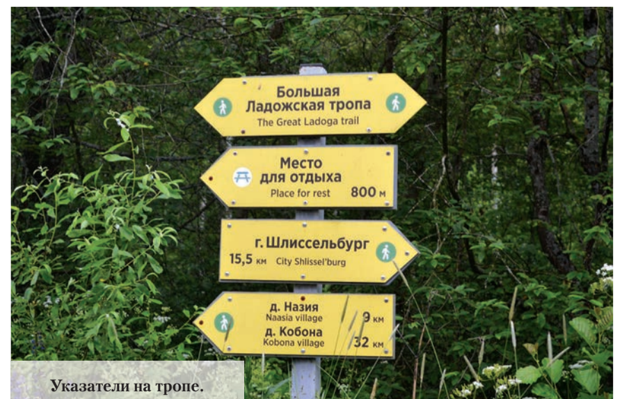
Указатели на тропе.