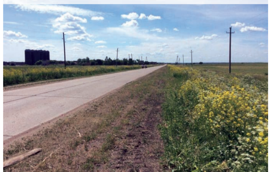
Нынешняя дорога, состоящая из плит, разрезает поле бывшего копорского аэродрома на две неравные части.