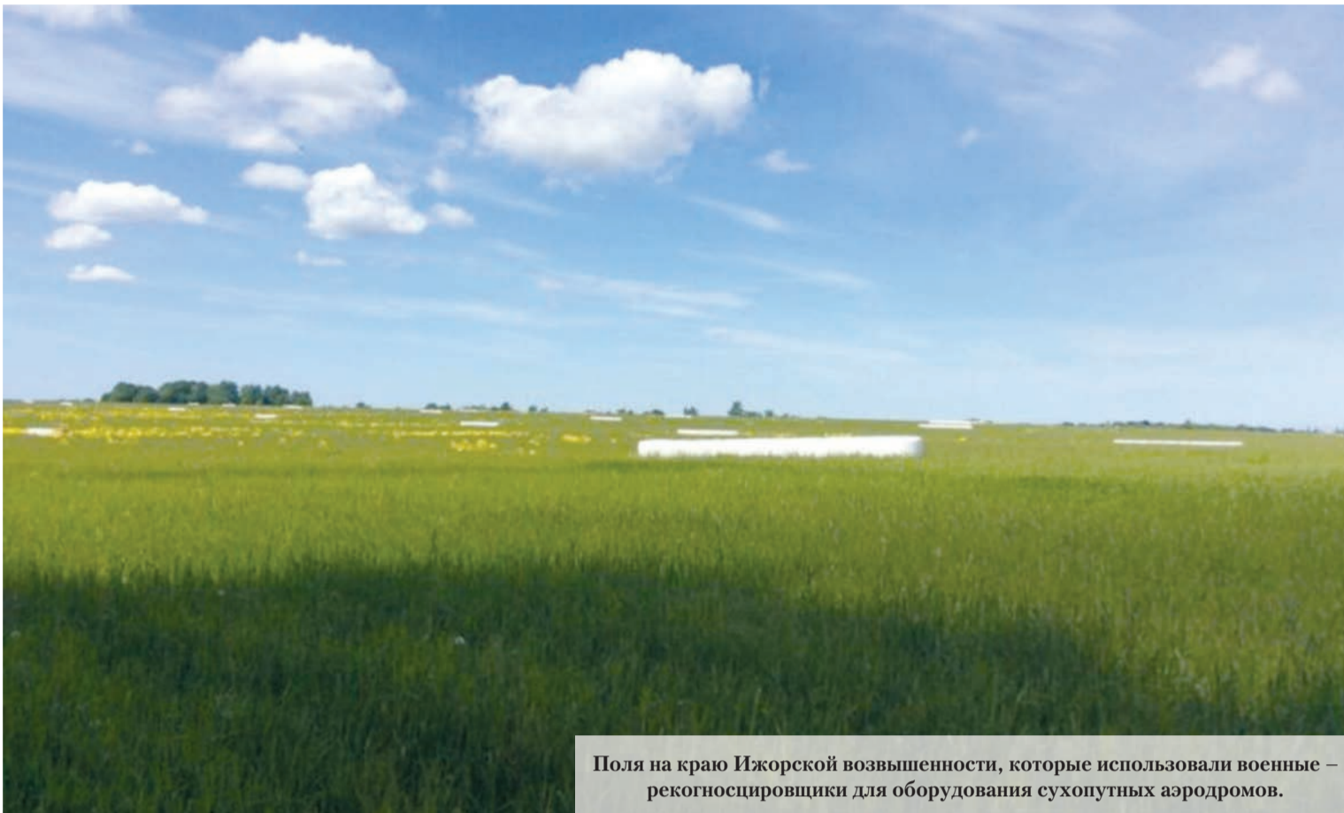
Поля на краю Ижорской возвышенности, которые использовали военные – рекогносцировщики для оборудования сухопутных аэродромов.