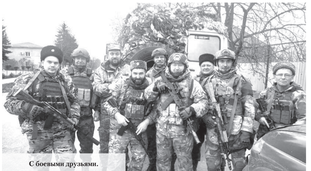
С боевыми друзьями.