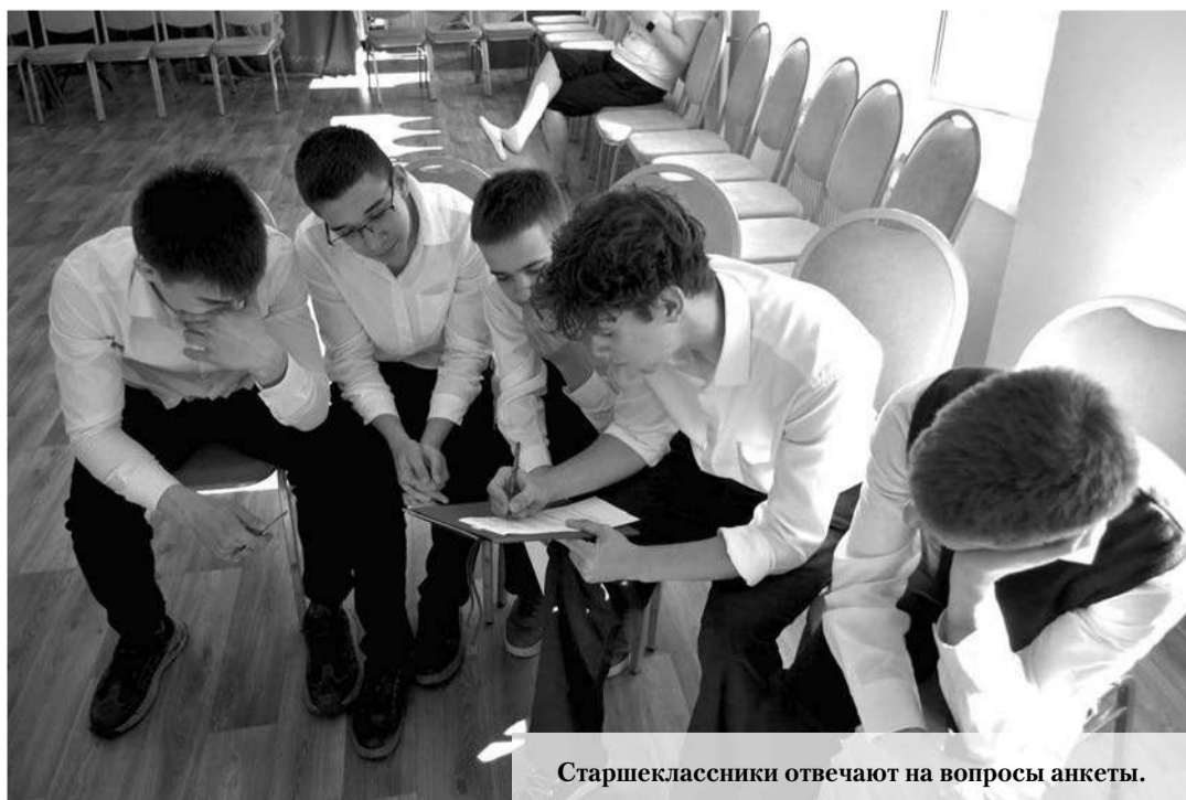
Старшеклассники отвечают на вопросы анкеты.

БЕСЕДОВАЛА И. СТЕПАНОВА.