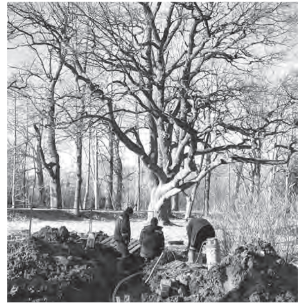
Беспредел в парке Мордвиновки.