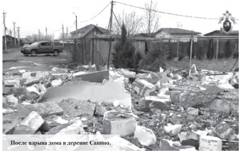
После взрыва дома в деревне Санино.

Как сообщили в следственном комитете Ленобласти, 21 марта следственным отделом города Соновый Бор, в чью компетенцию входит Ломоносовский район, возбуждено уголовное дело об оказании услуг, не отвечающих требованиям безопасности жизни и здоровья потребителей. Речь идёт о взрыве в двухэтажном частном доме в деревне Санино Низинского поселения. Ночью в результате взрыва взрывной волной дом уничтожено полностью, минимум четыре соседних здания сильно повреждены – зафиксированы серьёзные технологические нарушения наружных стен. На месте происшествия – строительные завалы. По данным следствия, хозяева заключили договор поставки углеводородных сжиженных газов с частной фирмой. Клиентам привезли и закачали две тысячи литров топлива. Ночью 21 марта оно взлетело на воздух вместе с домом. По информации 47news, договор был заключён с фирмой из Петербурга, о которой на сайте говорится, что она имеет «20 лет опыта» и сеть из 27 газозаправочных станций. «На место происшествия незамедлительно осуществлён выезд руководства следственного отдела, следователей-криминалистов аппарата следствен-