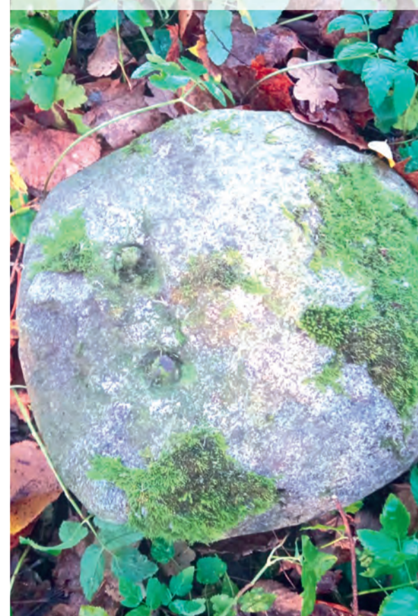
Каменное надгробие с двумя коваными гвоздями, оставшимися от крепления креста.

чтобы сберечь сооружение от вандалов. Уцелевшие после уничтожения в середине 1950-х годов гранитные надгробия исторического кладбища Ораниенбаумской немецкой колонии в то время, наверное, казались нам такой же исторической данностью прошлых лет, как и другие памятники этих мест. Погост немецкой Ораниенбаумской колонии вошёл тогда в нашу жизнь необычным образом – он располагался на береговой линии Финского залива в том месте, куда дачники ходили загорать и купаться. Точнее, вдоль береговой линии, чуть ниже которой был ещё и пляж: песок, камушки, ракушки и подход к воде. Сохранившихся надгробий, как мне помнится, было немного, и они словно бы прятались под сенью ветвей кустов черёмухи.