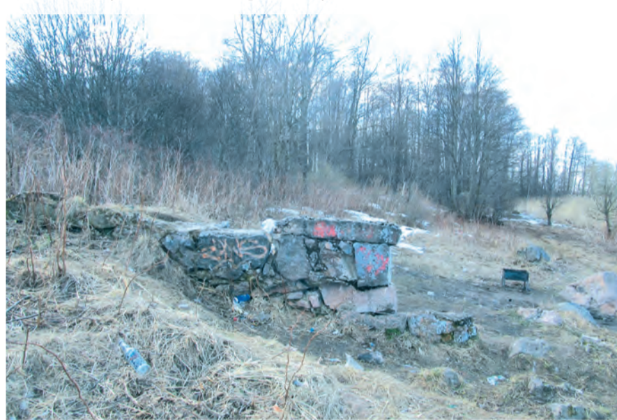
Руины кладбища Ораниенбаумской немецкой колонии.