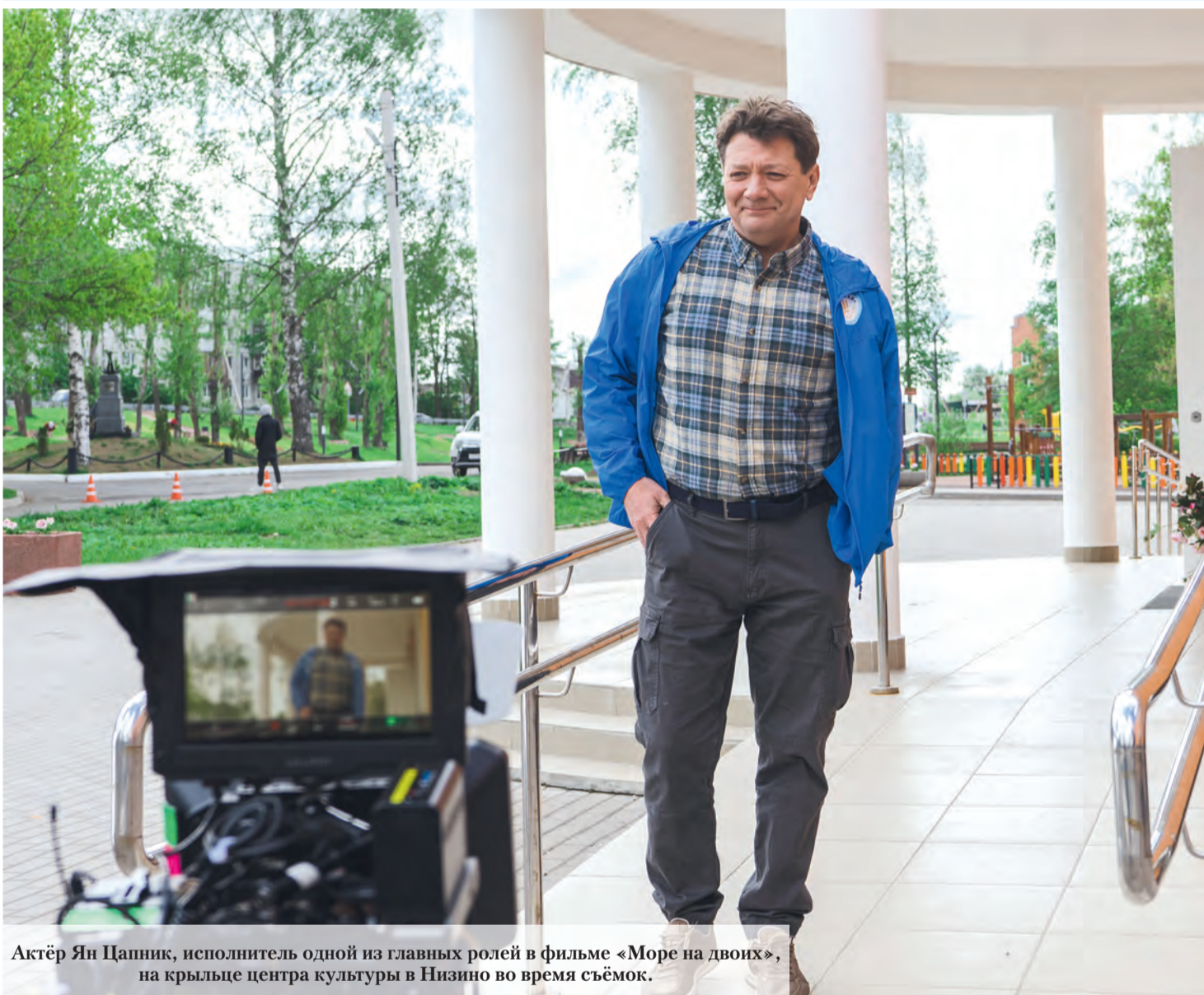
Актёр Ян Цапник, исполнитель одной из главных ролей в фильме «Море на двоих», на крыльце центра культуры в Низино во время съёмки.

28 марта 2025 года № 13 (16+) Газета Ломоносовского района, города Ломоносов Петродворцового района. Выходит с 19 апреля 1931 года. www.baltluch.ru