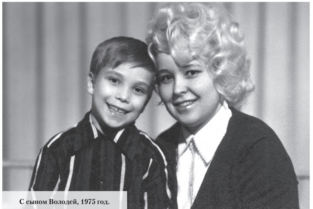
С сыном Володей, 1975 год.

И. СТЕПАНОВА.