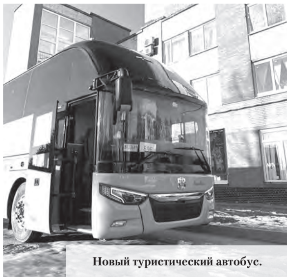
Новый туристический автобус.