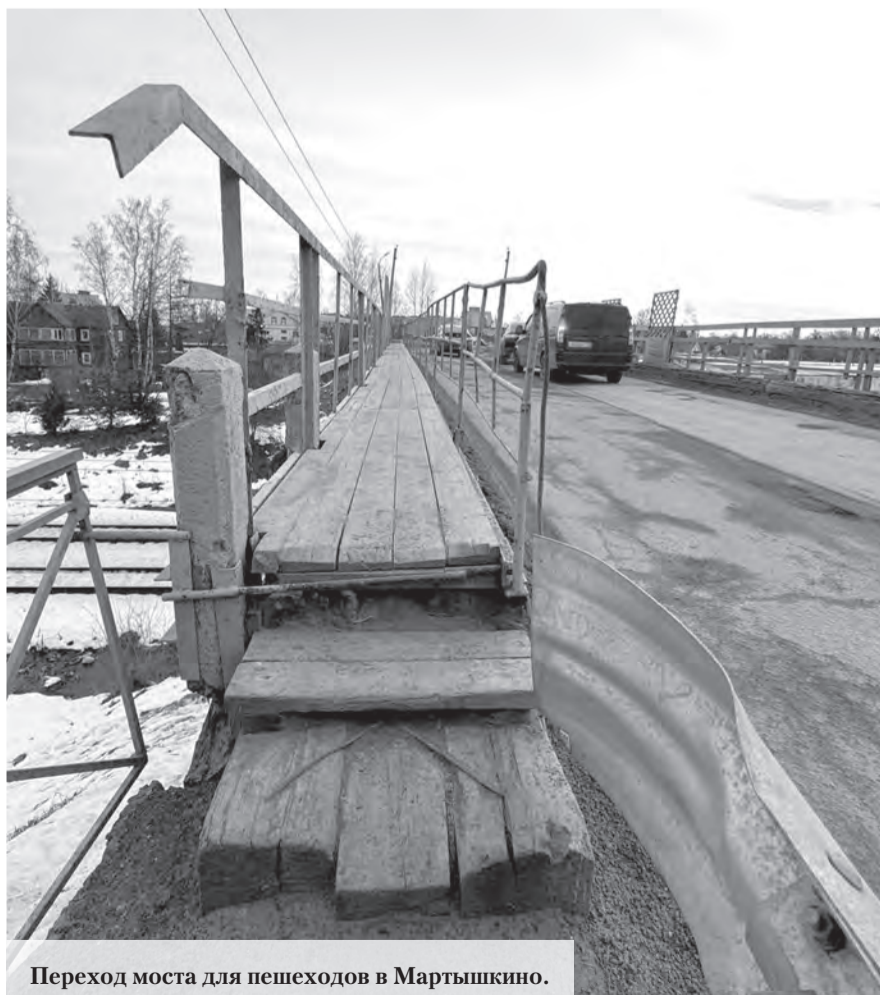
Переход моста для пешеходов в Мартышкино.

С наступлением весны обратили внимание на дорожные проблемы местные власти и общественность города Ломоносов, в том числе администратор груп-