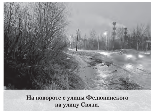
На повороте с улицы Федюнинского на улицу Связи.