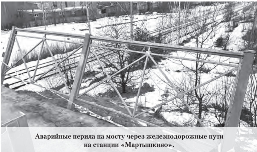
Аварийные перила на мосту через железнодорожные пути на станции «Мартышкино».

ряя, что им «поручили электрокабель проверить, проходящий под землёй». Только через некоторое время на месте раскопок появился сомнительного вида щит, практически не несущий информации о происходящем. Выяснилось только, что работы выполняют представители ООО «ЭнэргПартнёр», а заказчиком выступает «Ленэнерго». Жители Мордвиновки назвали это произволом, о чём сообщили в прокуратуру, ГАТИ, КГИОП, в городские комитеты по энергетике и природопользованию, а также губернатору Санкт-Петербурга, в министерство культуры и в информационный центр следственного комитета России. После этого в Мордвиновку наведальсь представители прокуратуры. На данный момент земляные работы в старинном парке остановлены. Рабочие как-то быстро свернули свою деятельность и ушли вместе с техникой. При этом они оставили изуродованные газоны и повреждённые корни деревьев. Пока из инстанций, куда были направлены жалобы местных жителей, ответы не получены.