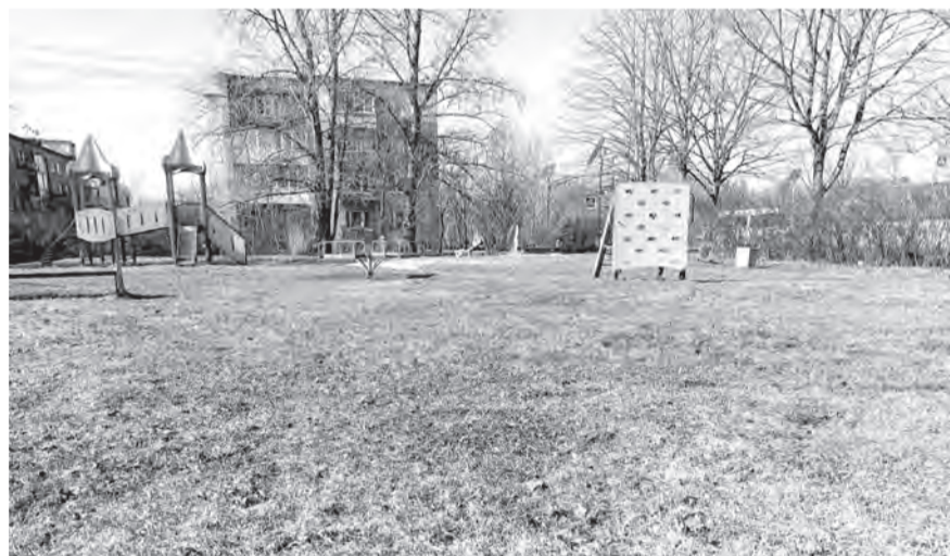
Общественная территория у дома № 6 в Копорье до благоустройства и после.