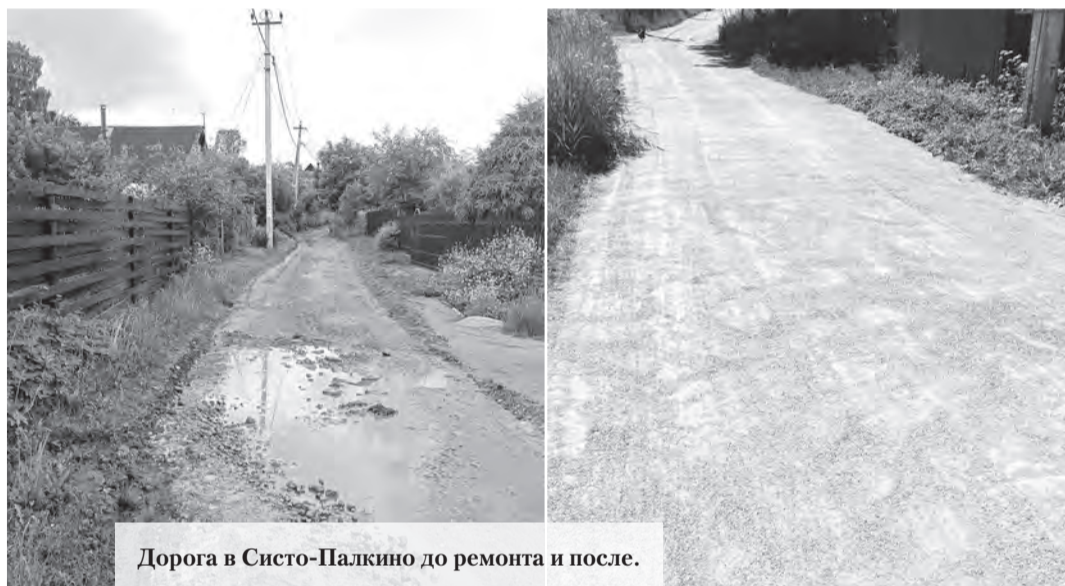
Дорога в Систо-Палкино до ремонта и после.

Анализ доходов бюджета Копорского поселения за последние 3 года показывает стабильное увеличение общих доходов. Рост налоговых и неналоговых поступлений в 2024 году по сравнению с