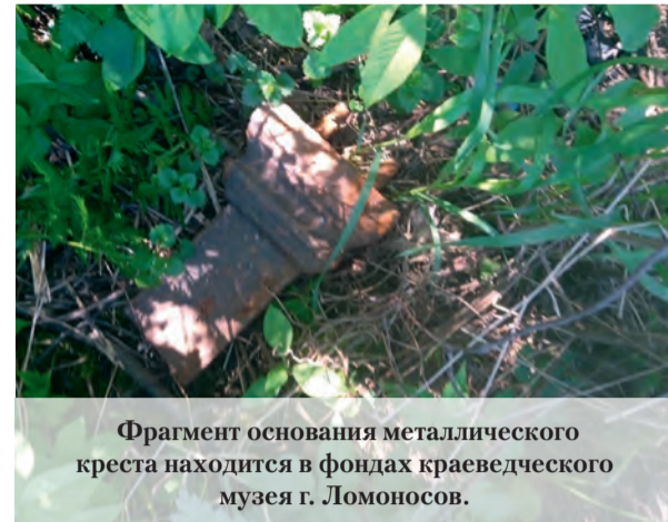
Фрагмент основания металлического креста находится в фондах краеведческого музея г. Ломоносов.

ся синевой залива. Поэтому очень скоро всё это стало для нас обыкновенными чудесами. А в каменном погребке неподалёку от краснокирпичного здания водонапорной башни по пятницам раскрывались дверцы, и туда выстраивалась очередь дачников с бидонами и канистрами – за керосином, поскольку в то время все готовили еду на керосинках. Зайдя в погреб, можно было полюбоваться каменной кладкой свода этого протяжённого подземного сооружения. Сейчас двери этого погребка забетонированы,