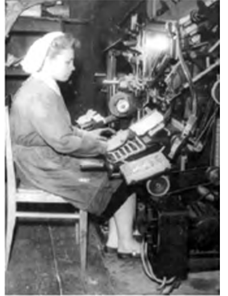
В типографии за линотипом

В воинскую часть, где находился их госпиталь, должен был приехать маршал