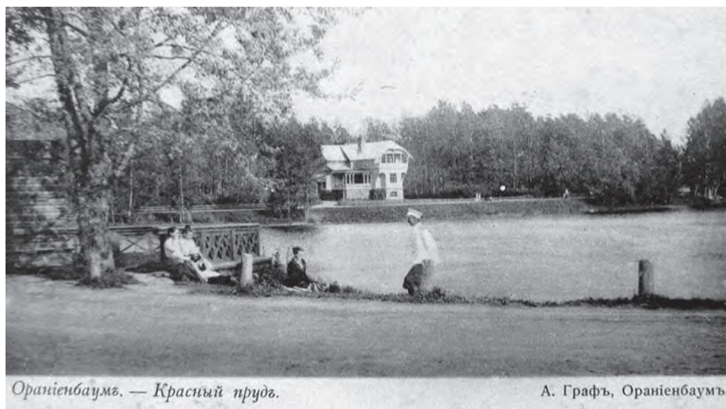
Ораниенбаумъ. — Красный прудъ.