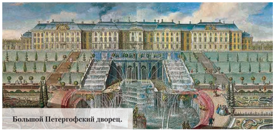
Большой Петергофский дворец.

зал дворца подтверждается и записями в камер-фурьерских журналах.