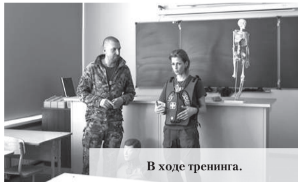
В ходе тренинга.

В посёлке Ропша Ломоносовского района Ленобласти состоялось практическое занятие по тактической медицине.