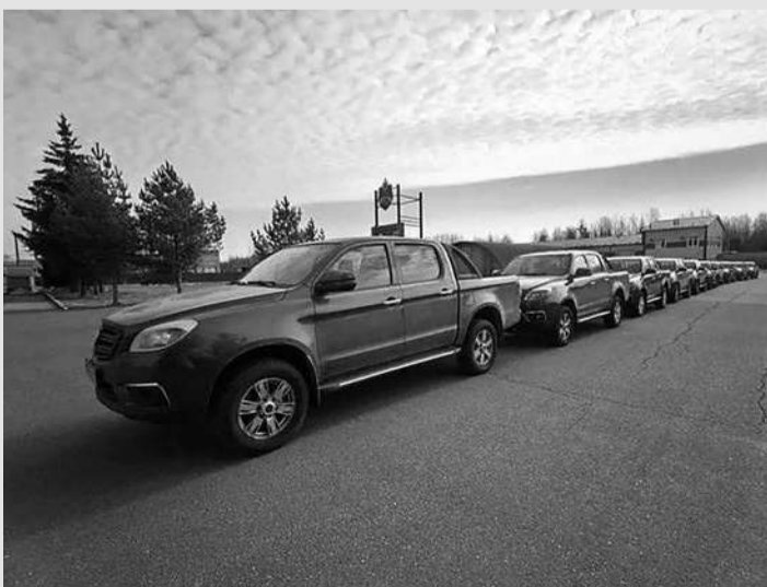
В Ленобласти мобильные огневые группы получили новую технику. КУГИ ЛО передал 10 автомобилей «Соллерс СТ6»