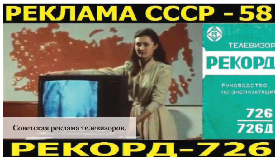
Советская реклама телевизоров.

Подготовила М.БОРИСОВА, использован материал из группы в соцсети «Ломоносовский дневник».