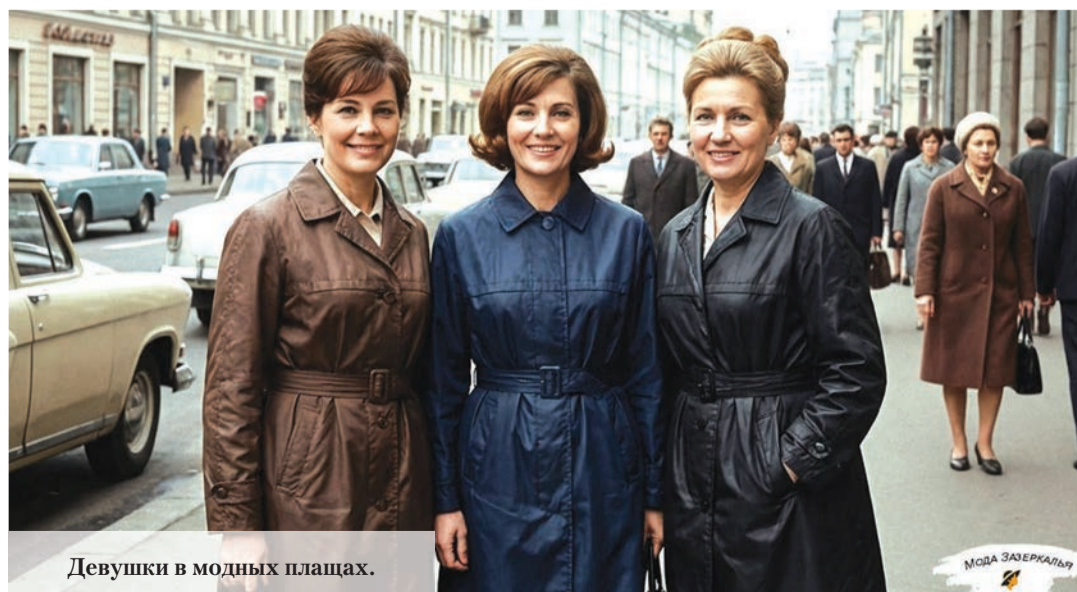
Девушки в модных плащах.