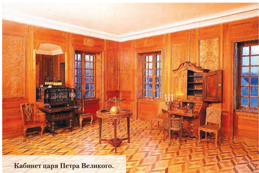
Кабинет царя Петра Великого.