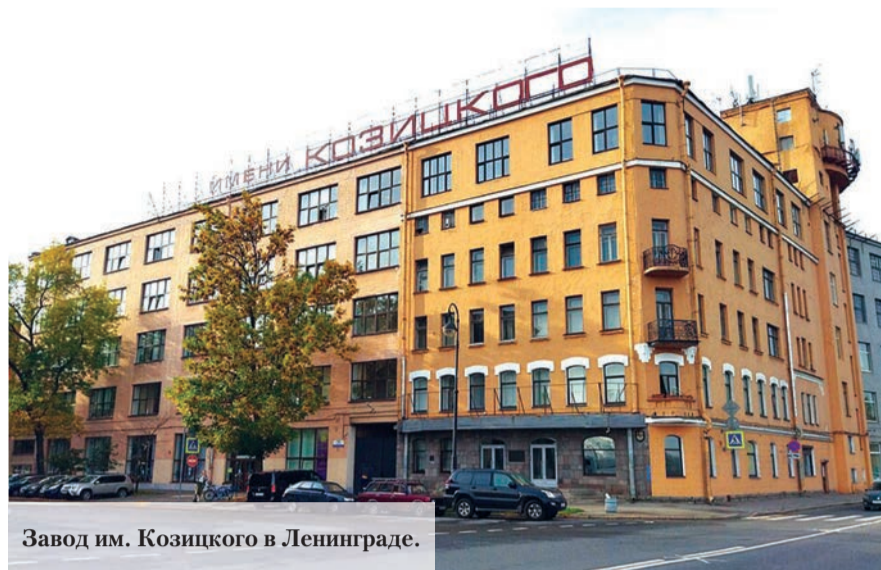
Завод им. Козицкого в Ленинграде.

Вернёмся к ассортименту Ломоносовторга. В 1971 году магазин «Спорттовары» предлагал жителям района лыжные ботинки за 18 рублей 90 копеек, лыжи