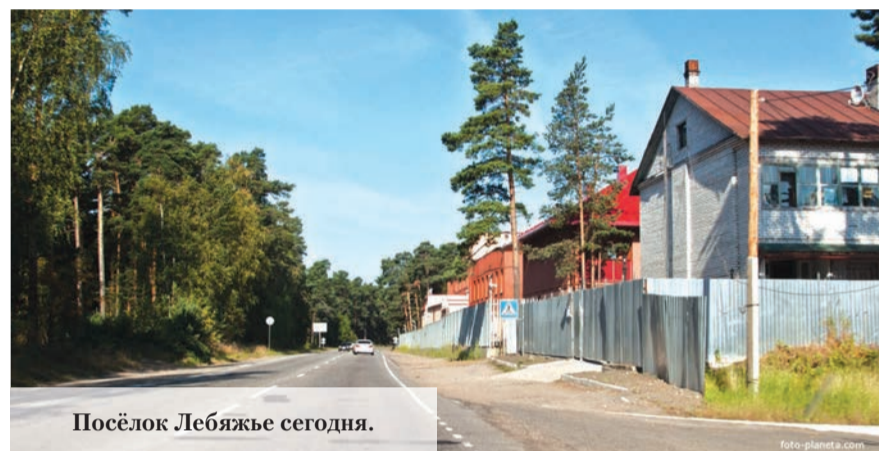
Посёлок Лебяжье сегодня.

минимальная – 45 рублей. Именно летом 1971 года вышло постановление президиума верховного совета СССР о повышении минимальных пенсий рабочим и служащим до 45 рублей, колхозникам до 20 рублей. Магазины Ломоносовторга предлагали в тот год