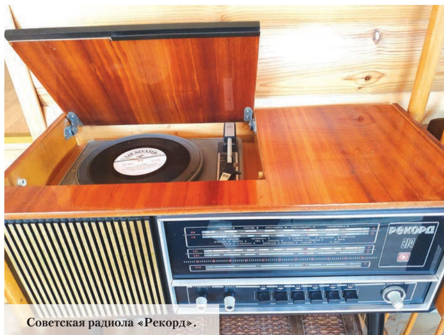
Советская радиолы «Рекорд».