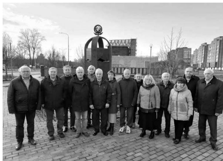
Члены правления Sosnovoborskogo отделения Союза «Чернобыль» у мемориала Ликвидаторам ядерных аварий и катастроф в Sosновом Боре