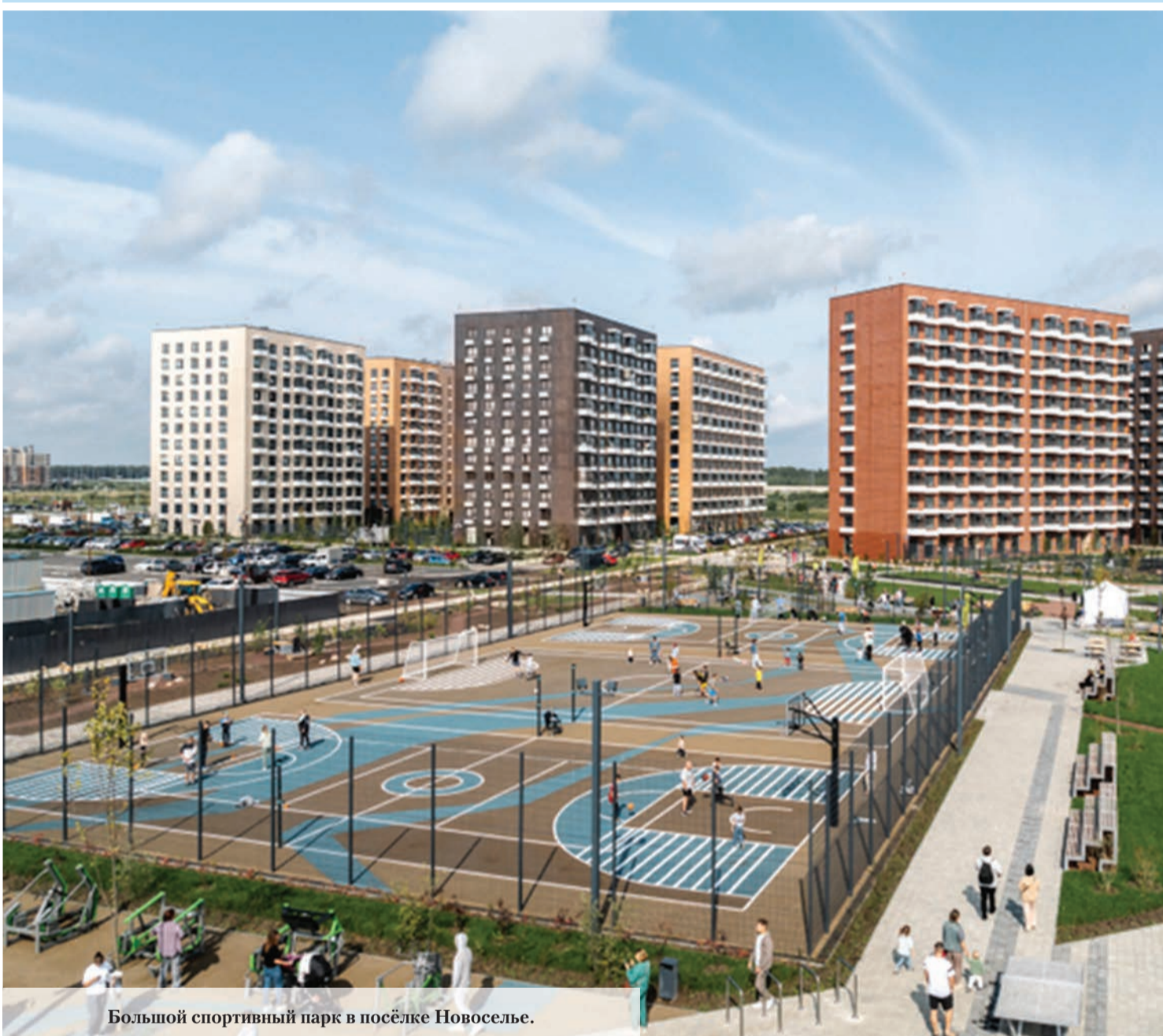
Большой спортивный парк в посёлке Новоселье.

24 апреля 2026 года № 17 (16+) Газета Ломоносовского района, города Ломоносов Петродворцового района. Выходит с 19 апреля 1931 года. www.baltluch.ru