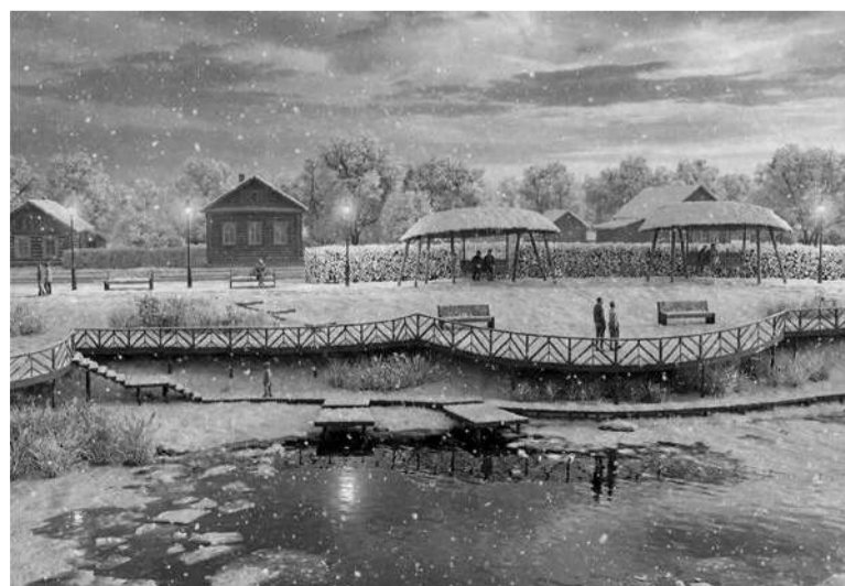
Проект по благоустройству набережной реки Тихвинка, созданный студентами Санкт-Петербургской академии им. А.Л. Штигилицы

ФЕДЕРАЛЬНОЕ ГОЛОСОВАНИЕ ПРОВОДИТСЯ В ГОРОДАХ И ПОСЁЛКАХ, ГДЕ ЖИВЁТ БОЛЬШЕ 20 ТЫСЯЧ ЧЕЛОВЕК, А ТАКЖЕ В ОПОРНЫХ НАСЕЛЁННЫХ ПУНКТАХ.