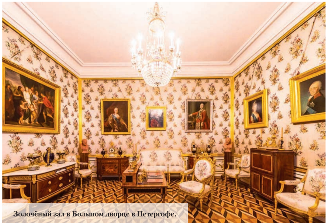
Золочёный зал в Большом дворце в Петергофе.