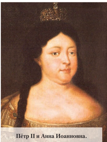
Пётр II и Анна Иоанновна.

Подготовил Г.ХАЛЕМСКИЙ. Фото предоставлены автором.