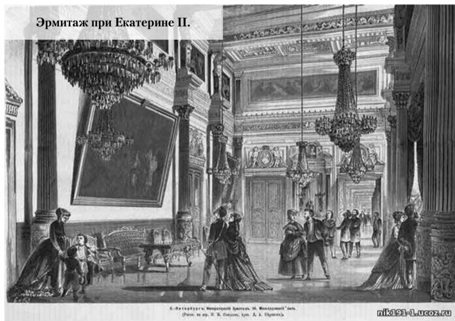
Эрмитаж при Екатерине II.