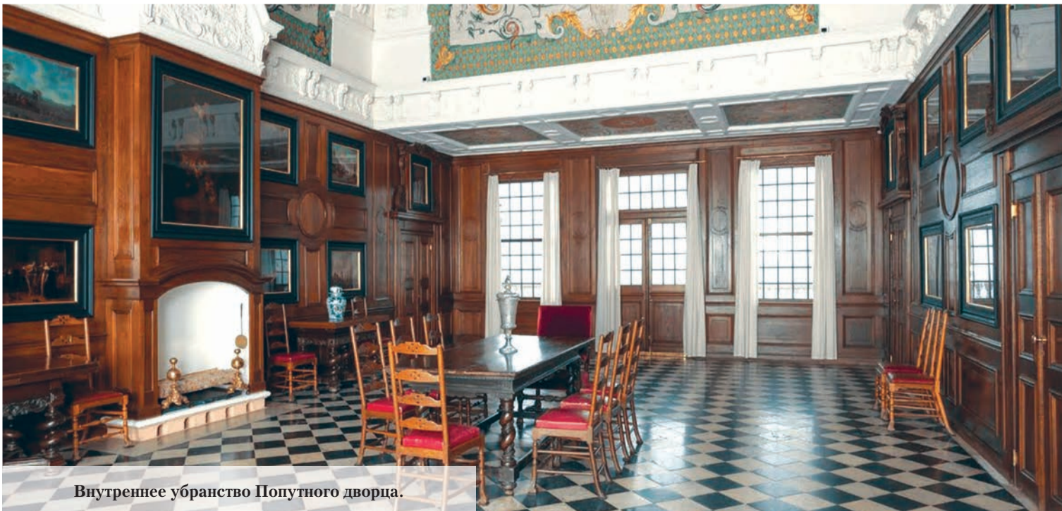
Внутреннее убранство Попутного дворца.

Подготовил Г. ХАЛЕМСКИЙ.