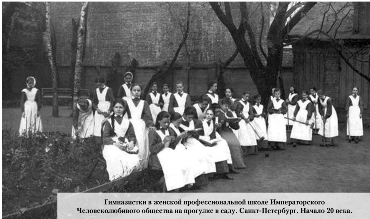
Гимназистки в женской профессиональной школе Императорского Человеколюбивого общества на прогулке в саду. Санкт-Петербург. Начало 20 века.