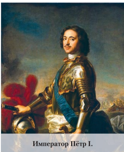
Император Пётр I.

годы – сенатор Российской империи. В 1766-1779 годах – директор Императорских театров. Александр Андреевич Безбородко (1747-1799) – граф, затем светлейший князь; российский государственный деятель. Дача Сансуси – имение Санс-Эннуи (см. №10 «Балтийский луч»).