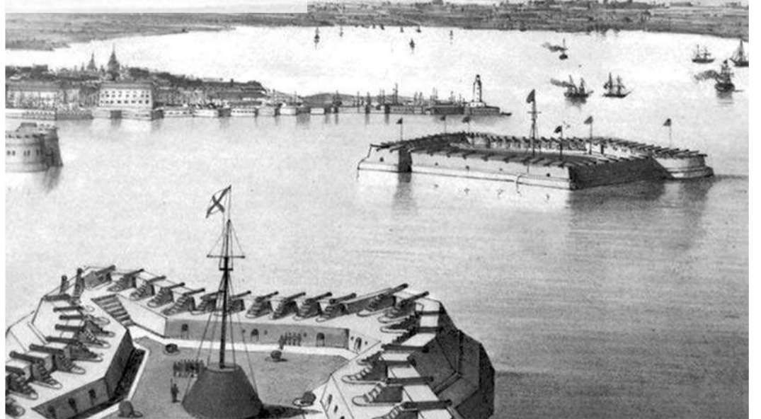
Кронштадт в XVIII веке.