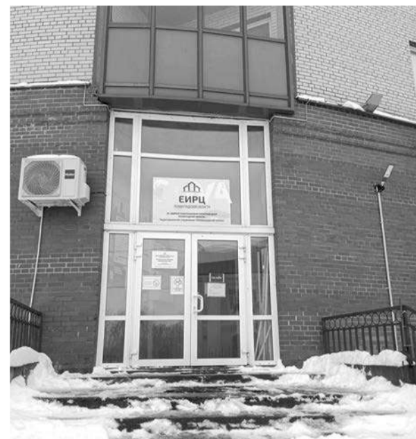
Единый информационно-расчётный центр Ломоносовского района найти в городе Ломоносов не так просто.

чезла. И готовить сани нужно летом. Надеемся, что к следующей зиме ответственный за уборку выше указанной территории на Ораниенбаумском проспекте в городе Ломоносов будет определён. Редакция газеты «Балтийский луч» будет держать этот вопрос на контроле.