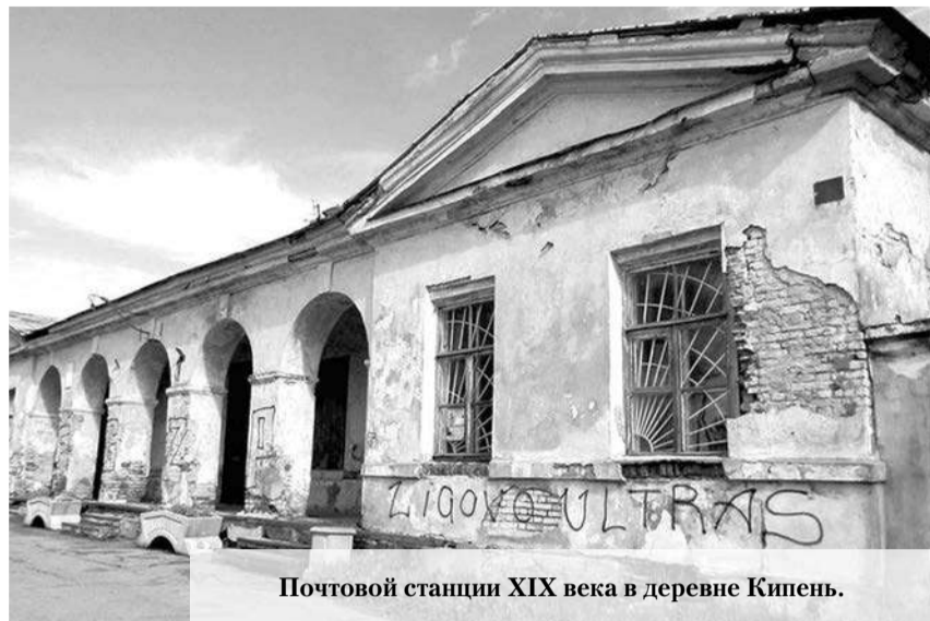
Почтовой станции XIX века в деревне Кипень.

Объявлен конкурс на реставрацию почтовой станции XIX века в Ломоносовском районе Ленинградской области.