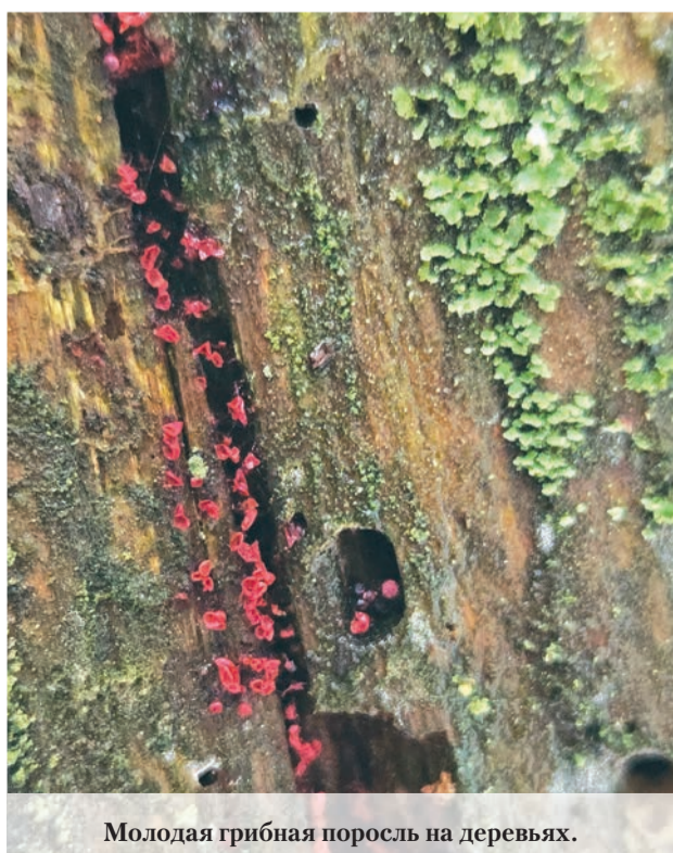
Молодая грибная поросль на деревьях.