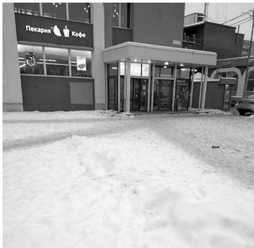
Нечищенный снег на Ораниенбаумском проспекте в Ломоносове теперь растаял, но проблема никуда не делась.