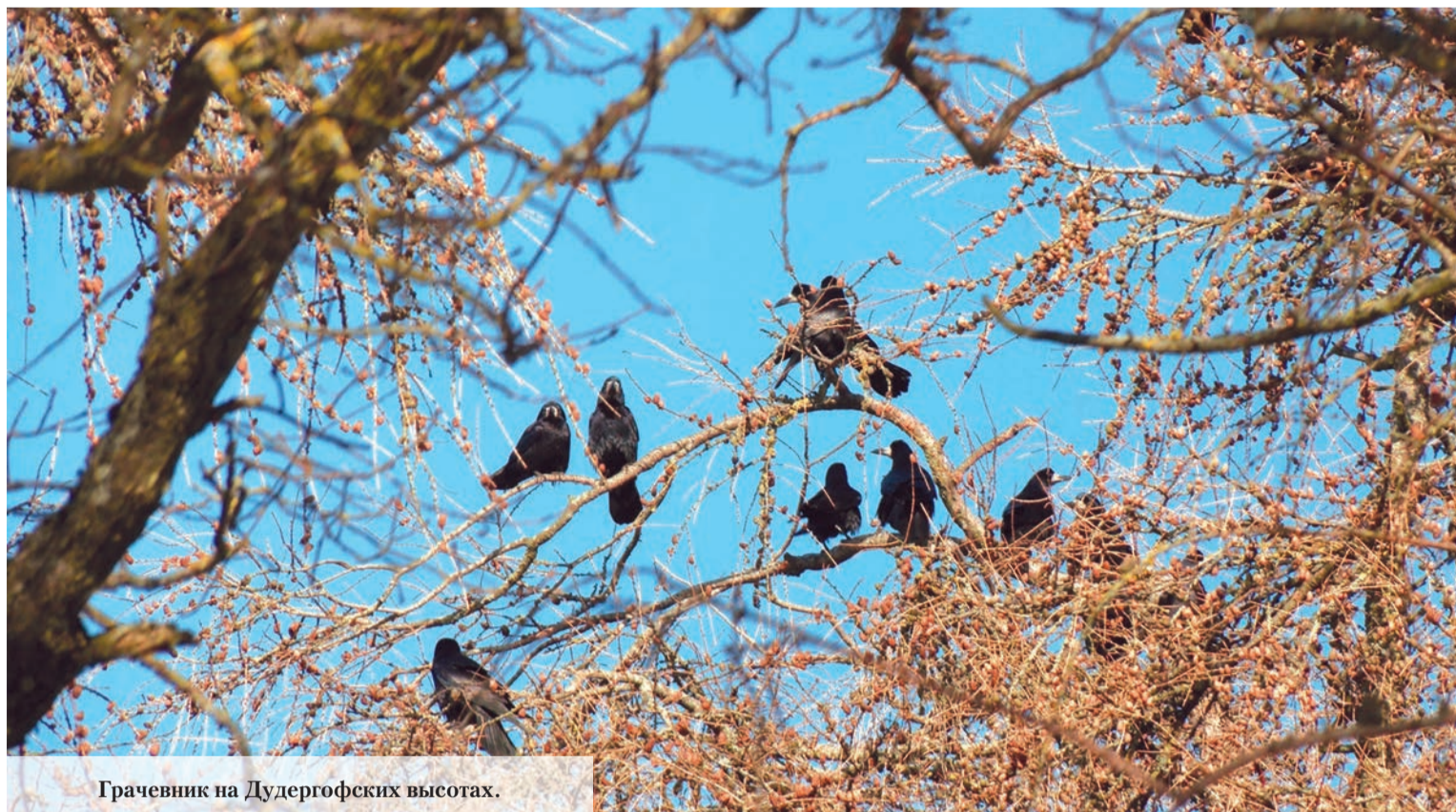
Грачевник на Дудергофских высотах.