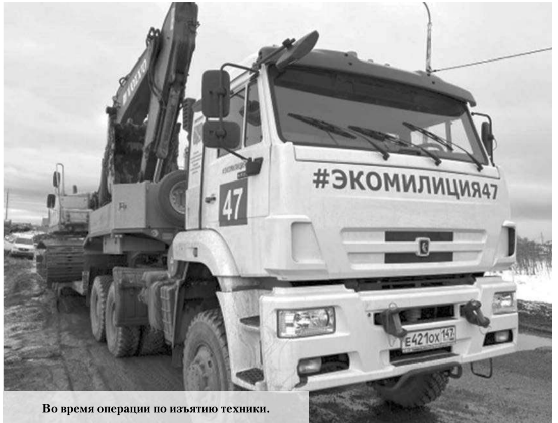
Во время операции по изъятию техники.