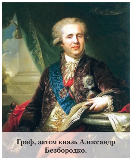
Граф, затем князь Александр Безбородко.