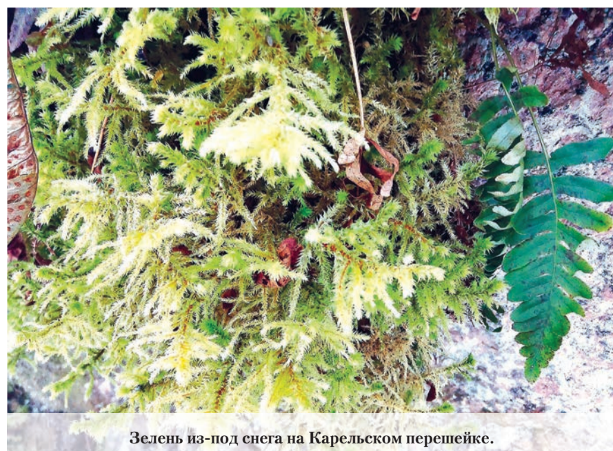
Зелень из-под снега на Карельском перешейке.