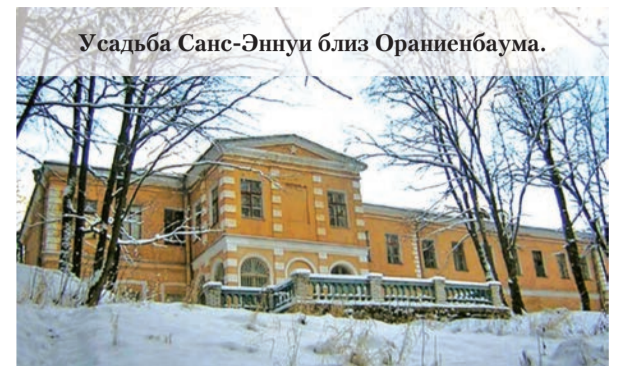
Усадьба Санс-Эннуи близ Ораниенбаума.