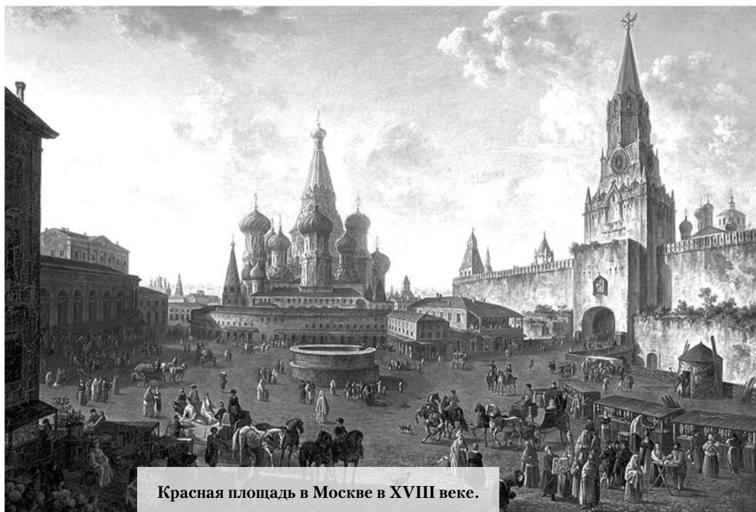
Красная площадь в Москве в XVIII веке.