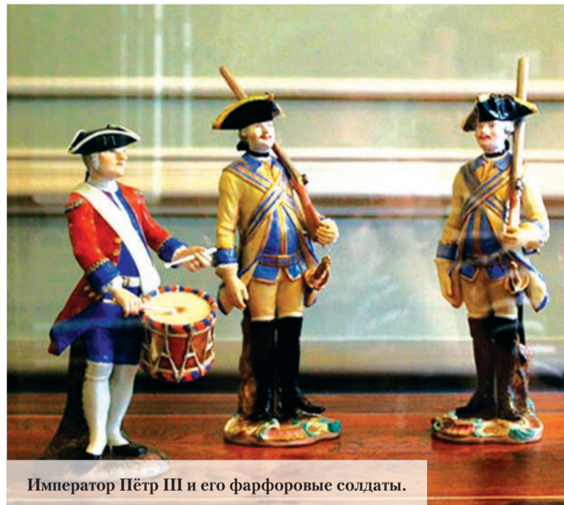
Император Пётр III и его фарфоровые солдаты.

решётки, к ним привязал шнуры; если дернуть за шнурок, медные решётки издавали звук, который, по его мнению, походил на беглый ружейный огонь. С чрезвычайной точностью он чувствовал все придворные праздники, заставляя свои войска стрелять ружейным огнём; сверх того он каждый день разводил патрули, брал несколько кукол, которые должны были играть роль часовых, при чём он сам присутствовал в полном мундире, ботфортах, шпорах и в шарфе. Лакеи, которых он утомлял присутствием на эскерциях, обязаны были являться в полной форме».