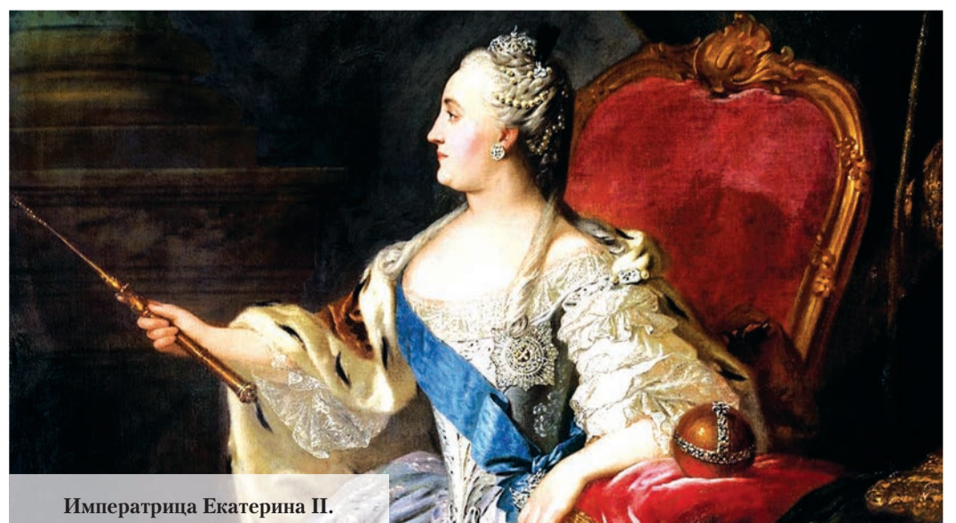
Императрица Екатерина II.

Подготовил Г.ХАЛЕМСКИЙ.