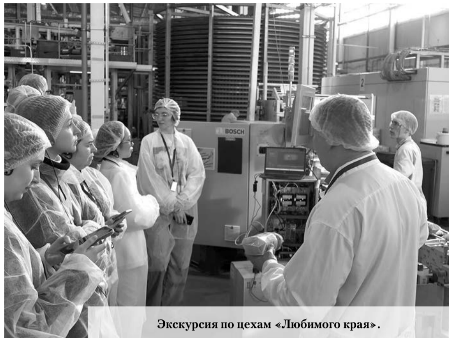
Экскурсия по цехам «Любимого края».

Заседание по развитию промышленного туризма в 47 регионе состоялось на предприятии «Любимый край» в Ломоносовском районе Ленобласти.