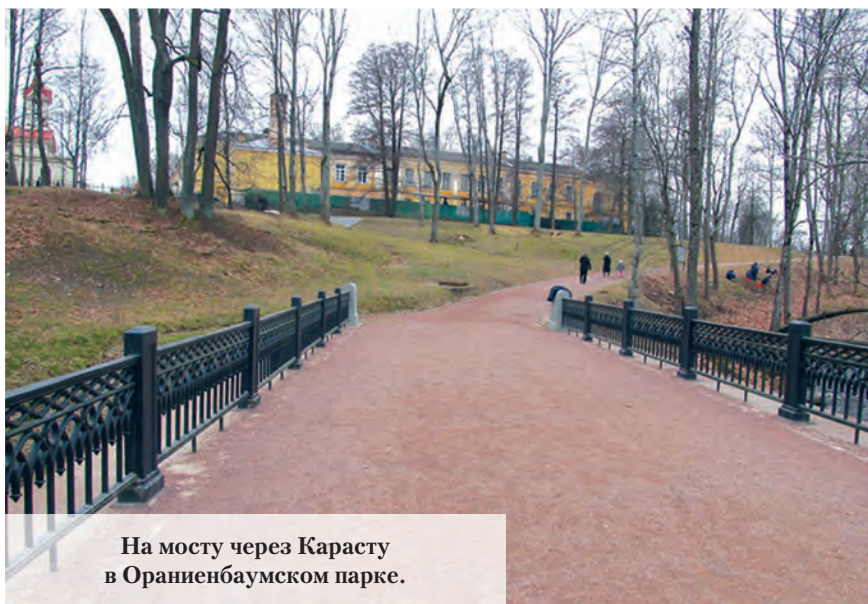
На мосту через Карасту в Ораниенбаумском парке.

тиугольный плац, ограждённый одноэтажными строениями и называвшийся Арсенальным двором. Между ними были расположены Почётные ворота. Вспомнилось детство, когда мы всей семьёй летом отправлялись сюда на прогулку. Это было культурным отдыхом в самом полном смысле этих слов, потому что мы отправлялись на экскурсию в прекрасный парк и его музеи. Помню, как мы любовались удивительными интерьерами Китайского дворца, как наслаждались красотой природы. И почему-то день нашей семейной прогулки был всегда солнечным. Конечно, мне запомнились развлечения в парке – аттракционы с качелями и колесом смеха, так его, кажется, называли. Это был такой смешной аттракцион в круглом павильоне, где все садились в середину круга, и он крутился, как пластинка, а люди по одному слетали с его центра к бортику. Последний человек, который удержался, побеждал и даже, может быть, получал приз. Этого я уже не помню. А в качелях-лодках на цепях (крылатые качели в песне – это, думаю, про них) можно было высоко раскачиваться вдвоём. Рядом можно было летать на самолётиках, кружиться на подвесной карусели и, конечно же, ехать по кругу на лошадках, слонах и верблюдах. И лодочная станция на берегу Нижнего пруда работала. Взяв лодку напрокат, можно было плавать на ней по всему пруду, что мы и делали. А потом, спустившись на проспект Юного Ленинца, ныне