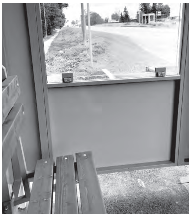
Новая остановка в деревне Яльгелево Ломоносовского района.