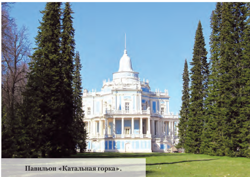
Павильон «Катальная горка».