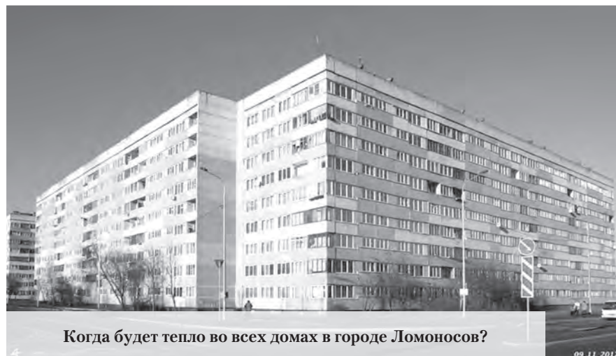
Когда будет тепло во всех домах в городе Ломоносов?

На своей странице ВКонтакте жилищный комитет Санкт-Петербурга отчитывался, что готов к отопительному сезону 2025-2026. Паспорта готовности оформлены на все 24 338 многоквартирных домов в Санкт-Петербурге, куда, как известно, входит город Ломоносов. «В межотопительный период 2025/2026 годов во всех районах города проведены выборочные проверки исполнения планов ремонтных работ, утепления чердачных помещений, технического состояния инженерных систем и помещений индивидуальных тепловых пунктов, работоспособности приборов учёта и автоматических регуляторов температуры, противопожарные тренировки с участием представителей организаций, осуществляющих управление многоквартирными домами, ресурсоснабжающих организаций и городских аварийных служб с различными возможными сценариями возникновения и ликвидации технологических нарушений. Для обеспечения устойчивого функционирования внутридомовых систем тепло-, электро-, газо- и водоснабжения и энергопотребления на базе управляющих организаций сформированы и осуществляют