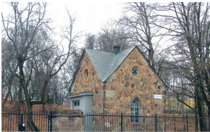
Сторожка у входа в Ораниенбаумский парк с Дворцового проспекта.

из-под обшивки пауков. Не иначе, как красавицей-горкой называли они и дворец «Катальная горка». Но, кроме красоты, поработав там на обмерах всю зиму, я видела и кривизну её колонн – не полагающийся энтазис, и рукодельную косяковость, и неровность расстановки между одинаковыми элементами, и оплывшие разномастные фигурки балясин – каждая в кривом строю со своим брюшком, да ещё и часто посаженные, напоминающие сов, вазы на крыше. Это теперь, двадцать лет спустя, я вижу, что павильон Катальной горки – и вправду красавец, и глаз мой перестал отсчитывать балясины и сравнивать между собой колонны. В крепости Петра третьего были пять бастионов с 12 пушками, а также различные строения: арсенал, казармы, дома офицеров-голландцев и коменданта, гауптвахта, пороховой склад и лютеранская кирха. В центре находился пя-