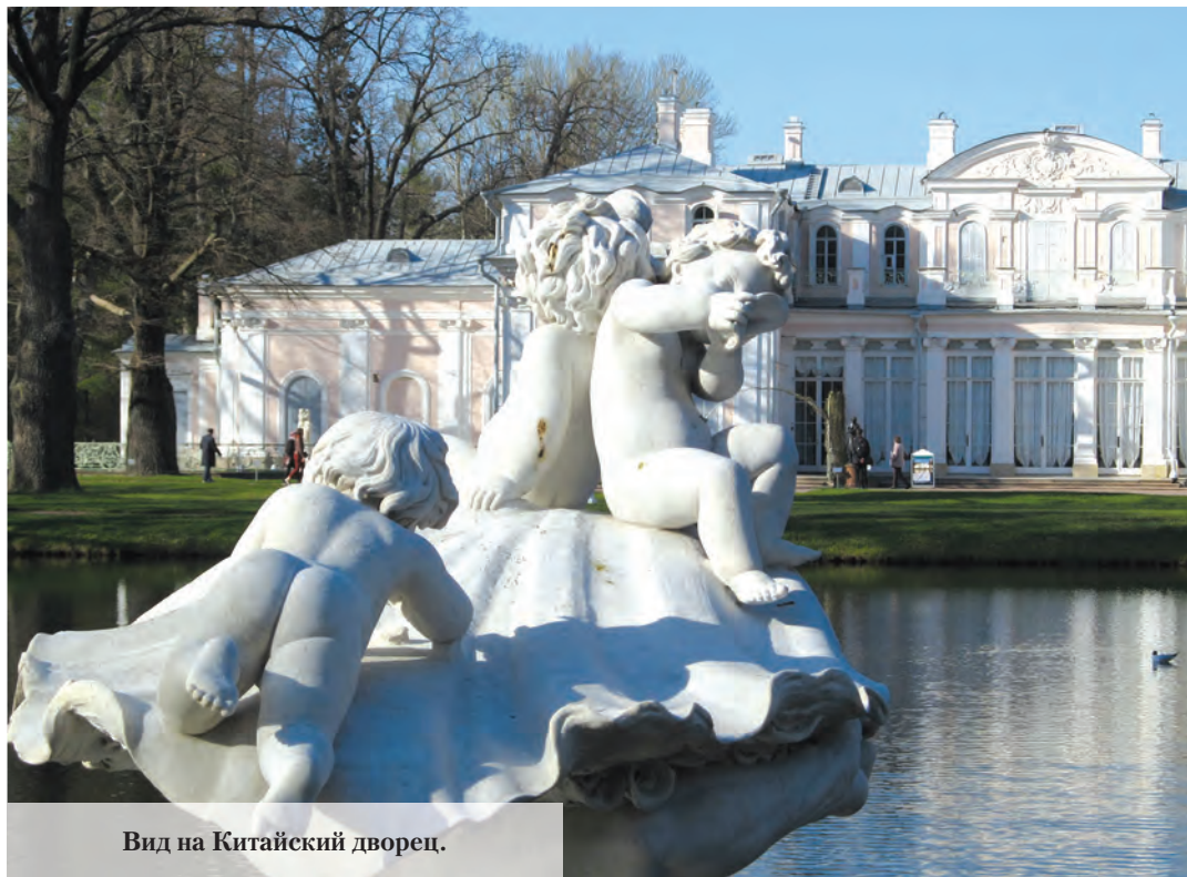
Вид на Китайский дворец.