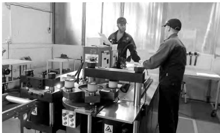
Трансформаторные подстанции завода «СевЗапМонтажАвтоматика» приобретают «Газпром» и «Лукойл»

На Ленинградском заводе «СевЗапМонтажАвтоматика» в посёлке Лукаши продемонстрировали результаты внедрения бережливых технологий в рамках федерального проекта «Производительность труда».