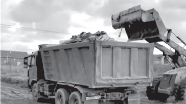
Ликвидация незаконной свалки в поле у поселка Тиммолowo.

Как сообщает 24 сентября прокуратура Ленобласти, за коттеджным посёлком Тиммолowo Аннинского городского поселения Ломоносовского района после вмешательства надзорного ведомства устраняют свалку. Надзорные органы вмешались в ситуацию после сообщения местных жителей о том, что на поле за коттеджным посёлком незаконно завезены отходы и образовалась несанкционированная свалка. Отходы завозили на участок, предназначенный для сельхозиспользования. Владелец нескольких участков в Тиммолowo рассказал 47news, что свалка появилась около месяца назад на окраине коттеджного посёлка, за его территорией. По словам местных жителей, злоумышленники завезли в поле пять-шесть переполненных мусором машин. Очевидцы запомнили