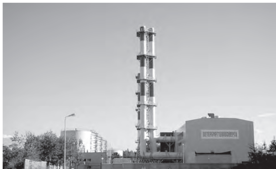
Котельная на улице Федюнинского, За, в городе Ломоносов – один из самых мощных объектов «Петербургтеплоэнерго».