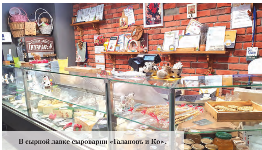
В сырной лавке сыроварни «Галановъ и Ко».

В ходе медиатура в рамках проекта «Сельский туризм в стиле эко», организованного представителями социально-экологического центра устойчивого развития из Пенниковского поселения Ломоносовского района Ленобласти, журналисты «Балтийского луча» побывали на сыроварне «Галановъ и Ко» в деревне Извара Волосовского района Ленобласти. И узнали, в чём залог успеха крестьянского труда, а также секреты сыроварения и рецепты блюд с сыром, которыми делятся с читателями газеты.