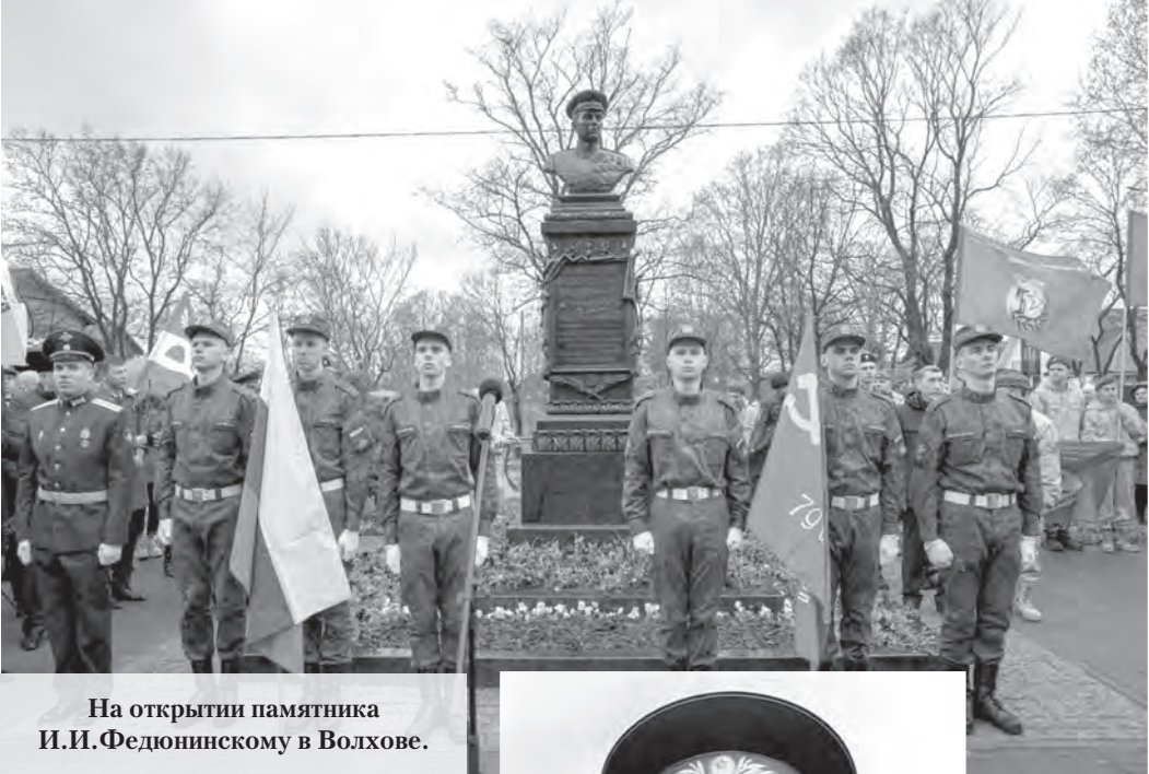
На открытии памятника И.И.Федюнинскому в Волхове.

мандованием Ивана Ивановича Федюнинского участвовали в боях на Западном, Ленинградском, Волховском, Брянском и 2-м Белорусском фронтах, в обороне Ленинграда и прорыве блокады, в Тихвинских оборонительной и наступательной операциях, 1-й Ржевско-Сычёвской наступательной операции, Курской битве, Брянской, Красносельско-Ропшинской, Нарвской, Таллинской, Восточно-Прусской и Берлинской операциях. В октябре 1941 года Иван Иванович Федюнинский был командующим Ленинградским фронтом. За успешные боевые действия руководимые Федюнинским