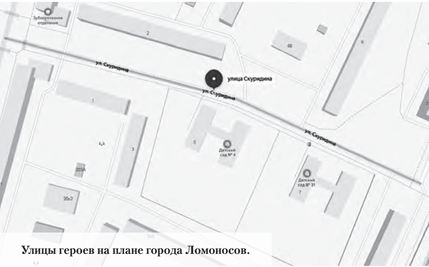
Улицы героев на плане города Ломоносов.