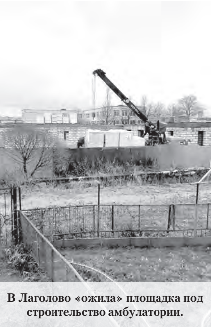
В Лаголово «ожил» площадка под строительство амбулатории.