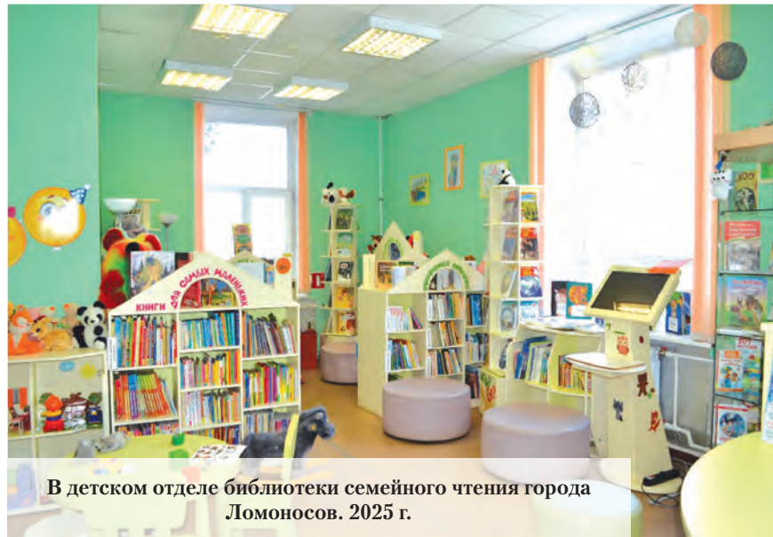
В детском отделе библиотеки семейного чтения города Ломоносов. 2025 г.

В те времена детская библиотека выписывала и по-