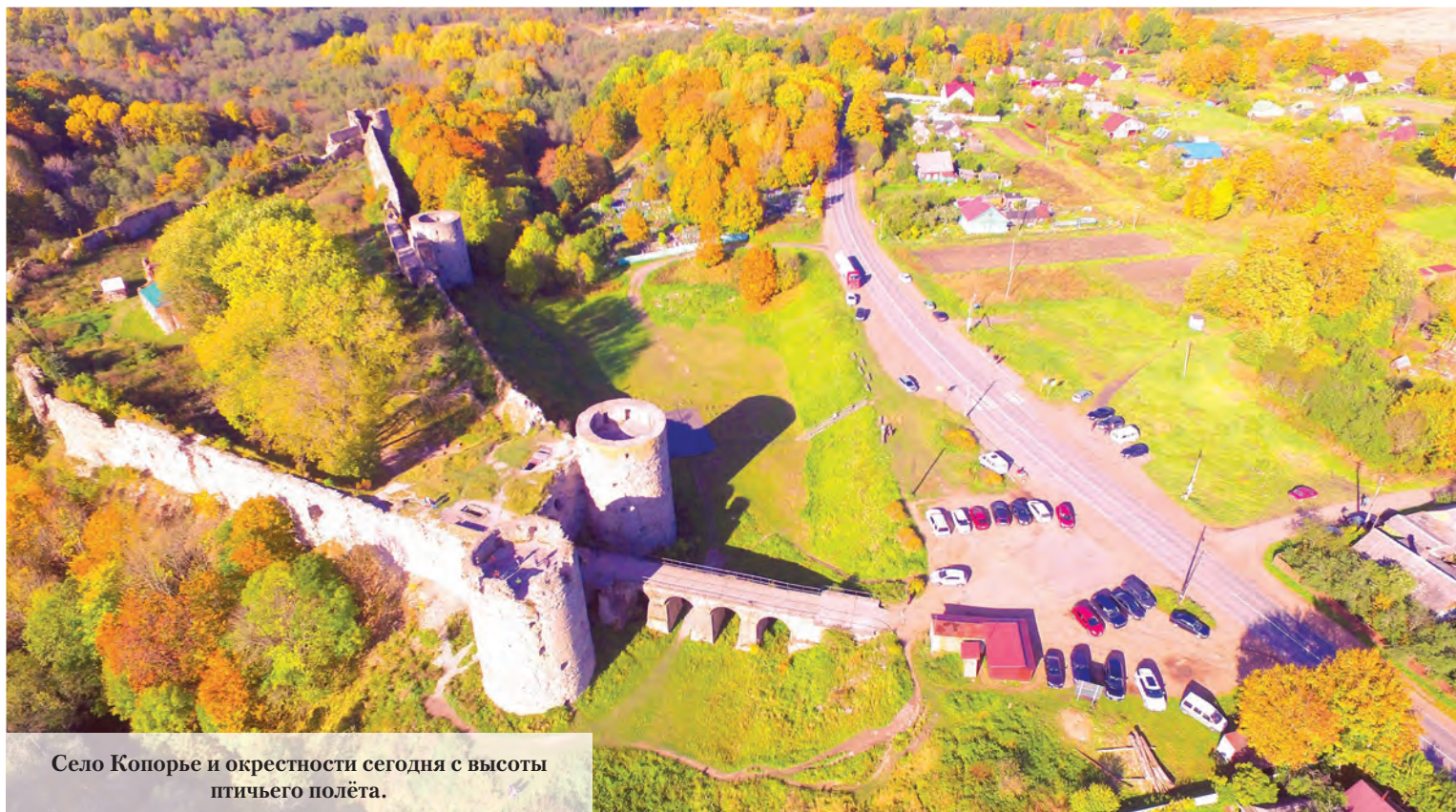
Село Копорье и окрестности сегодня с высоты птичьего полёта.

Источники: РГА ВМФ Ф. Р-92 Оп.2 Д. 182; РГА ВМФ Ф. Р-62 Оп. 2 Д.13; m.wikimedia.org.