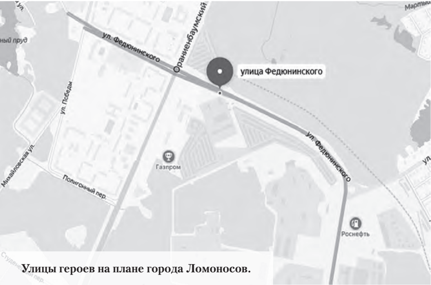
Улицы героев на плане города Ломоносов.

войска двадцать пять раз отмечались в приказах Верховного Главнокомандующего. В декабре 1943 года в звании генерал-лейтенанта Иван Федюнинский назначен командующим 2-й ударной армией под Ленинградом, наносившей удар с Ораниенбаумского плацдарма. Ложным сосредоточением войск и техники на правом фланге ему удалось ввести в заблуждение противника, в то время как основной удар концентрированными силами в середине января был нанесён на главном, Ропшинском, направлении, что привело к соединению с войсками 42-й Армии и разгрому петергофско – стрельнинской группировки гитлеровцев в районе посёлка Ропша Ломоносовского района Ленинградской области. Тем самым был внесён решающий вклад в операцию по полному снятию блокады Ленинграда. Позднее, в первой половине февраля 1944 года, 2-я Ударная Армия