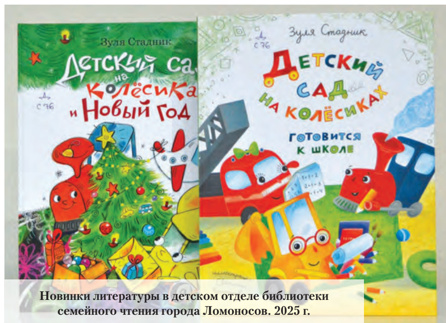
Новинки литературы в детском отделе библиотеки семейного чтения города Ломоносов. 2025 г.