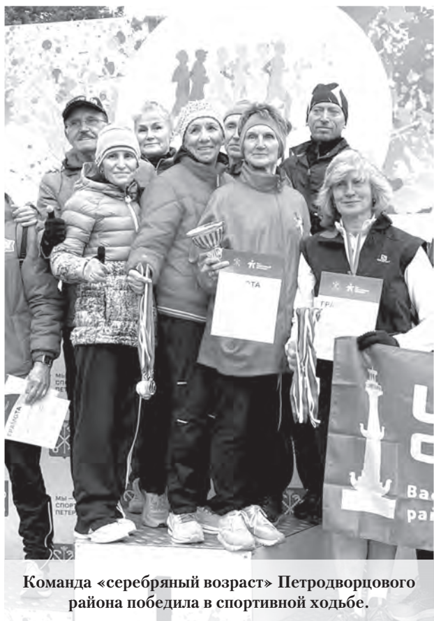
Команда «серебряный возраст» Петродворцового района победила в спортивной ходьбе.

На вопрос «Как прожить долго?» не существует универсального ответа. Однако некоторые секреты долголетия уже раскрыты. Главный ключ к успеху — забота о своём организме и душевном состоянии. Научно доказано, что продолжительность жизни на 25 процентов зависит от генетических факторов и на 75 — от образа жизни, медицинского обеспечения и окружающей среды. То есть наше здоровье и здоровье наших близких в значительной степени зависят от нас самих. В Петродворцовом районе Санкт-Петербурга этой теме уделяется большое внимание благодаря деятельности социально-досуговых отделений комплексного центра социального обслуживания населения в городах Ломоносов, Петергоф и посёлке Стрельна.