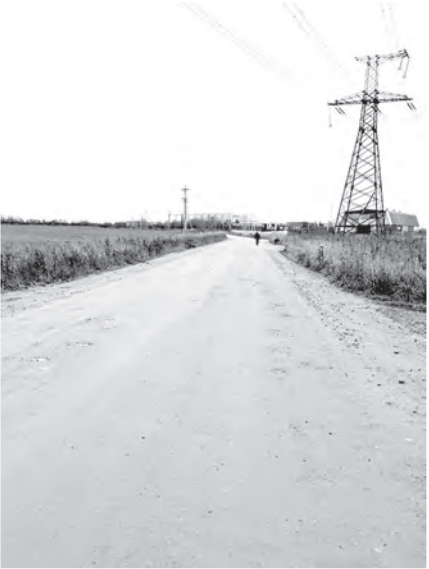
На Инноловском тракте от деревни Алакюля проведено грейдирование.