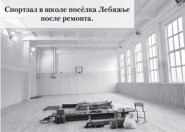
Спортивный зал в школе посёлка Лебяжье после ремонта.

Ещё один вопрос интересует жителей города Ломоносов: почему в дождь улицы поливают? Действительно, мне, например, тоже интересно. В жару можно понять назначение поливальных машин – чтобы пыль сбить и легче дышалось. Но в дождь? И так уже мокро, зачем дополнительно лить воду на до-