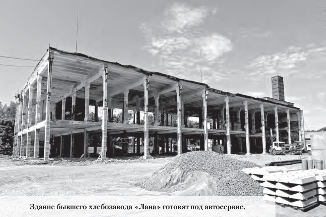
Здание бывшего хлебозавода «Лана» готовят под автосервис.

Этим летом и осенью велись активные дорожно-строительные работы на территории Ломоносовского района Ленинградской области. Даже обратили внимание и на дорогу, до которой, по большому счёту, никому нет дела. Во всяком случае, такое складывалось впечатление у жителей деревни Алакюля Аннинского поселения. Для них полтора