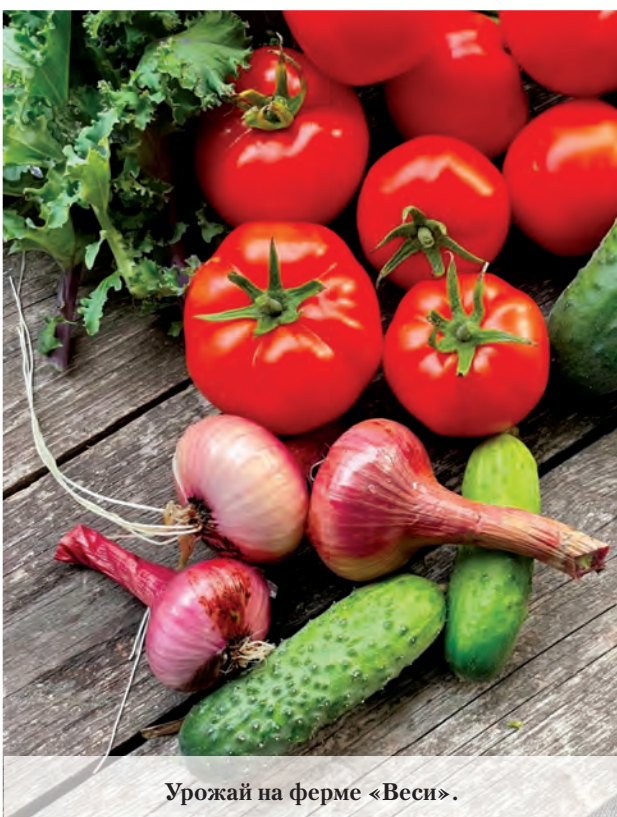
Урожай на ферме «Веси».