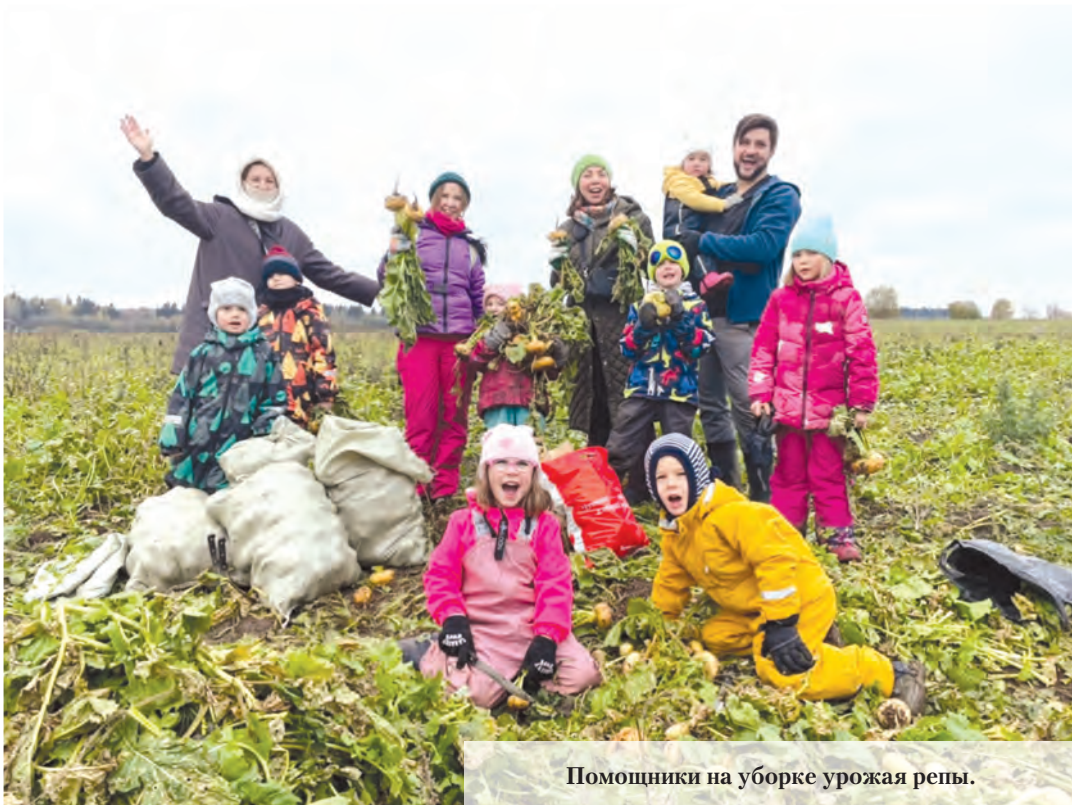
Помощники на уборке урожая репы.