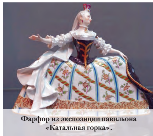
Фарфор из экспозиции павильона «Катальная горка».