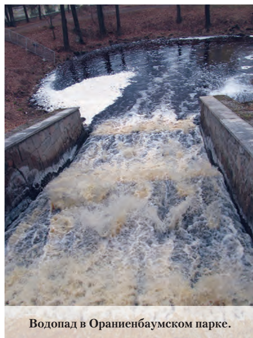
Водопад в Ораниенбаумском парке.