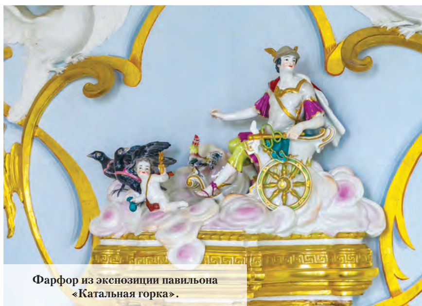
Фарфор из экспозиции павильона «Катальная горка».