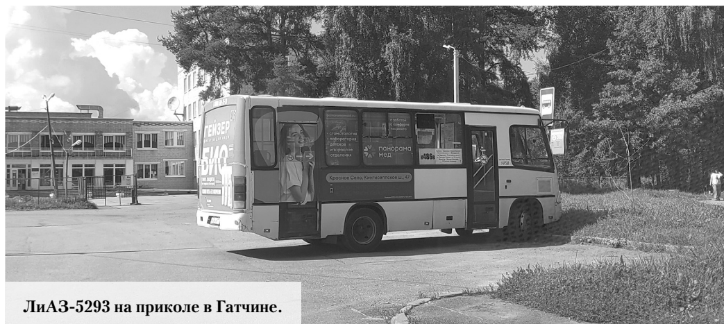
ЛиАЗ-5293 на приколе в Гатчине.