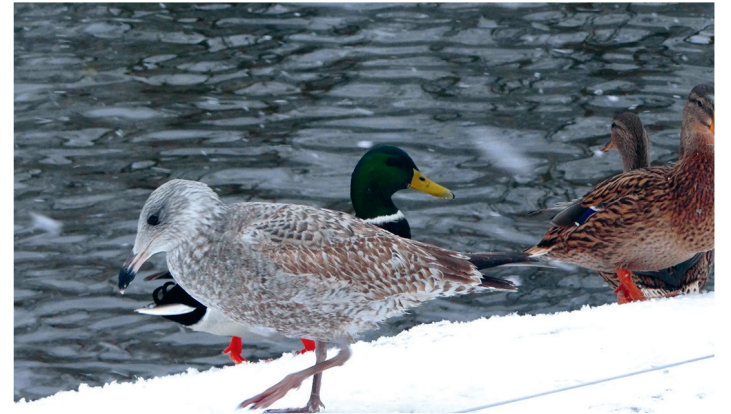
Птицы на Белом озере в Дворцовом парке в Гатчине.

Кроме парка Зверинец множество тропинок пересекают ещё и парк Орловский. У южной границы Зверинца можно наблюдать полуразрушенное одноэтажное здание из камня. Это «Птичный дом», или «Фазанерия», который был построен на рубеже XVIII–XIX веков и предназначался для содержания фазанов. А на довольно большой поляне здесь же сходятся широкие дороги, уводящие в пяти направлениях. Этот главный лесной перекрёсток относится к парку Зверинец. «Пять дорог» – это народное название этого перепутья. Рядом с ним находится настоящее заповедное место, раскинувшееся на площади 30 гектаров под названием «Чудо-поляна». Здесь произрастает около 250 видов растений, среди которых есть реликтовые, краснокнижные и редкие для Ленинградской области: осока теневая и трясуноквидная, валериана двудомная, одуванчик голландский, северные орхидеи, безвременник осенний и прочие. Это место также отличается разнообразием фауны. К примеру, тут водятся огромные виноградные улитки. Название «Чудо-поляна» закрепилось за этим участком в 1978 году после проведения исследований, в результате которых установили, что здесь сохранена реликтовая экосистема, насчитывающая около 10 000