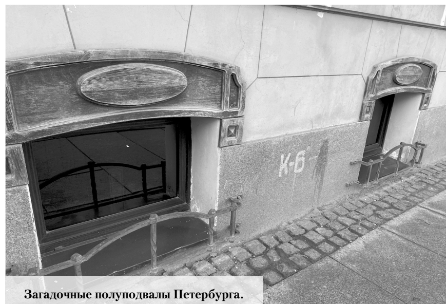
Загадочные полуподвалы Петербурга.

ручным инвентарем. Другая часть лица то ли не доделана, то ли впоследствии разрушена, и здесь уже явно видны следы неуклюжей ручной работы по камню. Остаются и вопросы о том, что находится под слоем грунта, есть ли там продолжение скульптуры в виде тела гиганта? Копать здесь абы кому не положено, раскопки могут вести только специально аккредитованные специалисты, а им на протяжении нескольких сот лет не пришло это в голову. Или им уже известна тайна этой головы?