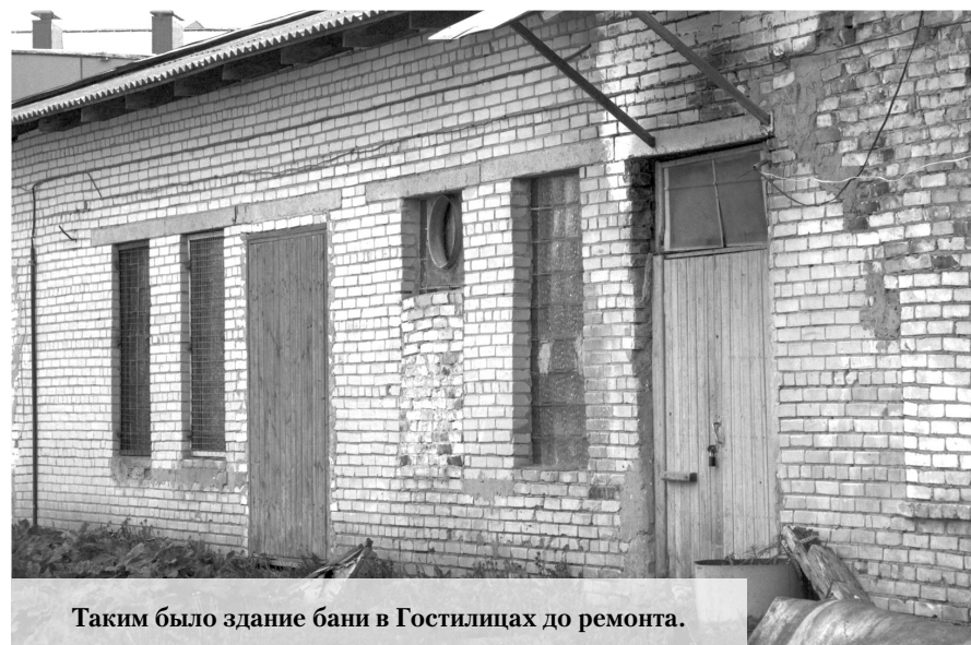
Таким было здание бани в Гостилицах до ремонта.