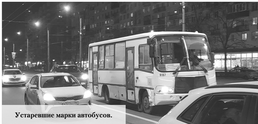
Устаревшие марки автобусов.

с которым я выехал от метро Проспект Ветеранов, и тут увидел, что откуда-то со стороны Кипени выехал пятый автобус с таким же номером. Впрочем, при полном выпуске пять их становилось и в прошлом году. Справедливости ради надо сказать, что вечером этого же дня