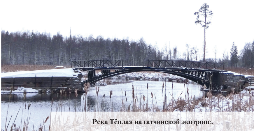
Река Тёплая на гатчинской экотропе.

региона». Они ищут и очищают домики с дуплом для мелких пернатых и платформы для крупных птиц от мусора и старых гнёзд, обрабатывают их