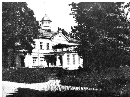
Санаторий Содестрака для желудочных больных в Ольгино (под Ленинградом)

фон Карлова: «между шоссе и побережьем на этом месте находился большой кирпичный завод, который, право же, портил ландшафт». Это был завод, располагавшийся в имении Ольгино в одноимённой деревне Петергофского уезда. Разрешение на его постройку было выдано в 1898 году. Он принадлежал действительному статскому советнику Ивану Ивановичу Арронету (1829-1907), происходившему из латвийских немцев. После революции, в 1921 году, в стенах бывшего романти-