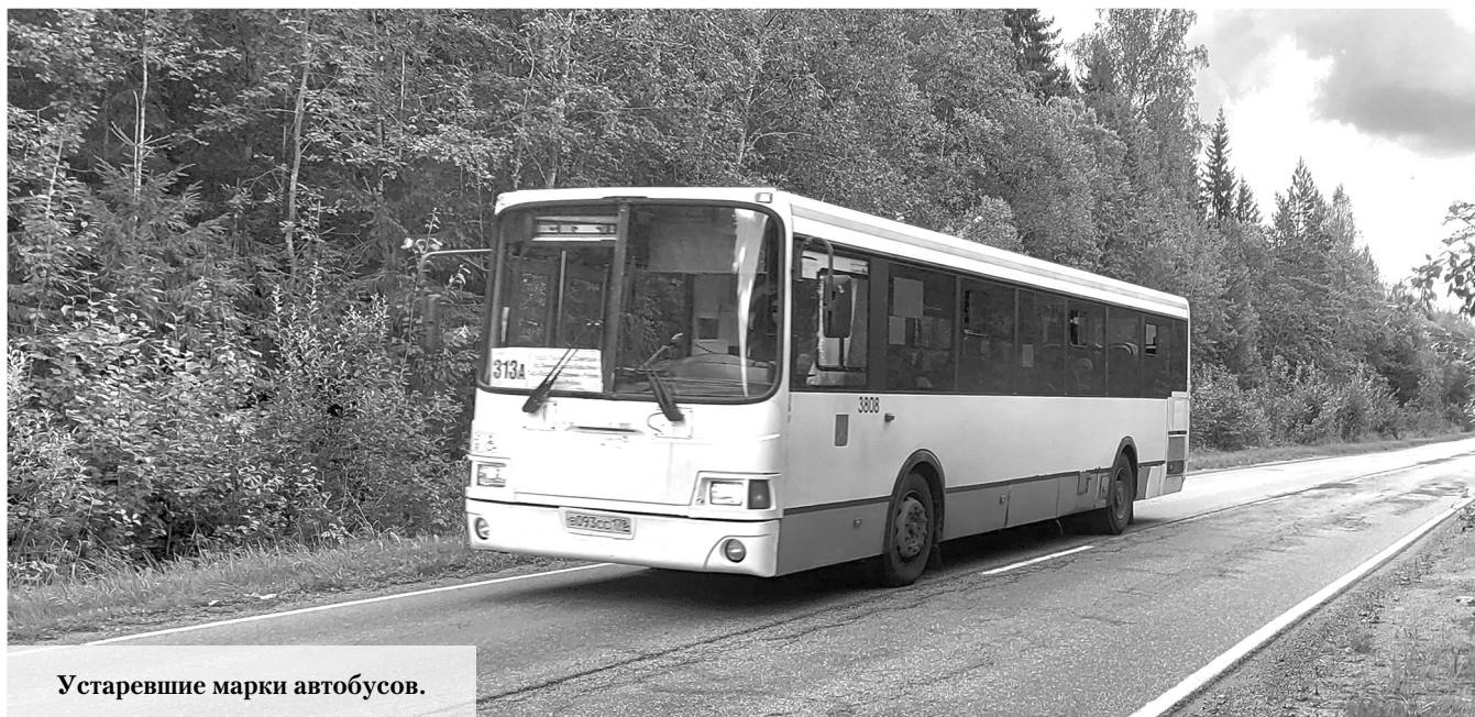
Устаревшие марки автобусов.