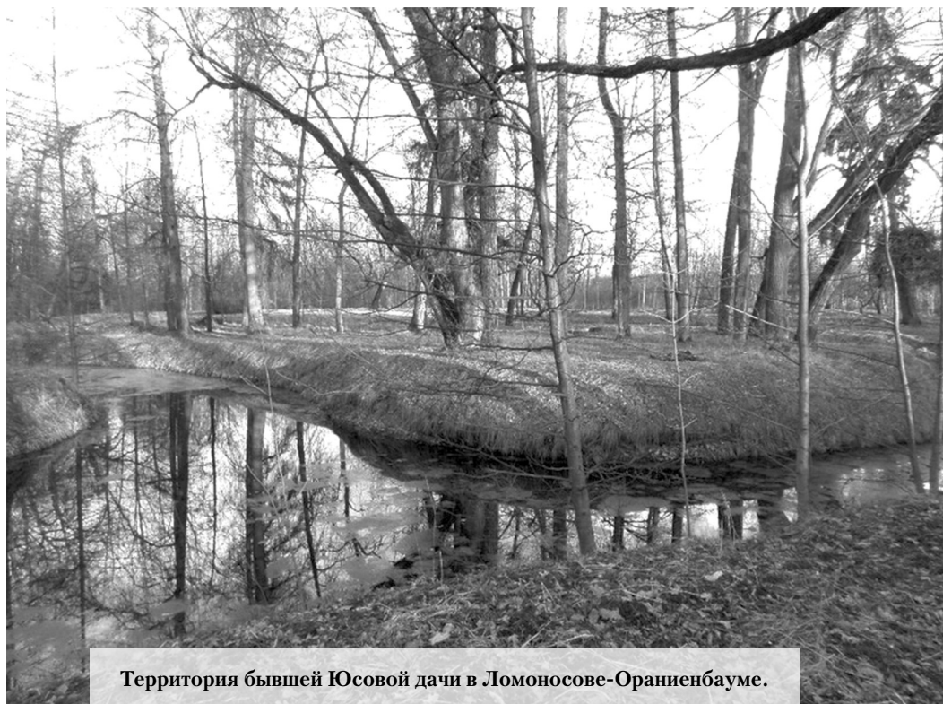
Территория бывшей Юсовой дачи в Ломоносове-Ораниенбауме.