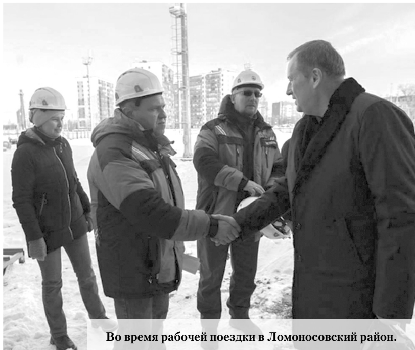
Во время рабочей поездки в Ломоносовский район.

Губернатор Ленинградской области Александр Дрозденко в ходе рабочей поездки в Ломоносовский район посетил социальные учреждения в Аннинском городском поселении.