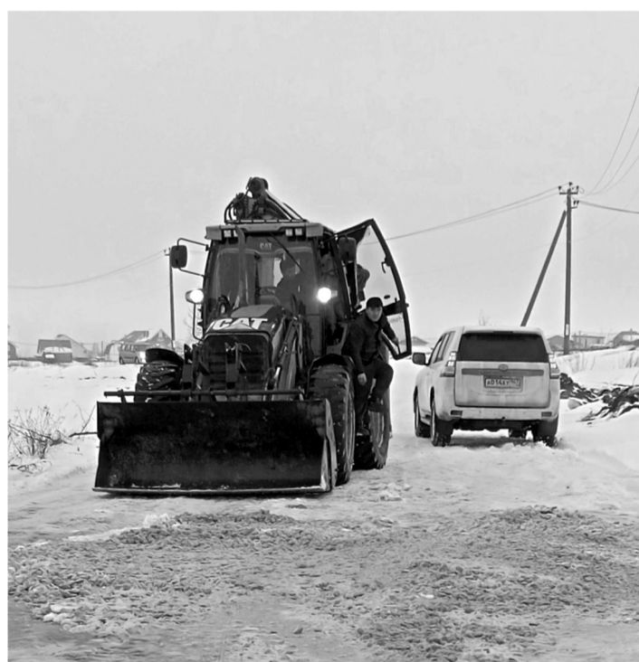
Силами Ропшинской администрации промоина на дороге засыпана.