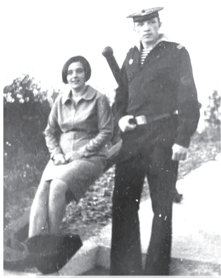
Форт Красная Горка, 1967 год.

Что есть любовь? У каждого человека на этот счёт своё мнение. Поэт Степан Щипачёв, например, сравнивал любовь с хорошей песней, «а песню нелегко сложить». Я не задавала этот извечный вопрос героям сегодняшней публикации, отметившим не так давно изумрудную свадьбу, но почему-то кажется, что, если любовь – это песня, то им по душе та, которая складывается легко: с ноты – на ноту, с облачка – на облачко, со строчки – на строчку. Возьму на себя смелость предположить, что любовь для них – это раздавать друг другу крылья, чтобы реализоваться профессионально и творчески не вопреки, а благодаря семье, вместе растить детей, гордиться их успехами, радоваться, какие они получились замечательные. И не уставать восхищаться друг другом и удивлять друг друга даже спустя 55 лет совместной жизни.