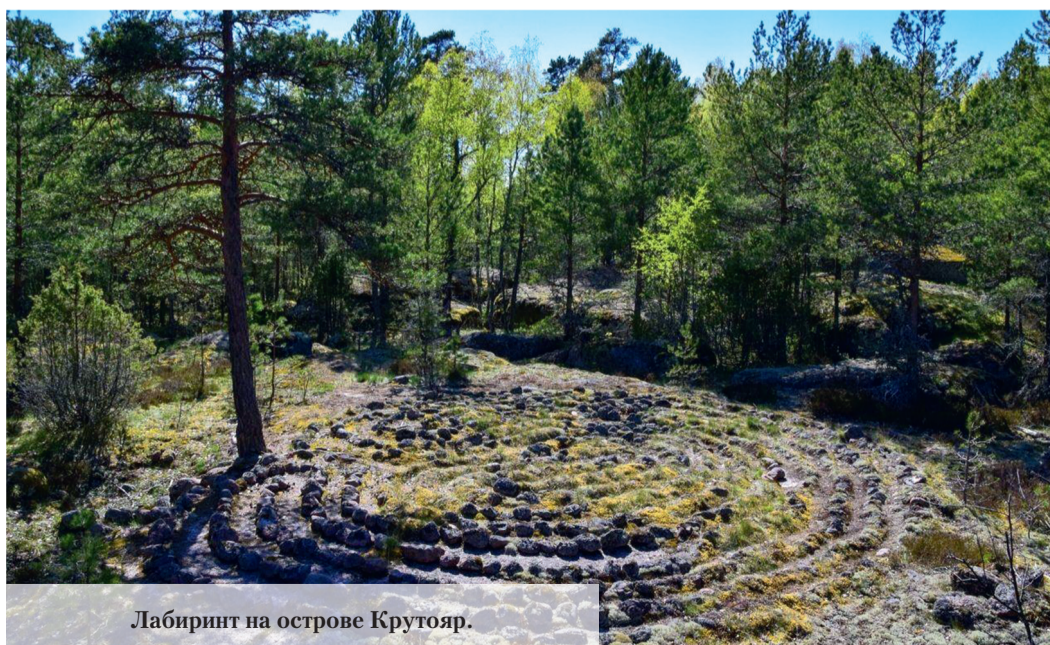
Лабиринт на острове Крутояр.

жерея, теплица, дом садовника. «Мы поискали в некогда великолепном ропшинском парке мега-лиственницу, – продолжают рассказ путешественники. – Зашли на лечебный источник «Иордань» – это одна из самых интересных достопримечательностей Ропши. Он наполняется подземными водами. Вода очень чистая, прозрачная и имеет изумрудный оттенок. Посмотрели на единственное целое старинное здание в Ропше, построенное при Екатерине Второй – бумажную фабрику. Она появилась в 1788-1794 годы. Сейчас здесь рыбное хозяйство. Разводят ценные породы рыб и раков». В посёлке Ропша недавно создали уникальное общественное пространство «Китайский сад» – эта достопримечательность тоже пользуется спросом у туристов. Гово-