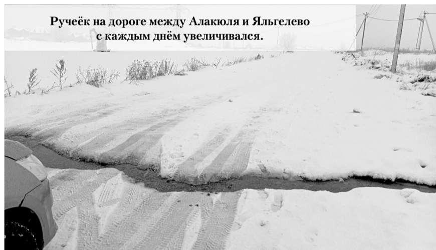
Ручеёк на дороге между Алакуля и Яльгелево с каждым днём увеличивался.

так думала. Чтобы попасть на повторный приём к терапевту с проведёнными исследованиями на руках, я всё-таки решила попытать счастья и позвонила в кол-центр Ломоносовской межрайонной больницы имени И.Н.Юдченко, где мне сказали – сегодня всё занято, а на завтра можем вас записать. Так просто? Представьте себе – да. Никакой очереди в рентген кабинет, их теперь в межрайонной больнице, если не ошибаюсь, три. Для экономии времени я обратилась в кассу платных услуг, стоимость рентгенологического исследования оказалась приемлемой. А приём у врача – бесплатный при наличии медицинского страхового полиса. Номер телефона кол-центра Ломоносовской межрайонной больницы: 679-29-47, часы работы: ежедневно, кроме выходных и праздничных дней с 9.00 до 17.00.