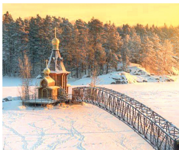
Храм Андрея Первозванного на Вуоксе.