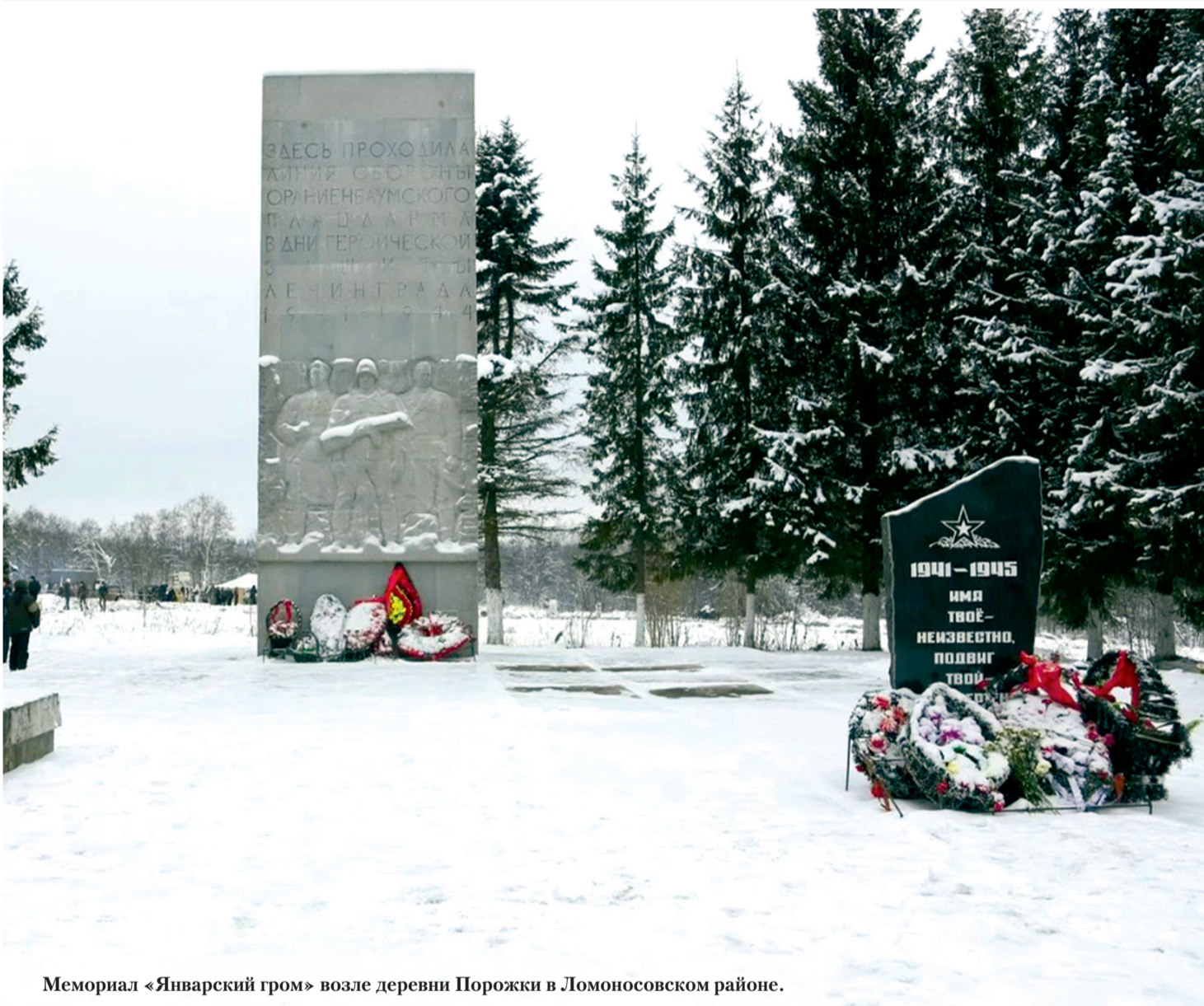
Мемориал «Январский гром» возле деревни Порожки в Ломоносовском районе.

17 января 2025 года № 3 (16+) Газета Ломоносовского района, города Ломоносов Петродворцового района. Выходит с 19 апреля 1931 года. www.baltluch.ru