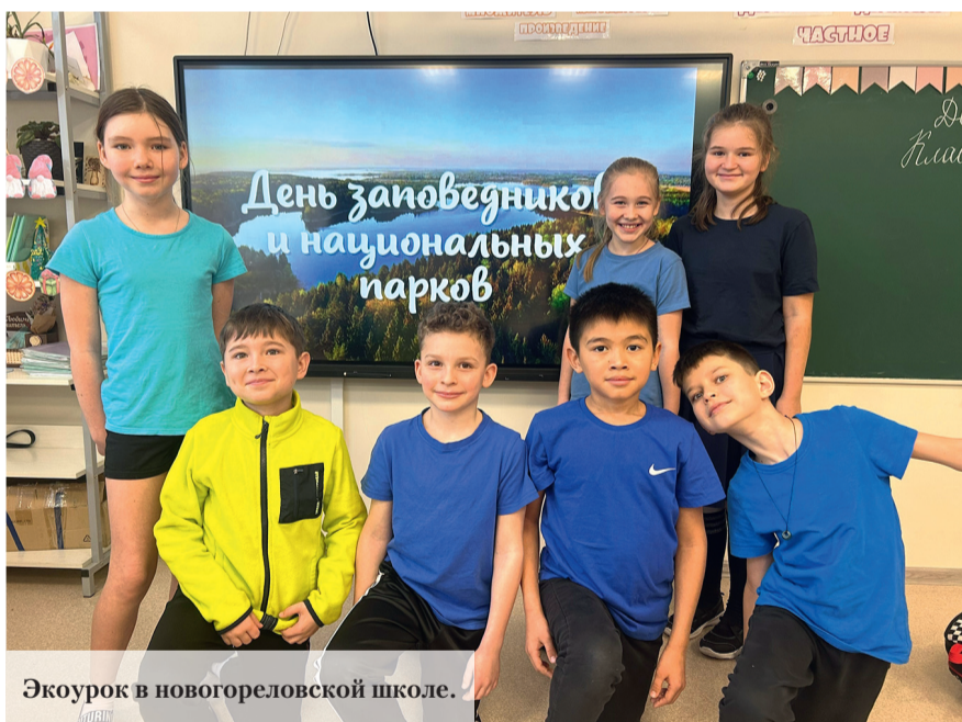
Экоурок в новогореловской школе.