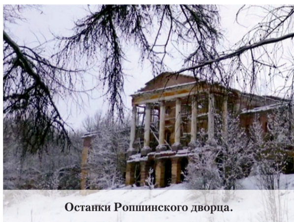
Останки Ропшинского дворца.