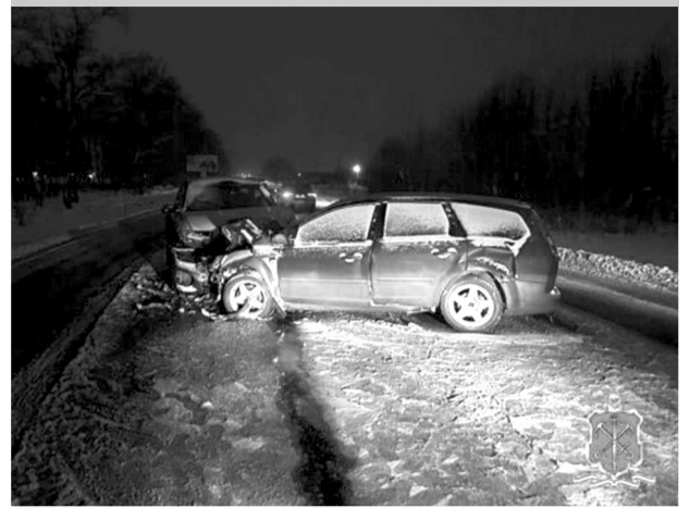
Авария на двадцатом километре автодороги «Анташи – Ропша – Красное Село».