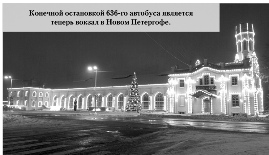
Конечной остановкой 636-го автобуса является теперь вокзал в Новом Петергофе.

Что ещё я проверила на себе за время новогодних каникул? С первых дней нового года меня угораздило заболеть – то ли вирус, то ли простуда, одно другого не легче. И почему-то, когда дело касается тебя лично, наступает полная беспомощность: куда обратиться, что делать? А тут ещё вступают в силу собственные убеждения, которые прочно свили гнездо в сознании. Приведу пример: лет несколько назад я решила записаться на приём к терапевту в консультативную поликлинику Ломоносовского района, которая находится в Ломоносове. Поскольку я работаю в Ломоносове, мне так было удобно. Но в регистратуре на тот момент мне сказали, что я могу записаться на приём только в амбулатории того поселения, где я прописана. И это во мне так прочно засело, что в этот раз, заболев, я даже не предприняла попытки позвонить в районную поликлинику, решив, что в праздничные дни врачи уж точно не ведут приём пациентов. Обратилась в платную клинику в Красном Селе. Понятно, что деньги платить не хочется при наличии медицинского страхового полиса, но куда деваться? Если уже в платных клиниках запись на рентген и на приём к врачу распланирована на несколько дней вперёд, то что говорить о бесплатной медицине? – думала я. Как оказалось, напрасно я