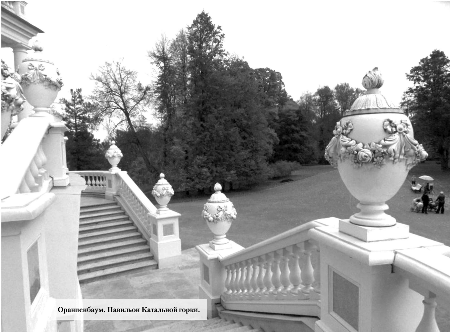
Ораниенбаум. Павильон Каталной горки.