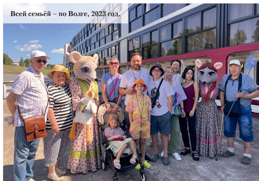
Всей семьёй – по Волге, 2023 год.