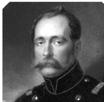
Один из владельцев Ораниенбаума великий князь Михаил Павлович.

и все сословия, упразднено декретом ВЦИК и совета народных комиссаров в 1917 году «Об уничтожении сословий и гражданских чинов».