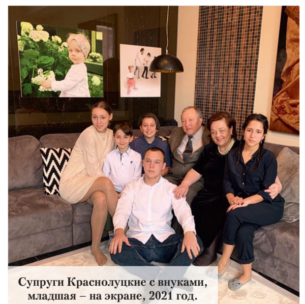
Супруги Краснолуцкие с внуками, младшая – на экране, 2021 год.