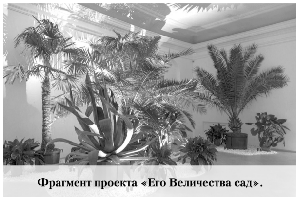
Фрагмент проекта «Его Величества сад».

До 2 марта жители Ломоносовского района и города Ломоносов могут посетить историческую экспозицию в государственном музее-заповеднике «Петергоф».