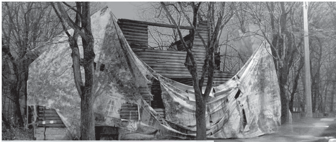
Опасный дом-недострой на улице Владимирская в Ломоносове представляет собой унылое зрелище.