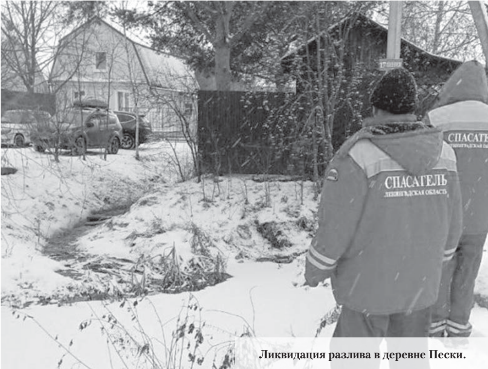
Ликвидация разлива в деревне Пески.