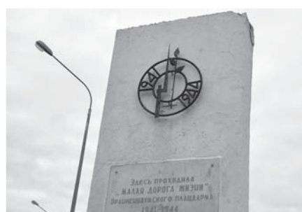
Стела «Малая дорога жизни» находится пока на прежнем месте.

17 декабря 1941 года из деревни Малая Ижора в шести километрах западнее Ораниенбаума (ныне город Ломоносов) на лёд Финского залива вышла первая автоколонна, взявшая направление на посёлок Лисий Нос. Так начала действовать ледовая дорога, связывавшая Ленинград и Ораниенбаум. Малая дорога жизни действовала все три блокадные зимы и сыграла важнейшую роль в обороне Ленинграда. Первоначально памятный знак о том, что здесь в 1941-1944 годах проходила малая дорога жизни, в виде щита был установлен в 1965 году у самого уреза воды Финского залива. Берег наступал, удалялось от воды и место размещения памятника. В 1974 году памятник изменил свой внешний вид, став