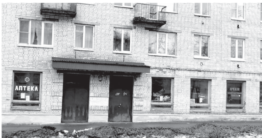
Помещения бывшей аптеки на улице Победы в Ломоносове ожидают перемены.

А пока в преддверии новогодних праздников даём неспрашивая, но своевременные напутствия от медицинских работников Ломоносовской межрайонной больницы имени И.Н.Юдченко. С 23 декабря по 5 января в рамках плана проведения региональных тематических мероприятий по профилактике заболеваний и поддержке здорового образа жизни министерства здравоохранения РФ проводится неделя профилактики злоупотребления алкоголем в новогодние праздники. По статистике, в России постепенно снижается число людей, употребляющих алкоголь. По данным всероссийского центра изучения общественного мнения, с декабря 2020 по август 2024 года количество людей, которые не пьют алкоголь или стали меньше его употреблять, выросло с 48-ми до 65