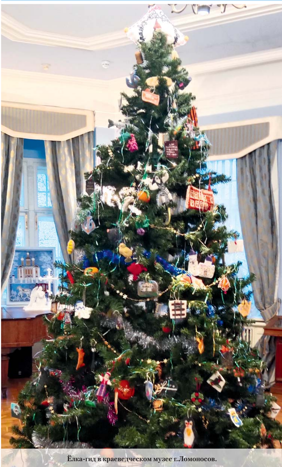
Ёлка-гид в краеведческом музее г. Ломоносов.

27 декабря 2024 года № 52 (16+) Газета Ломоносовского района, города Ломоносов Петродворцового района. Выходит с 19 апреля 1931 года. www.baltluch.ru