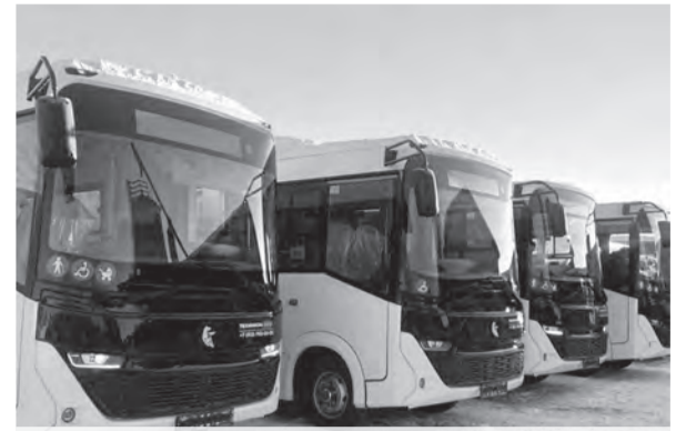
На некоторые маршруты в Ломоносовском районе выйдут автобусы марки КАМАЗ