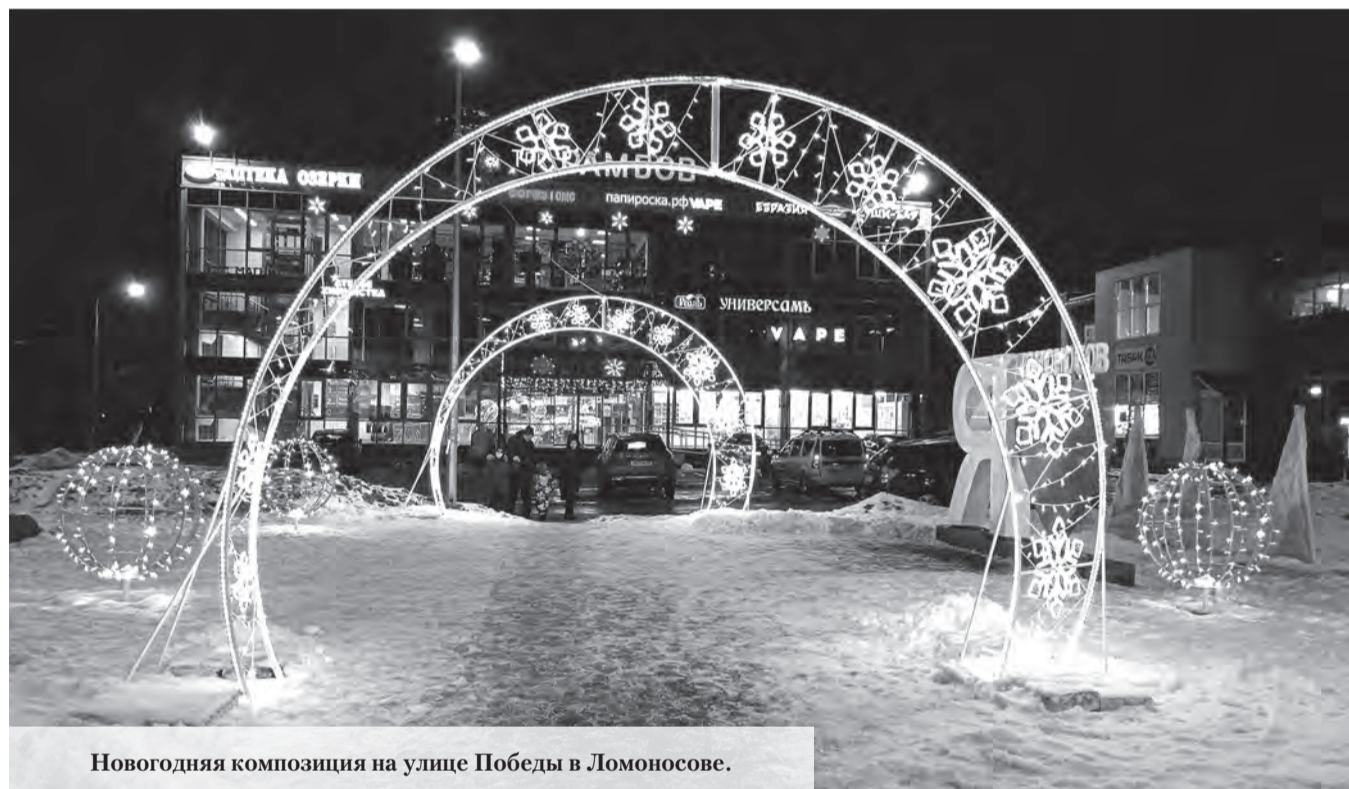
Новогодняя композиция на улице Победы в Ломоносове.

Сложно представить снежную зиму без активного катания с горок. Но нельзя забывать о правилах безопасности. Администрация муниципального образования город Ломоносов обращается к жителям с предупреждением о том, что катание с крутых склонов, горок и оврагов, в частности, со склона