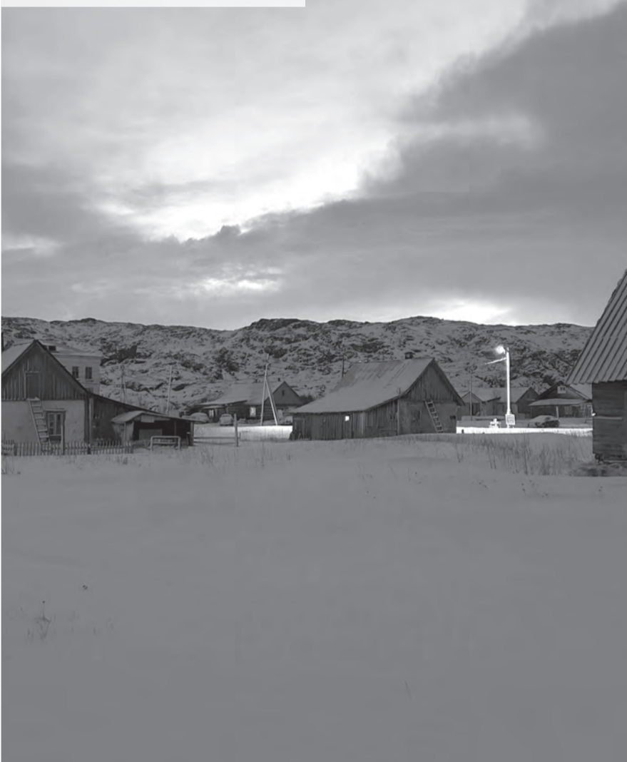
Утро в Териберке.