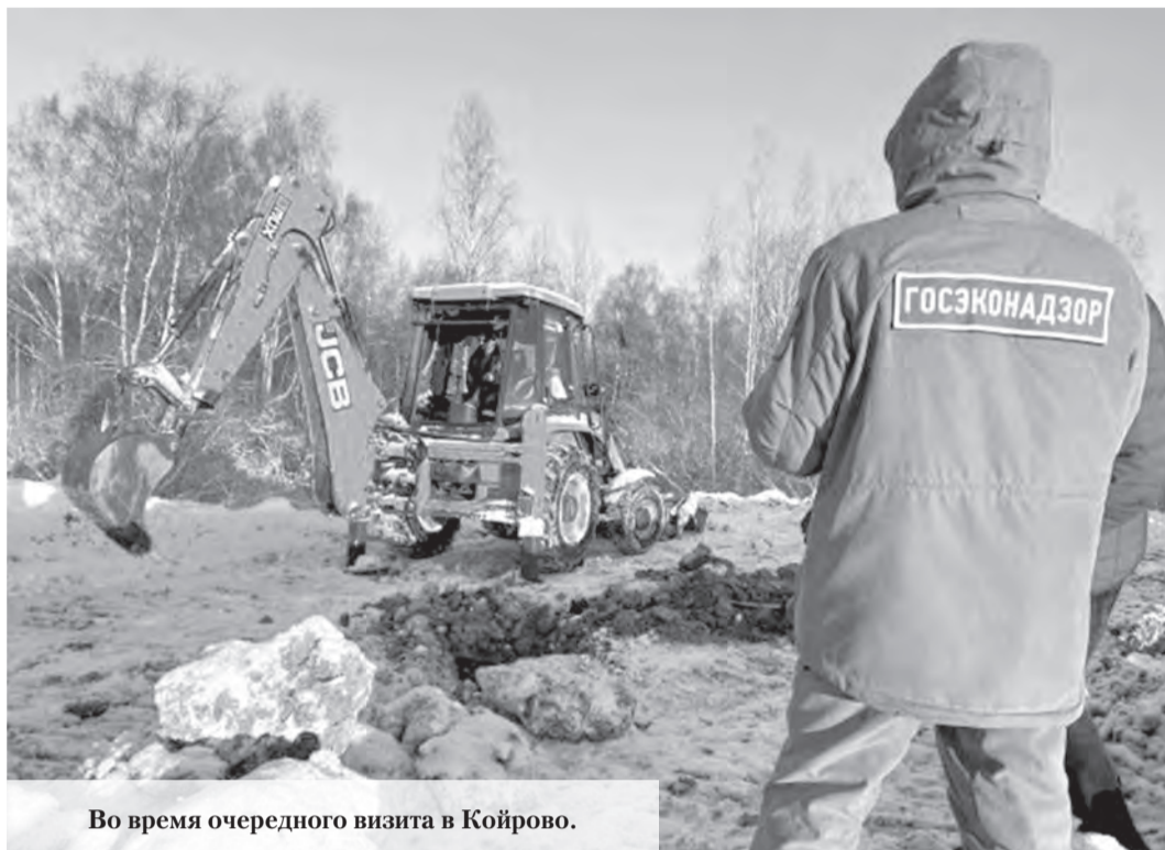
Во время очередного визита в Койрово.

Несанкционированная свалка в Ломоносовском районе Ленобласти угрожает безопасности полётов из расположенного неподалеку аэропорта Пулково.