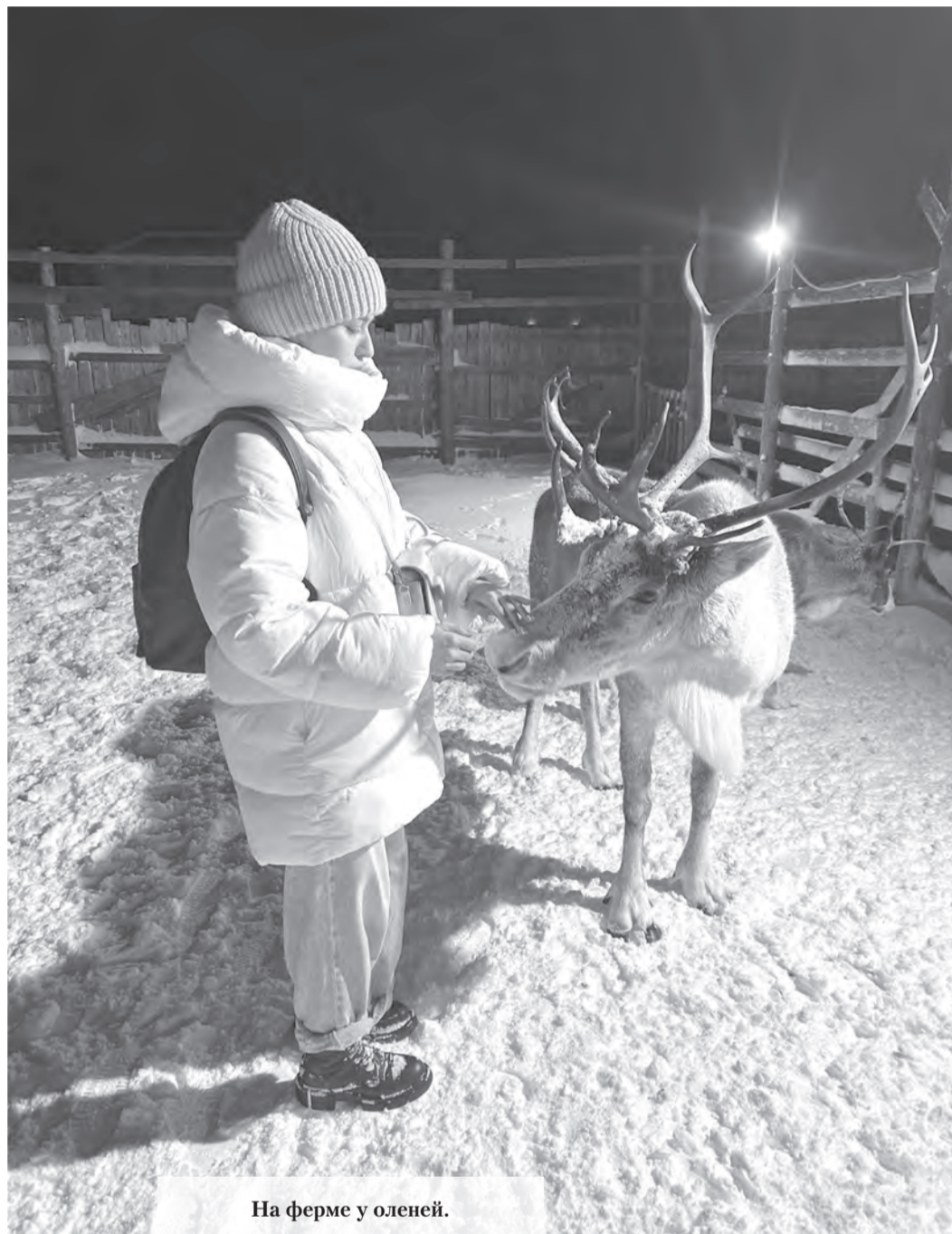
На ферме у оленей.

Териберка — небольшое село на северном побережье Кольского полуострова. В последние годы оно стало популярным местом для тех, кто стремится познакомиться с красотами и природой русского севера, увидеть китов и северное сияние.