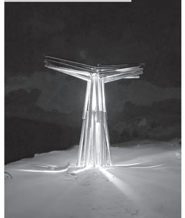
Арт-объект «Хвост кита».

В небольшом посёлке, утопающем в снежной тишине, мы смогли познакомиться с животными этого сурового края: с хаски и северными оленями. Посещение местной фермы подарило нам уникальную возможность установить связь с природой. Здесь, в окружении снежной белизны, хаски готовы поделиться своей энергией и жадной приключений. Каждая собака на ферме с настойчивостью и пылом в глазах мечтает унести гостей в захватывающее путешествие на собачьей упряжке. Ветер, обжигающий щеки, скорость и чувство полной свободы — все это