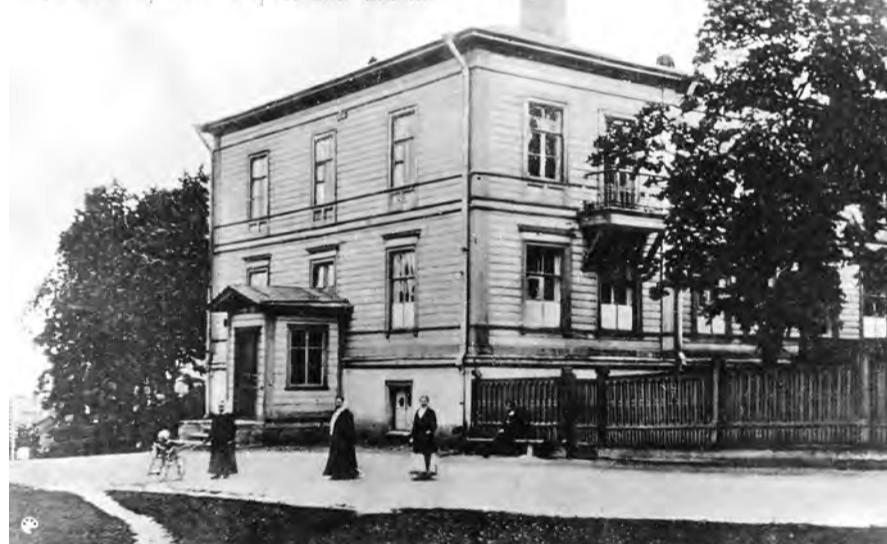
Ораниенбаумъ. Горькая школа

нию, участвовал во всех делах, касавшихся городского благоустройства». В Ораниенбауме присвоение звания «Почётного гражданина» происходило чаще всего лицам, вносившим пожертвования в городе не менее 10 лет. Это звание давало небольшие преимущества – в освобождении от подушной подати, рекрутских наборов и от телесных наказаний. Однако к концу XIX века с отменой крепостного права эти преимущества в основном исчезли. А звание «Почётный гражданин» сохранилось как исключительная форма выражения признательности и благодарности общества за деятельность на пользу города. Многие купцы, получившие это звание, очень им дорожили и обязательно указывали его в справочнике «Весь Петербург».