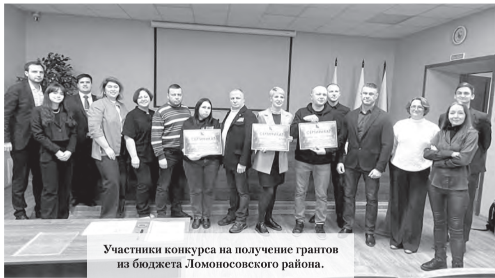
Участники конкурса на получение грантов из бюджета Ломоносовского района.

В Ломоносовском районе Ленобласти прошла защита социально значимых проектов некоммерческих организаций.