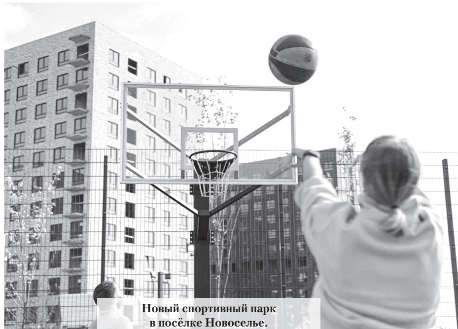
Новый спортивный парк в посёлке Новоселье.

В Ломоносовском районе Ленобласти открыли новый спортивный парк.