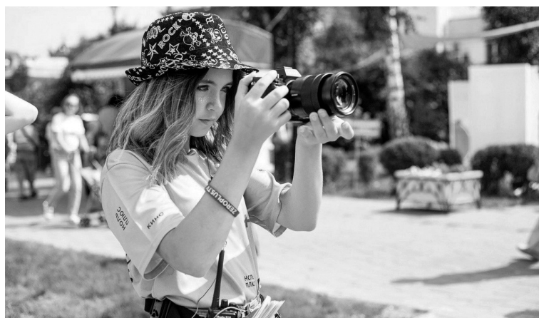
Юные ленинградцы снимают видеоролики о бережном отношении к природе