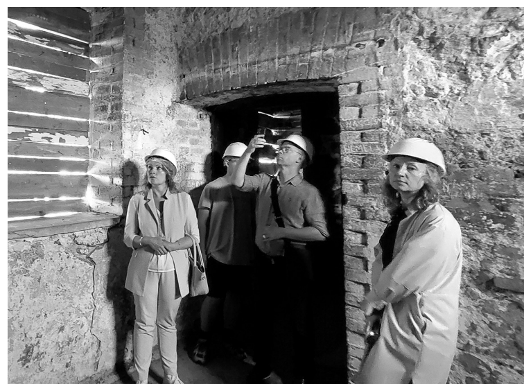
Ранее здесь никогда не проводились комплексные реставрационные работы