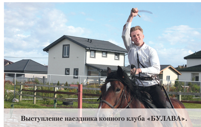
Выступление наездника конного клуба «БУЛАВА».

фестиваль «Сильны в единстве» развернулся в деревне Санино. Его открыли ребята из губернаторского молодёжного трудового отряда «Низино», выступив с номером под названием «МЫ». Концертная программа фестиваля включала в себя выступления воспитанников местной студии эстрадного вокала «Пой со мной». В