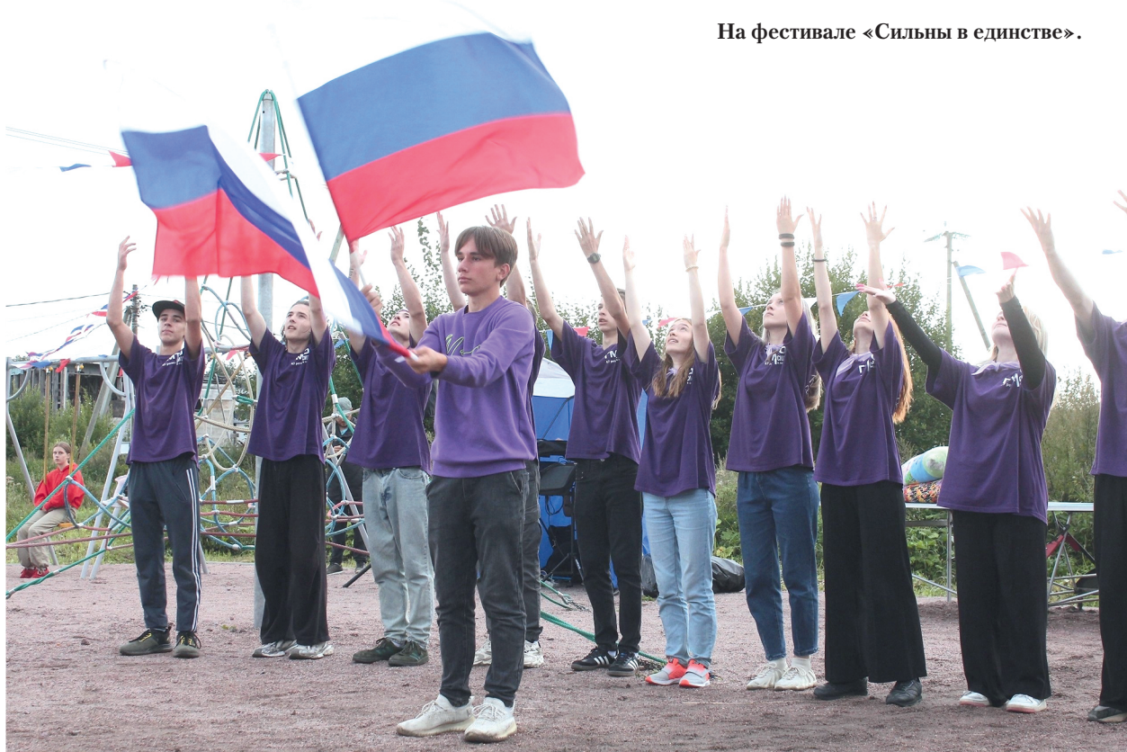
На фестивале «Сильны в единстве».

М.БОРИСОВА. Фото из открытых источников.