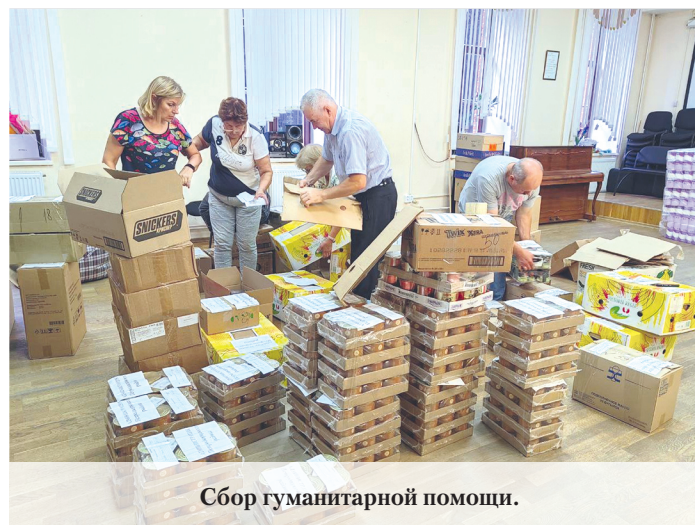
Сбор гуманитарной помощи.

равнодушные жители деревни Узигонты плетут маскировочные сети для бойцов, собирают гуманитарную помощь и подарки для них на праздники. На фестивале в Узигонтах работали фотозона и различные мастер-классы, можно было поучаствовать в спортивных соревнованиях по перетягиванию каната и поднятию гири. Особым успехом у детей пользовались разные игры, которые подготовили для них волонтеры мероприятия. Заключительным аккордом фестиваля в этой деревне стал флэшмоб губернаторского молодёжного трудового отряда «Низино» под песню Шамана. На следующий день патриотический