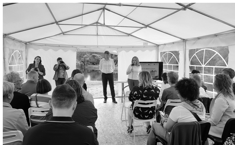
В музейном комплексе обсудили проект восстановления Форелевой башни

ЛЮДМИЛА КОНДРАШОВА ФОТО ПРЕДОСТАВЛЕНЫ МУЗЕЙНЫМ АГЕНТСТВОМ ЛЕНОБЛАСТИ.