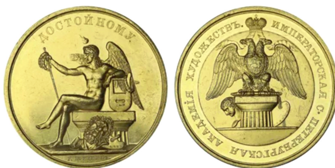
Большая золотая медаль (первого достоинства) императорской академии художеств.

В. ИГНАТЕНКО. Фото предоставлены автором.