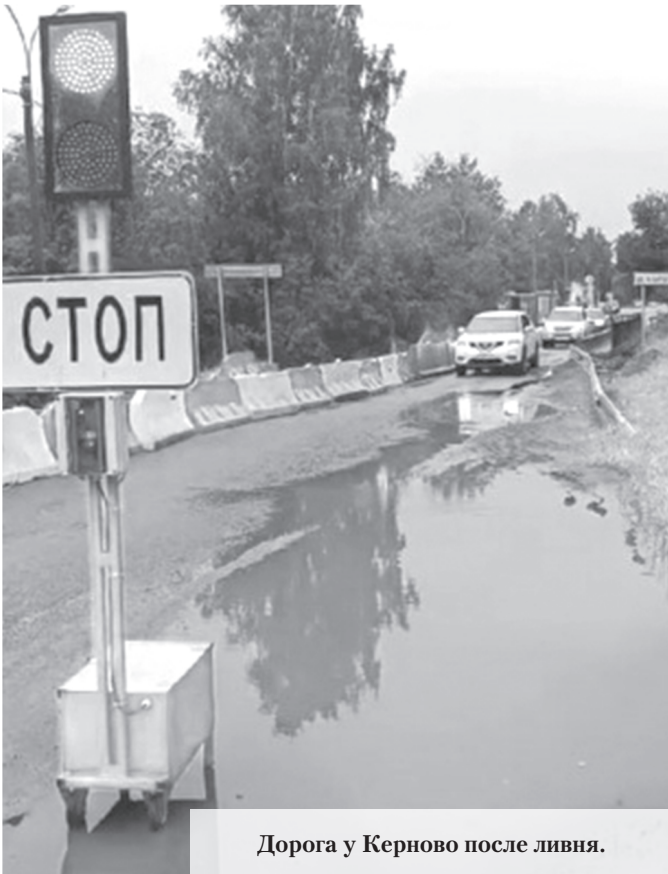
Дорога у Керново после ливня.