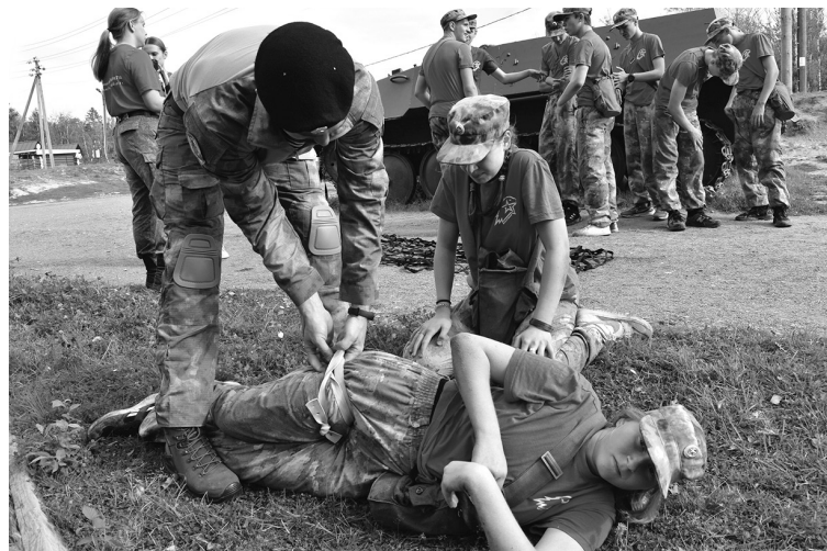
Занятия тактической медициной на «Тропе боевого братства»

среда формирования культурного человека.