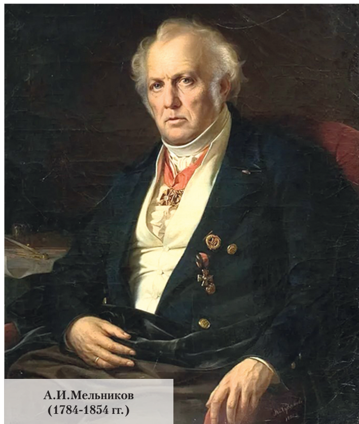
А.И.Мельников (1784-1854 гг.)

Материалы об известных людях, родившихся и живших в городе Ораниенбаум, ныне город Ломоносов Петродворцового района Санкт-Петербурга, хранятся в ломоносовском городском краеведческом музее. Сегодня его сотрудники делятся с читателями «Балтийского луча» интересной информацией о периодах жизни на ораниенбаумской земле известных художников, поэтов, литераторов, музыкантов и оружейников с мировой славой. В августе исполнилось 240 лет со дня рождения Авраама Ивановича Мельникова – русского архитектора, академика и ректора императорской академии художеств, который работал в стиле классицизма и который родился в Ораниенбауме 30 июля (10 августа по новому стилю) 1784 года.