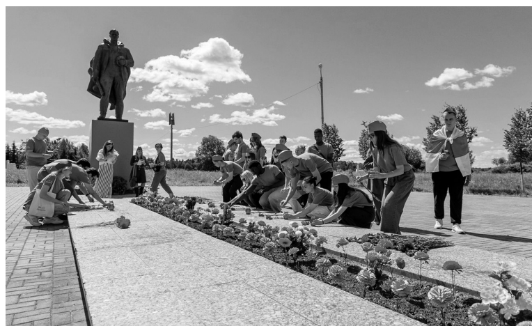
Молодёжь Ленинградской области принимает активное участие в патриотических акциях

БЕСЕДОВАЛА АНАСТАСИЯ КРУГЛОВА