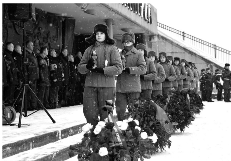
Участники церемонии почтили память павших в годы блокады минутой молчания

Мероприятие началось с концертного номера «Гранитный Ленинград» в исполнении музыкального альянса «Петербургские баритоны» с участием ансамбля танца «Фейерверк». Сразу после вокального номера и звуков Гимна Российской Федерации со словами поздравления к собравшимся обратился Губернатор Ленинградской области.