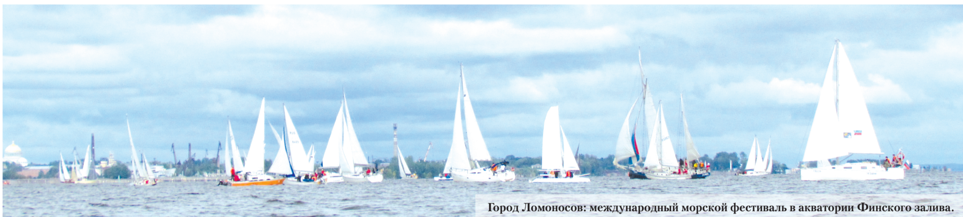
Город Ломоносов: международный морской фестиваль в акватории Финского залива.