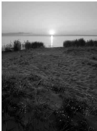
Выбья, Кингисеппский район

Мы же решили рассказать читателям «Ленинградской панорамы» о семи необычных экотропах в разных уголках Ленобласти, построенных за последние годы.