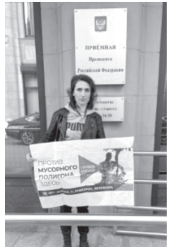
Жительница д.Оржицы в Москве. 2022 год.