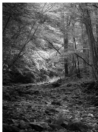
Рагуша, Бокситогорский район

Тропа расположена в государственном природном заказнике, который называется так же — «Раковые озёра». Три озера — Большое Раковое, Малое Раковое и Охотничье — неглубокие и хорошо прогреваемые, в их водах много органических веществ, а по периметру — большое количество тростника и других растений. Скорость образования болот здесь намного больше, чем в других экосистемах. Эти предпосылки создают отличную кормовую базу для различных водоплавающих и околоводных птиц, многие из которых занесены в Красные книги России и Ленинградской области. Для удобства маршрут «Раковые озёра» оборудован протяжёнными настилами, также есть смотровые вышки. Протяжённость тропы составляет около 8 километров.