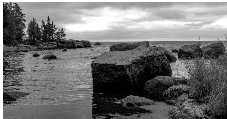
Каменистая тропа, Выборгский район

Общая протяжённость маршрута «Мыс Киперорт» составляет 19 километров. Тропа проложена по двум берегам Киперорта — самого крупного полуострова в Выборгском заливе. Маршрут проходит по западному каменистому берегу полуострова и восточному — песчаному. Здесь можно увидеть различные типы лесов, а также остатки фортификационных сооружений времён Второй мировой войны. О местных флоре и фауне можно узнать с помощью эколого-просветительских щитов, снабжённых картами. Для удобства посетителей обустроены парковочное пространство, туалеты и столбы дополнительной разметки.