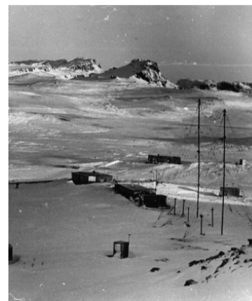
Станция «Беллинсгаузен» в Антарктиде