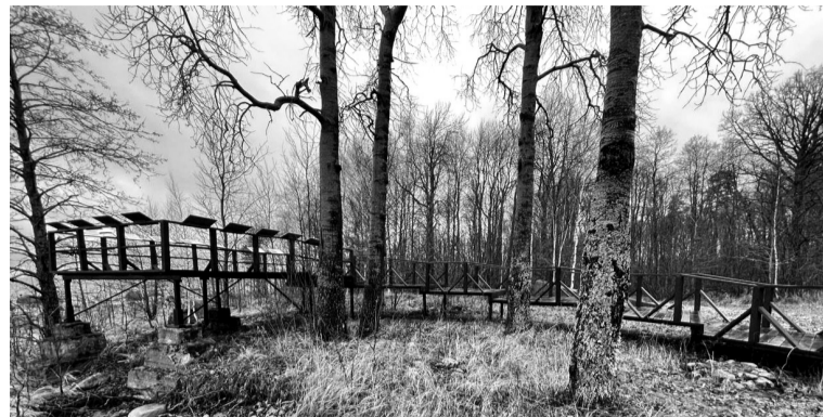
Мыс Кипперорт, Выборгский район

Почти треть тропы оборудована настилами и мости-