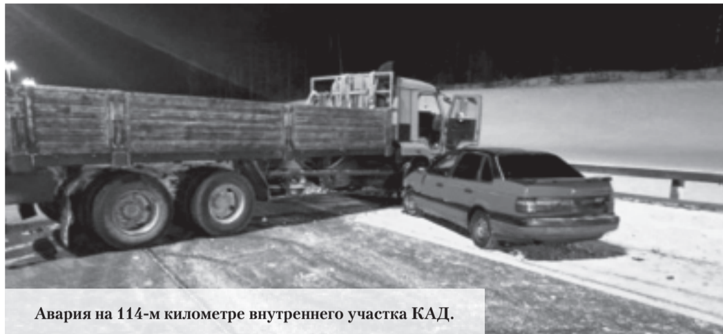
Авария на 114-м километре внутреннего участка КАД.

Как сообщает 20 января пресс-служба полицейского главка, накануне на 11-м километре Волхонского шоссе в Ломоносовском районе 64-летний водитель Volvo FH13 с полуприцепом наехал на 37-летнего пешехода. ДТП произошло вне зоны действия перехода, мужчина находился на проезжей части. От полученных травм пострадавший скончался на месте аварии. По факту ДТП проводится проверка, обстоятельства произошедшего уточняются. 19 января около восьми часов вечера на Гостилицком шоссе в дорожную аварию попала Lada. Как сообщает 47news со ссылкой на дорожную полицию, автомобиль улетел в кювет и приземлился на крышу. Водитель не пострадал. По информации регионального главка МЧС, дежурная смена 57-й пожарно-спасательной части отключила аккумулятор автомобиля, чтобы избежать возгорания. По предварительным данным 47news, днем 19 января произошло дорожно-транспортное происшествие в районе поселка Большая Ижора. Здесь столкнулись два грузовых автомобиля. Судя по видео, участники аварии сильно затруднили движение – водителям приходилось объезжать место происшествия. По данным сервиса «Яндекс-пробки», из-за аварии в направлении КАД образовалась пробка почти в три километра, в обратном – полтора километра. Двумя днями ра-