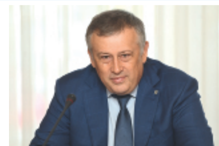
Уважаемые ветераны! Уважаемые ленинградцы!

Сегодня поистине всенародный праздник, который одинаково важен для петербуржцев, ленинградцев, для всех жителей нашей страны. Ровно 80 лет назад Ленинград был освобожден от фашистской блокады. Это общий подвиг тех, кто бился на ленинградских рубежах, кто внутри вражеского кольца стоял у станков, работал в госпиталях, тушил «зажигалки» на крышах. Каждый — от ребёнка до старика — внёс свою лепту в Ленинградскую Победу. Плата за эту Победу была чрезвычайно высока. Многие тысячи наших соотечественников пали в боях, стали невинными жертвами нацистских преступлений.