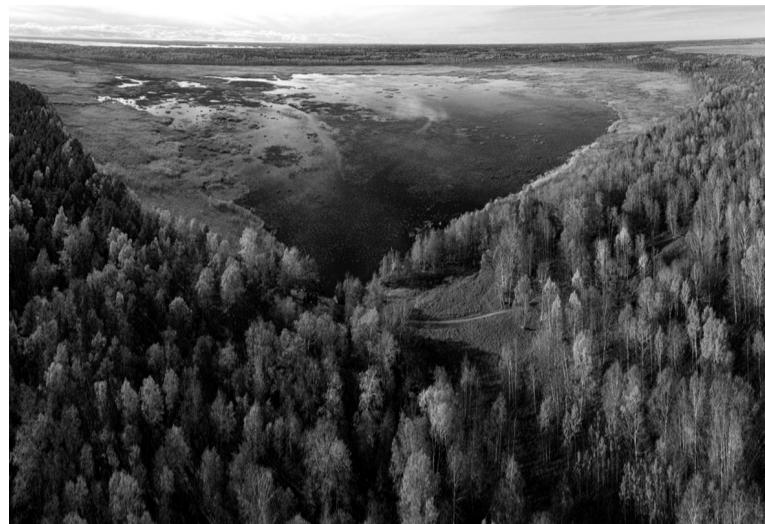
Раковые озёра, Выборгский район