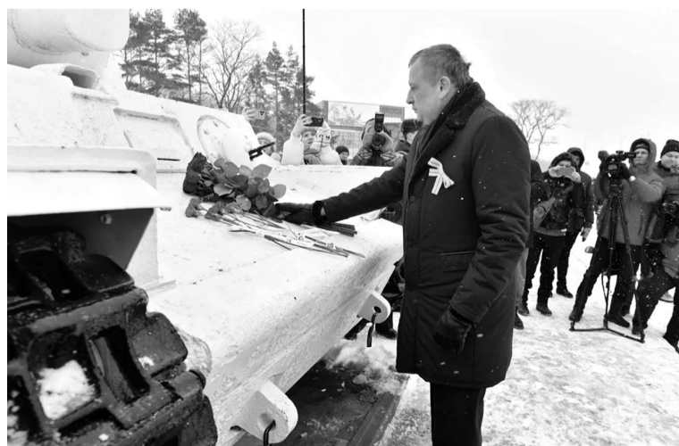
Александр Дрозденко возложил цветы к монументу «Белый танк»