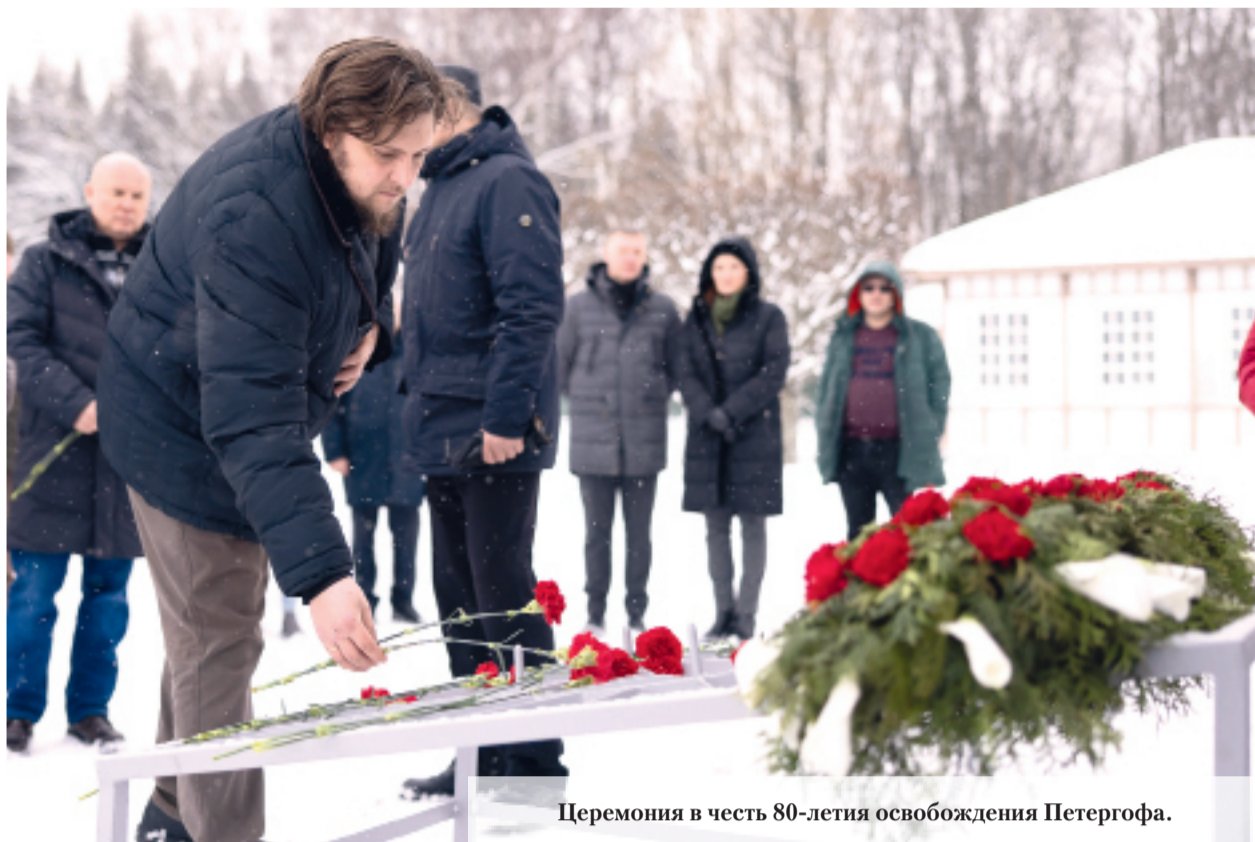
Церемония в честь 80-летия освобождения Петергофа.