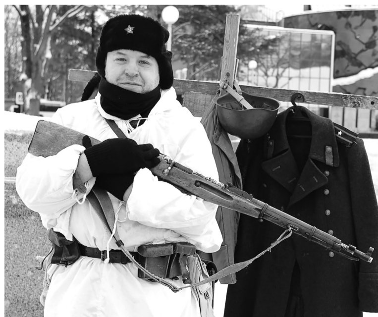
Гостей музея учили обращению с оружием времён Великой Отечественной войны