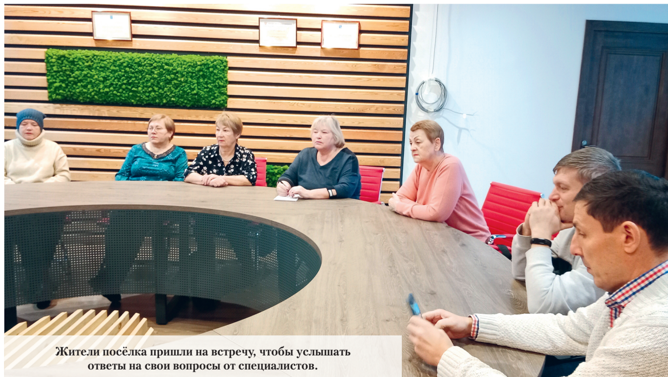
Жители посёлка пришли на встречу, чтобы услышать ответы на свои вопросы от специалистов.