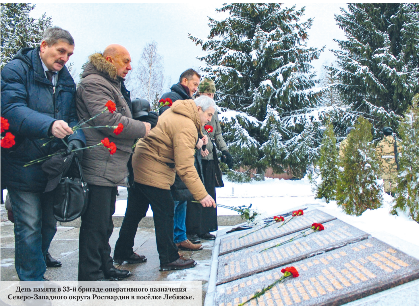
День памяти в 33-й бригаде оперативного назначения Северо-Западного округа Росгвардии в посёлке Лебяжье.

22 декабря 2023 года № 51 (16+) Газета Ломоносовского района, города Ломоносов Петродворцового района. Выходит с 19 апреля 1931 года. www.baltluch.ru