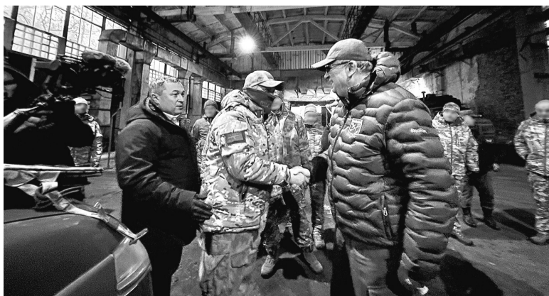
Ремонтный батальон получил необходимое оснащение от Ленинградской области