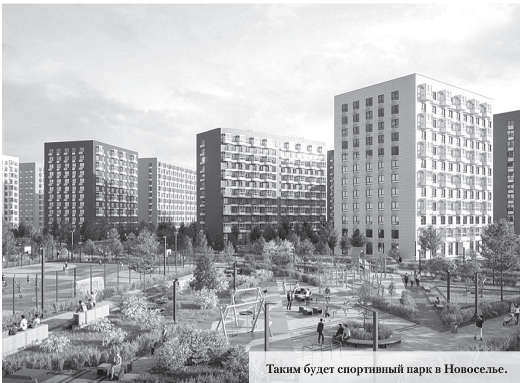
Таким будет спортивный парк в Новоселье.

Реализовать крупный проект спортивного благоустройства размером около шести тысяч квадратов планирует компания «ПИК». Об этом сообщили в пресс-службе стройкомитета Ленобласти. Здесь будут площадки для занятий мини-футболом, волейболом и баскетболом. Для зоны будет отведено более 1900 квадратов. Планируется использовать покрытие из резиновой крошки, за ограждением поля разместят трибуны для болельщиков. Проектом предусмотрено оборудование специальных зон для воркаута и разминки. Специалисты установят на этих площадках различные тренажёры и турникеты, а для любителей пинг-понга – уличные столы с сетками. В спортпарке любой желающий сможет сыграть партию в шахматы. Здесь также разобьют сенсорный