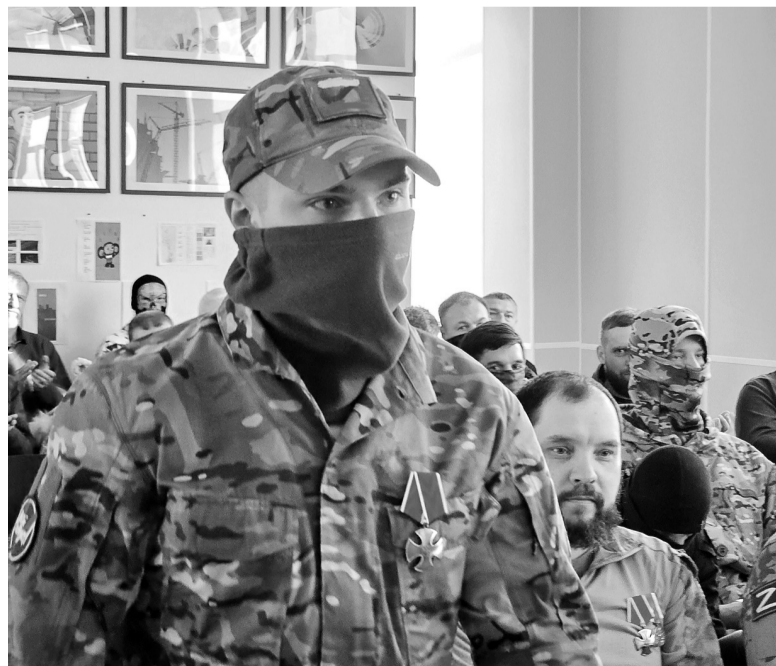
Ветераны-выпускники курсов обучения по специальности «Оператор БГЛА»