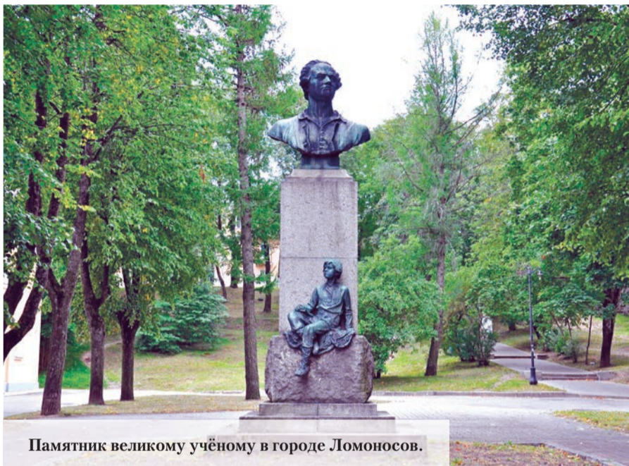
Памятник великому учёному в городе Ломоносов.

До новейших времён наличие домашней библиотеки являлось важным признаком человека интеллигентного. Книги личных библиотек отражали интересы их владельцев, в чём-то характеризовали семьи, где домашняя библиотека собиралась десятилетиями. После смерти М.В.Ломоносова, имя которого носит наш город, его библиотеку и рукописный архив разыскивали более двухсот лет.