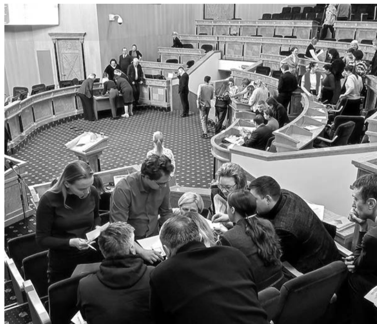
Участники семинара закрепили полученные знания в игровом формате

КСЕНИЯ БОНДАРЕНКО