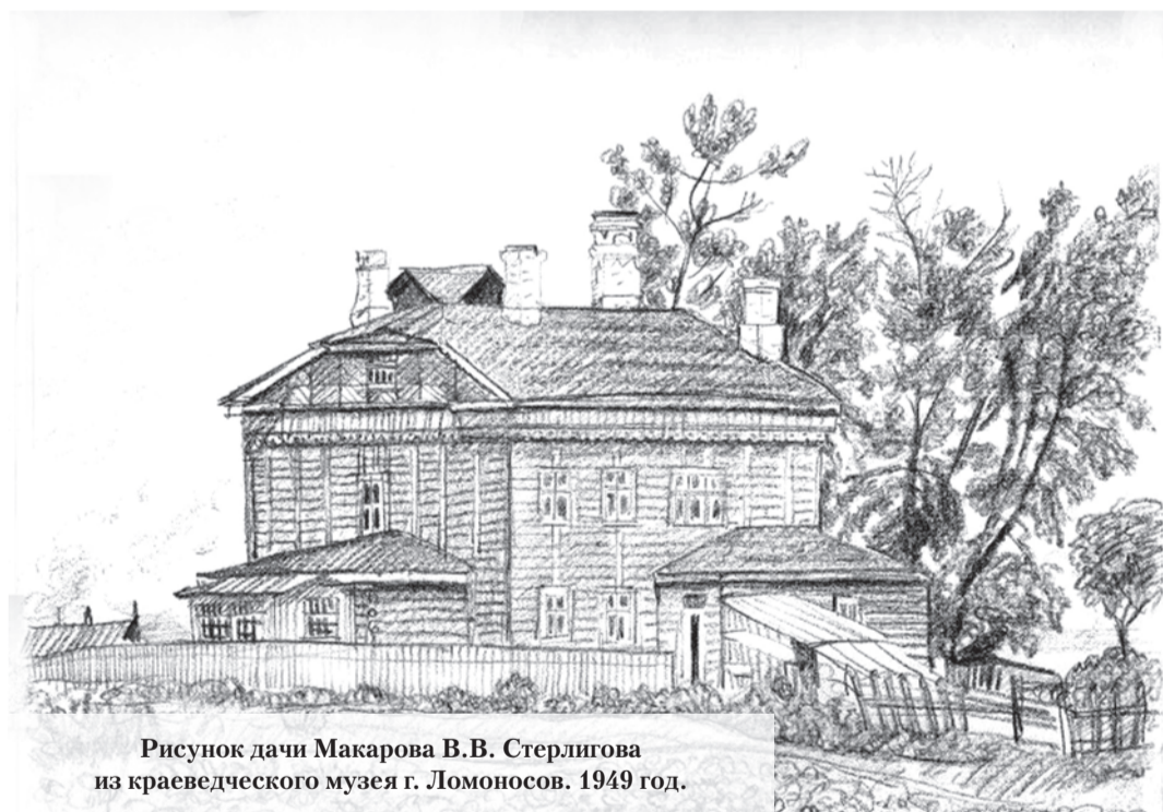
Рисунок дачи Макарова В.В. Стерлигова из краеведческого музея г. Ломоносов. 1949 год.

деле, датированном 1947 годом, в котором хранятся проведённые организацией Леноблпроект планы и обмеры «Домашних тов. Сталина». О степени разрушений здания хорошее представление дают пояснения к проведённому обмеру. По материалам ЦГА НТД СПб: «Здание двухэтажное с мезонином,