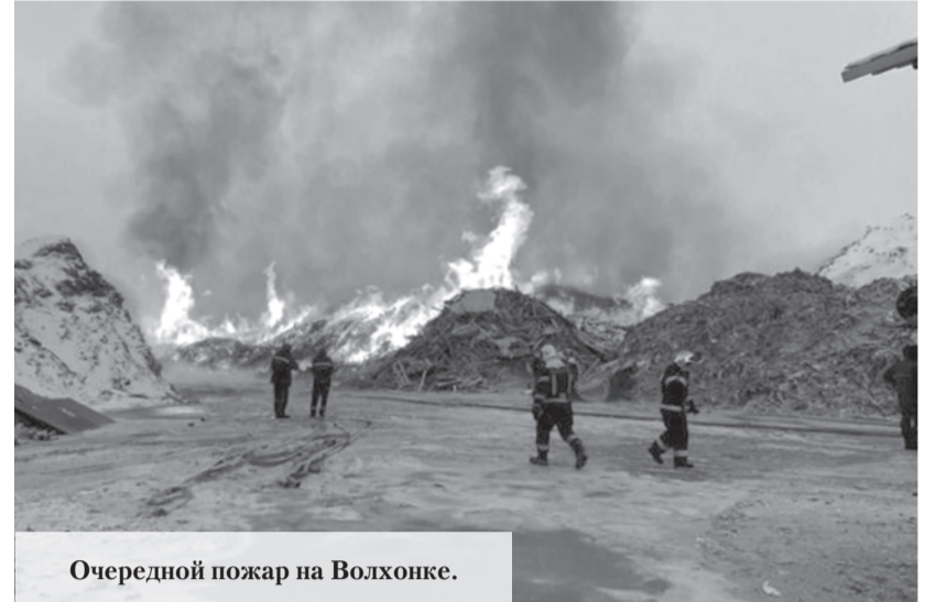
Очередной пожар на Волхонке.

Как сообщает 47news, в самом конце 2012 года – горели триста квадратных метров территории завода по переработке отходов. В 2013-м стартовала затяжная рекультивация горевшего террикона. С тех пор свалка напоминала о себе раз в три года то тлеющим мусором, то стеной чёрного дыма. С новой силой разгорелось осенью 2020 года. Тогда дымили и тлели петербургские заводы МПБО-2, в том числе и тот, что на Волхонском шоссе. Ещё через полгода горел склад щепок бывшего главы петербургского муниципалитета. В 2022-м снова полыхнул петербургский завод МПБО-2 – во время реконструкции корпуса искра попала на ленту конвейера. С этого года на Волхонском шоссе горит преимущественно древесина – кроме мусороперерабатывающего