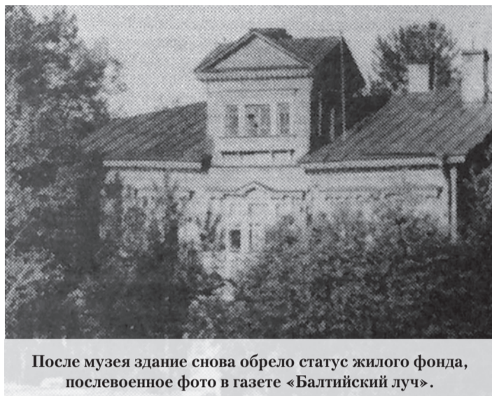
После музея здание снова обрело статус жилого фонда, послевоенное фото в газете «Балтийский луч».

Впоследствии встречаются сведения о том, что в середине 1920-х годов в помещении дачи Макарова был открыт агропромышленный пункт. Затем здание постепенно перекочевало в городской жилой фонд, к которому и относилось вплоть до конца 1930-х годов. Именно в этот момент открывается новая страница в истории здания на Пароходной улице, когда в память о событиях девятнадцатого года было принято решение организовать в нём музей обороны Петрограда, получивший в народе второе неофициальное название – дача (музей) Сталина. Соответствующее решение было принято президиумом Ленинградского облисполкома, выделившего на реставрацию дома 80 тысяч рублей. Предполагалось, что экспозиция музея будет состоять из нескольких разделов, посвящённых событиям обороны Петрограда. Главной же достопримечательностью должно было стать воссоздание комнаты штаба, связанной с именем И. В. Сталина, в которой проходило памятное совещание. С этой целью ленинградский филиал музея Ленина должен был предоставить ряд экспонатов. Первоначально ставилась задача открыть первые комнаты для посетителей в 1939 году, к двадцать второй годовщине Октябрьской революции, однако сроки пришлось сдвинуть. Острая необходимость расселения