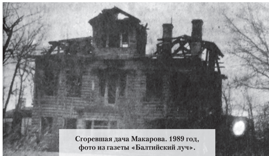
Сгоревшая дача Макарова. 1989 год.

рубленое из брёвен сложной формы. Фундаменты – ленточные из тёсаной бутовой плиты. Стены – рубленые из брёвен на западном и северном фасадах. Сохранилась обшивка из досок толщиной 2 см, балкон над тамбуром главного входа недостроен. Перекрытия – над подвалом бетонные по рельсам в хорошем состоянии, над первым этажом и чердачное по деревянным балкам – в удовлетворительном состоянии. Стропила – висячие