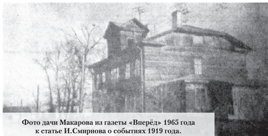
Фото дачи Макарова из газеты «Вперёд» 1965 года к статье И.Смирнова о событиях 1919 года.

А.АБАЛОВ. Фото из группы «Южный берег Финского залива» в ВК.