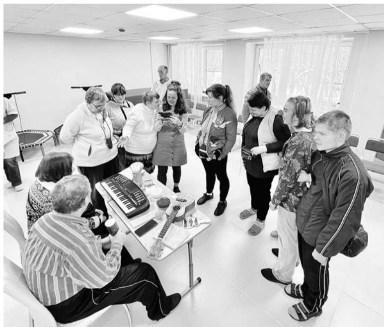
Кировский ПНИ проводит творческие мероприятия для получателей социальных услуг

Год назад стартовал образовательный проект «Область заботы 2.0: Профессиональное развитие Команды 47 в социосфере». Специальные курсы при поддержке правительства Ленинградской области и РАНХиГС прошли руководители и сотрудники государственных социальных учреждений. Параллельно с учёбой они на практике занимались внедрением социальных инноваций на местах. О том, что получилось, — рассказали на итоговом собрании проекта.