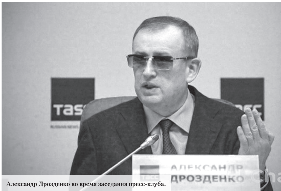
Александр Дрозденко во время заседания пресс-клуба.

Ломоносовский район рассматривается в качестве возможного места строительства новой судовой верфи. Об этом рассказал губернатор Ленинградской области Александр Дрозденко в ходе открытого заседания пресс-клуба, прошедшего в ТАСС.