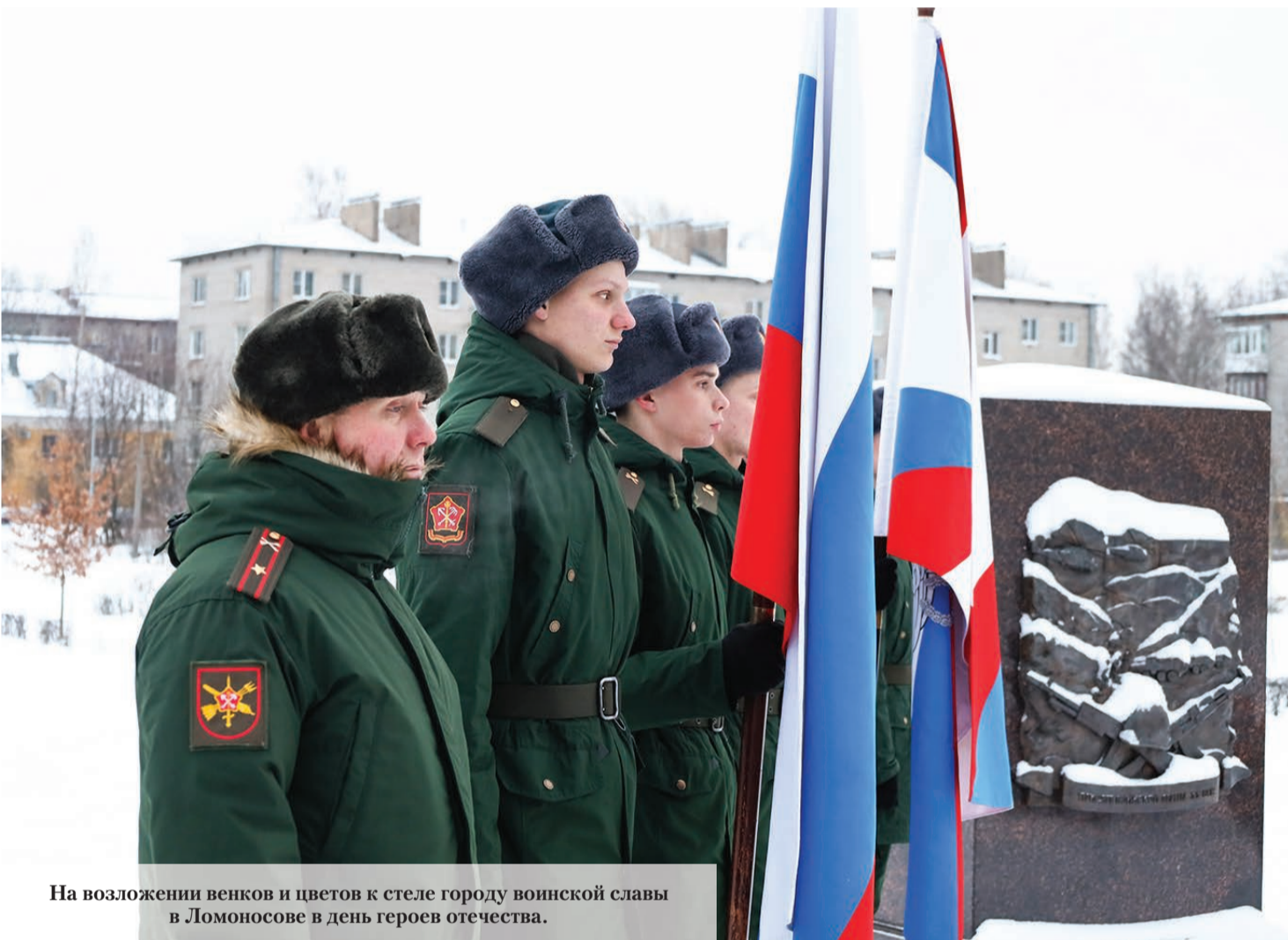
На возложении венков и цветов к стеле городу воинской славы в Ломоносове в день героев отечества.

15 декабря 2023 года № 50 (16+) Газета Ломоносовского района, города Ломоносов Петродворцового района. Выходит с 19 апреля 1931 года. www.baltluch.ru