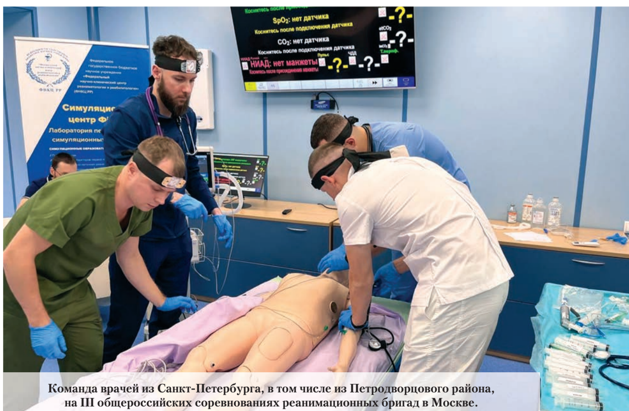
Команда врачей из Санкт-Петербурга, в том числе из Петродворцового района, на III общероссийских соревнованиях реанимационных бригад в Москве.