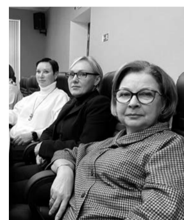
У заботы — женское лицо

— Спасают от выгорания и такие прекрасные образовательные программы. Для нас всех это отличная перенастройка сознания. Мы здесь перезнакомились, узнали новые практики. А самое главное, поняли — каждый руководитель решает одинаковые во-