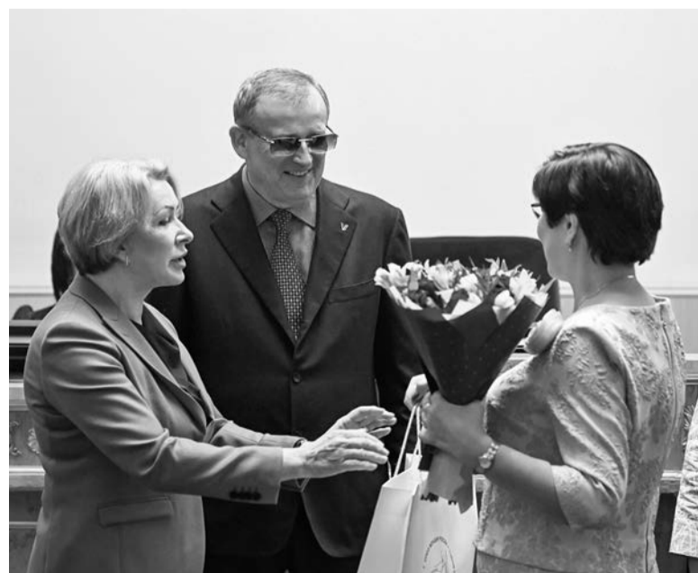
На форуме вручили награды выдающимся женщинам Ленобласти

АЛЕКСЕЙ АСТАПЧИК ФОТО: АЛЕКСЕЙ АСТАПЧИК, СОЮЗ ЖЕНЩИН ЛЕНИНГРАДСКОЙ ОБЛАСТИ