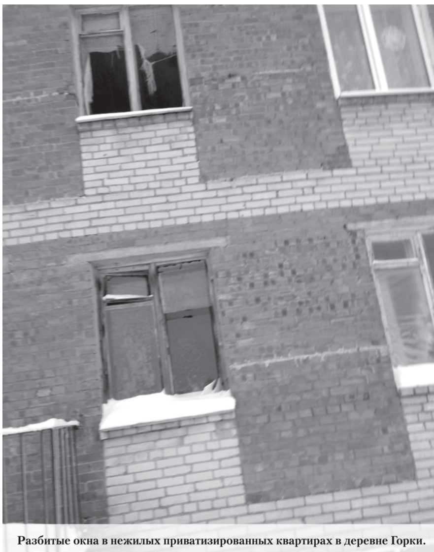
Разбитые окна в нежилых приватизированных квартирах в деревне Горки.