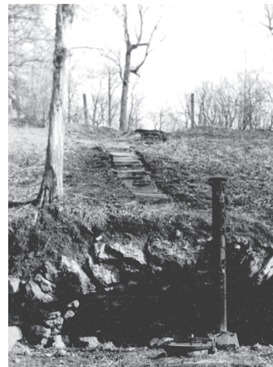
Малый грот. 1988 год.

цати рублей прогонов отказался, ссылаясь на то, что он, Рейндольф, не уполномочен своим хозяином, а хозяин разбит параличом и спросить он его не может. (подл. подпись) Уездный исправник. Декабря 7 дня 1903 года».