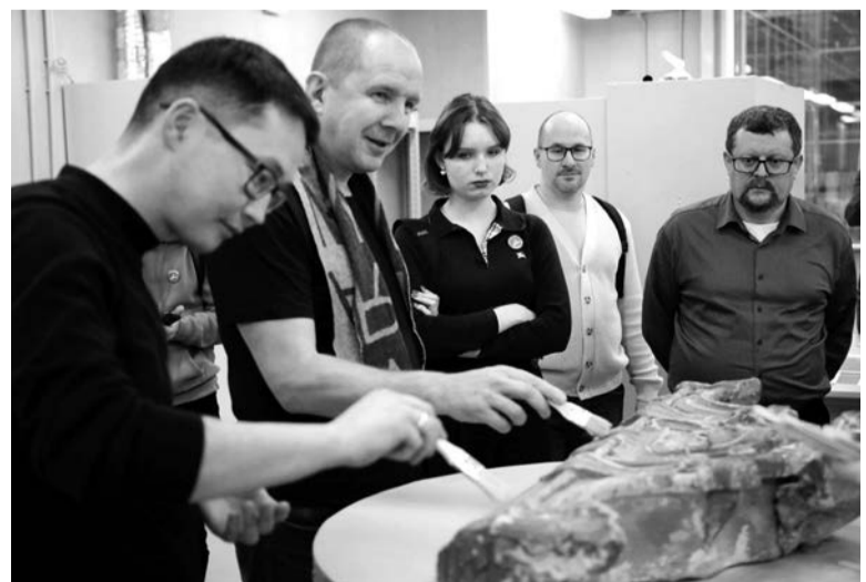
■ Участники форума посетили Международный центр реставрации в селе Рождествено

ПЕРЕЕХАЛО В 47-Й РЕГИОН БЛАГОДАРЯ ПРОГРАММЕ ДОБРОВОЛЬНОГО ПЕРЕСЕЛЕНИЯ С 2006 ГОДА