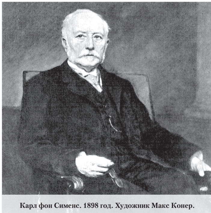
Карл фон Сименс. 1898 год. Художник Макс Конер.