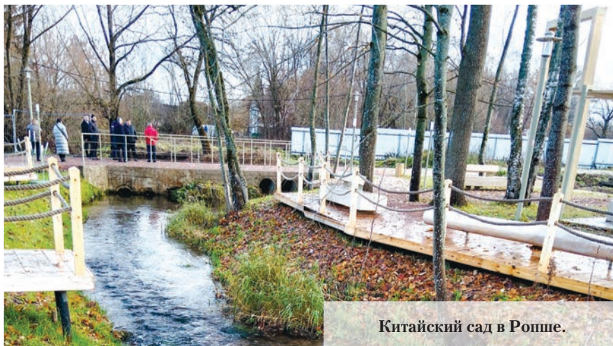
Китайский сад в Ропше.