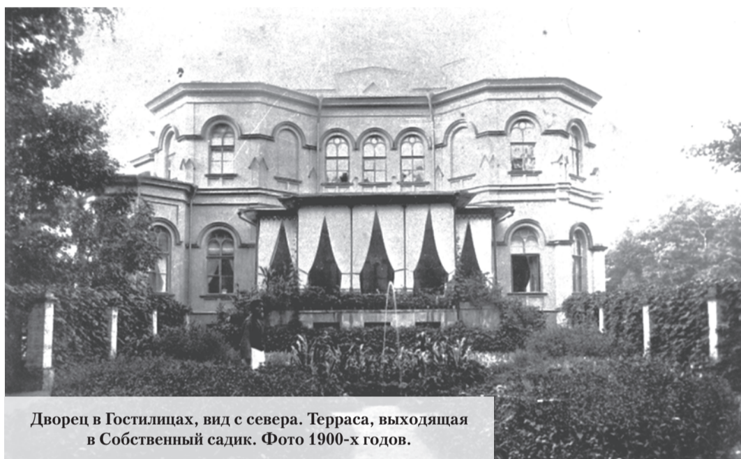
Дворец в Гостилицах, вид с севера. Терраса, выходящая в Собственный садик. Фото 1900-х годов.

Но принять непосредственное участие в строительстве ГЭС Карлу Фёдоровичу Сименсу не удалось. В октябре 1904 года у него, находившегося за границей, случился апоплексический удар, и Карл Фёдорович был частично парализован. Длительное лечение привело к некоторому улучшению. Но случившийся