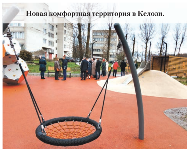
Новая комфортная территория в Келози.

Больше фотографий – на сайте газеты «Балтийский луч».