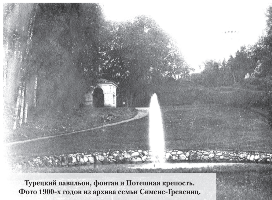
Турецкий павильон, фонтан и Потешная крепость. Фото 1900-х годов из архива семьи Сименс-Гревениц.

Фото из группы «Усадьба Гостилицы» в ВК. Окончание в следующем номере.