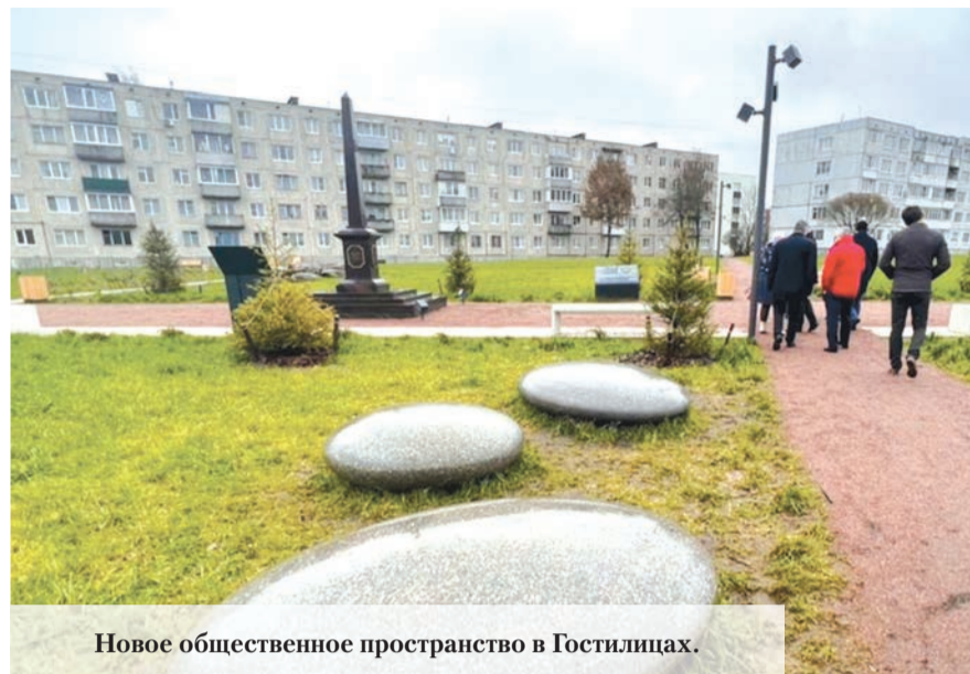
Новое общественное пространство в Гостилицах.

Помимо выше указанных объектов в 2023 году появились новые комфортные пространства в деревне Лаголово – за домом № 2 по улице Садовая. Стоимость объекта – 15000000 рублей, в деревне Пеники на улице Центральная, участок 20, стоимость работ – 12000000 рублей, здесь же дворовая территория на улице Центральная, 36а, на благоустройство которой потрачено 8000000 рублей. В стадии завершения находятся объекты в Аннинском поселении – на улице Центральная,