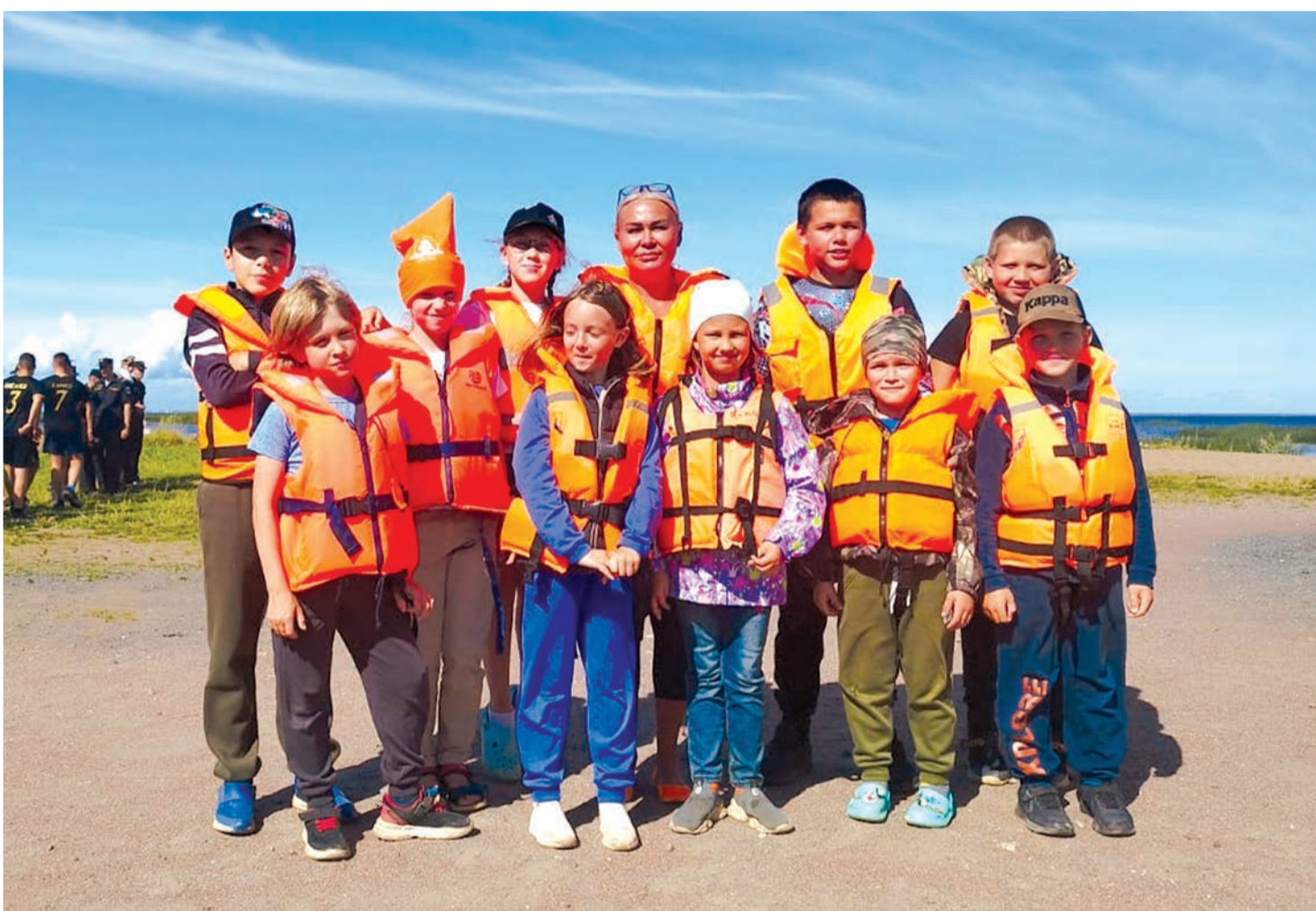
Практическое занятие воспитанников школы юнг «Под парусом» на берегу Финского залива в Ломоносове.

17 ноября 2023 года № 46 (16+) Газета Ломоносовского района, города Ломоносов Петродворцового района. Выходит с 19 апреля 1931 года. www.baltluch.ru