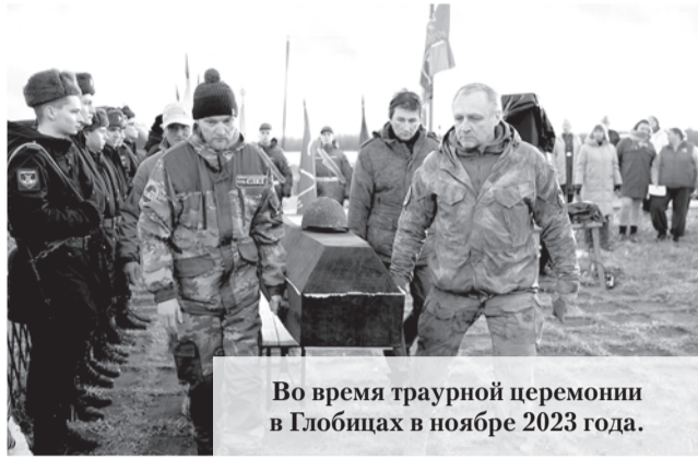
Во время траурной церемонии в Глобницах в ноябре 2023 года.

В Ломоносовском районе Ленобласти прошла церемония захоронения останков воинов, погибших в годы Великой Отечественной войны.