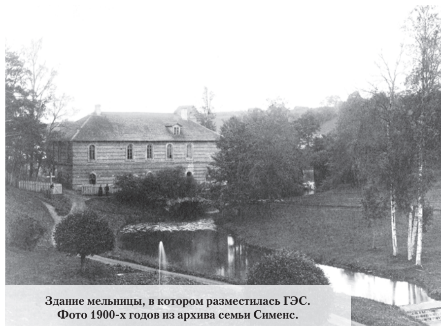
Здание мельницы, в котором разместилась ГЭС. Фото 1900-х годов из архива семьи Сименс.