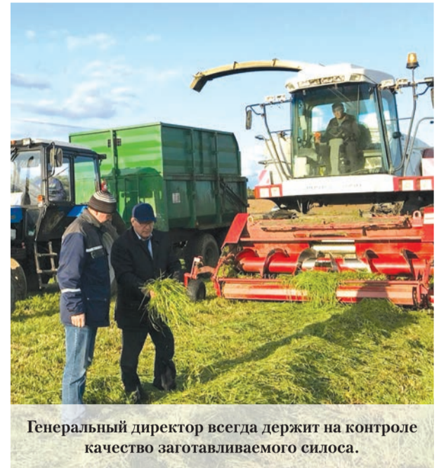
Генеральный директор всегда держит на контроле качество заготавливаемого силоса.

- Я не знаю, будет ли это ответом на вопрос, если я скажу, что на протяжении почти 20 лет предприятие «Красная Балтика» оказывало всякого рода помощь ветеранам Великой Отечественной войны, освобождавшим деревню Гостилицы. Они приезжали к нам на 9 мая, в день Победы,