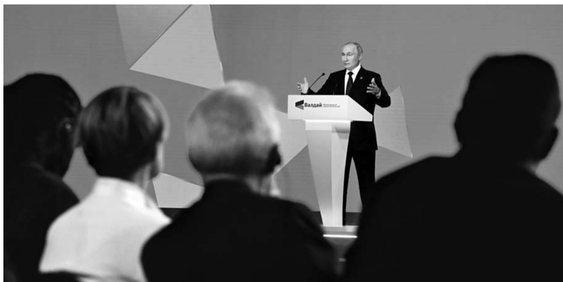
Владимир Путин на Валдайском форуме назвал суверенитет России признаком величия страны

Но и без телеэфира их пропаганде есть где развернуться. Сегодня возрастает роль электронных СМИ и социальных сетей. И уже сейчас мы видим на том же YouTube или в оппозиционных медиа русскоязычных профессионалов информационного цеха, которым не составит труда за несколько минут погру-