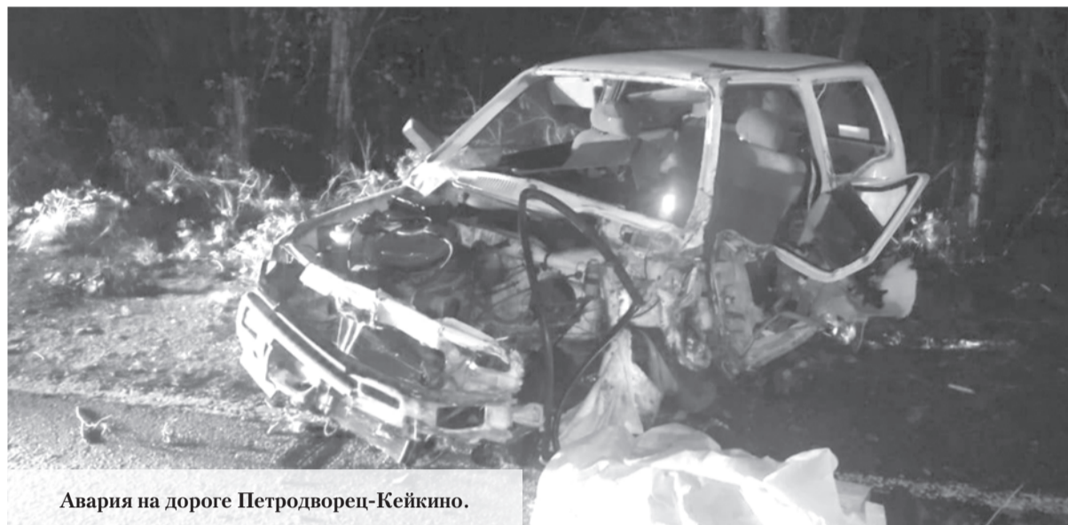
Авария на дороге Петродворец-Кейкино.