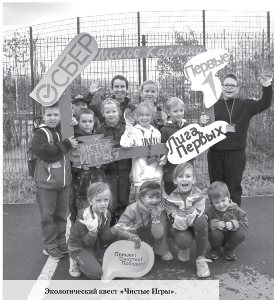
Экологический квест «Чистые Игры».

- 1 сентября у нас была организована передвижная выставка «Честь Мундира» историко-краеведческого музея Ломоносовского района. Она посвящена людям, которые проживали, воевали и работали на территории Ломо-