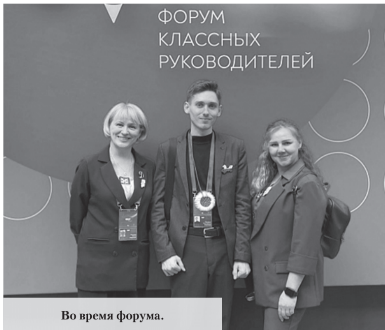
Во время форума.