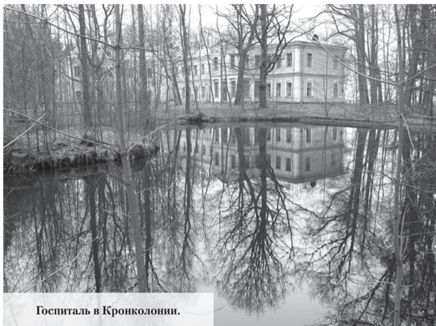
Госпиталь в Кронколони.