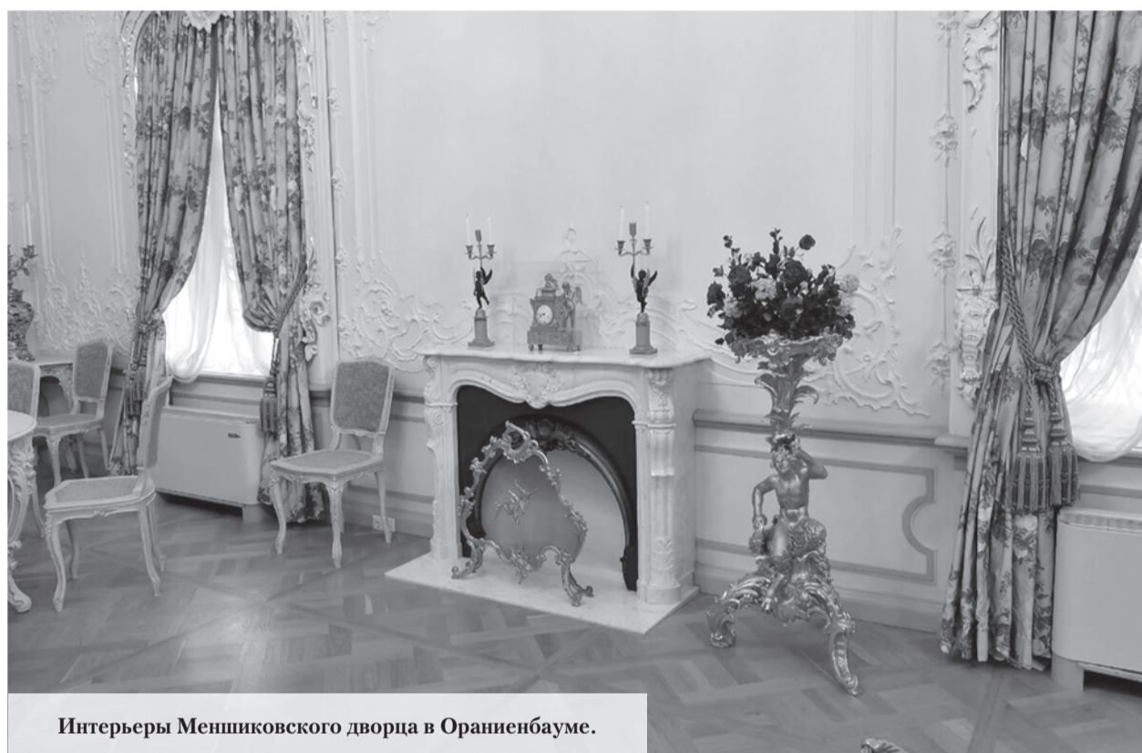
Интерьеры Меншиковского дворца в Ораниенбауме.