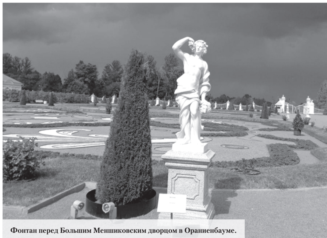
Фонтан перед Большим Меншиковским дворцом в Ораниенбауме.