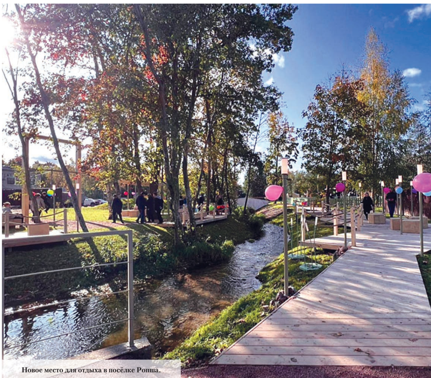
Новое место для отдыха в посёлке Ропша.

13 октября 2023 года № 41 (16+) Газета Ломоносовского района, города Ломоносов Петродворцового района. Выходит с 19 апреля 1931 года. www.baltluch.ru