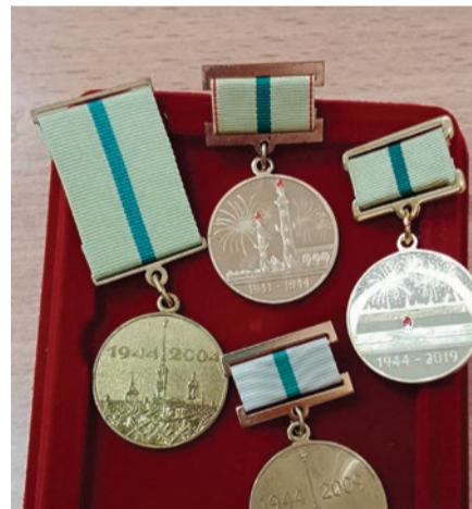
Памятные медали в связи с юбилейными датами полного освобождения Ленинграда от блокады.