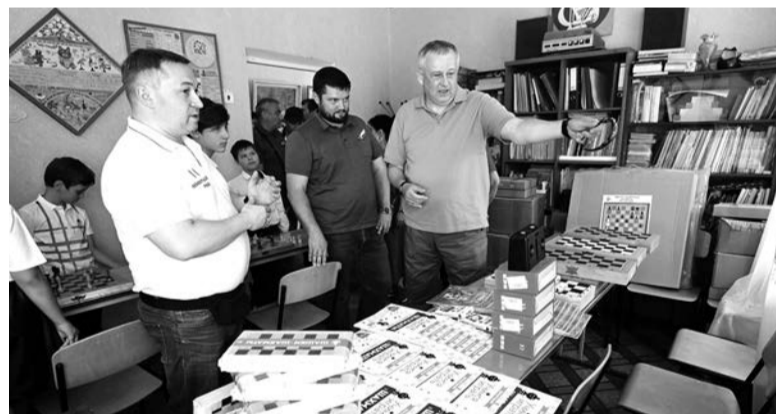
Ленинградская область обновляет книжный фонд в школах и библиотеках Енакиево

БЕСЕДОВАЛ АЛЕКСЕЙ АСТАПЧИК