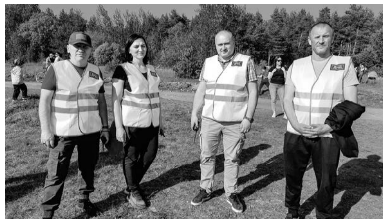
Дружинники из Приозерска помогают полиции на массовых мероприятиях

Благодаря главе администрации Приозерского района Александру Соклакову наши дружинники обеспечены удостоверениями установленного образца, форменной одеждой, помещениями, соответствующими санитарным нормам, средствами связи и оргтехникой. Совместно с муниципальными депутатами мы также прорабатываем вопрос об оказании комплексной помощи добровольным общественным организациям на будущее, включая меры финансовой поддержки.