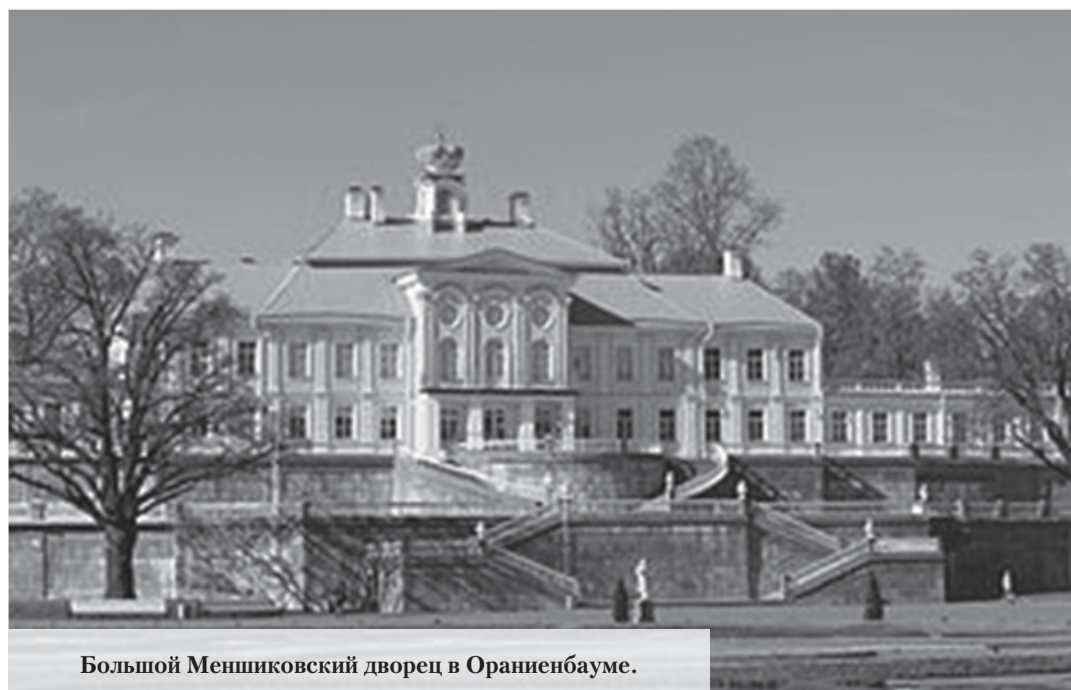
Большой Меншиковский дворец в Ораниенбауме.