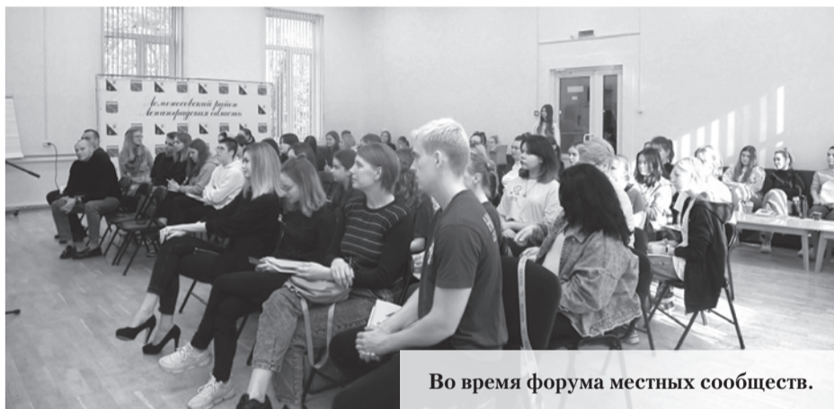
Во время форума местных сообществ.