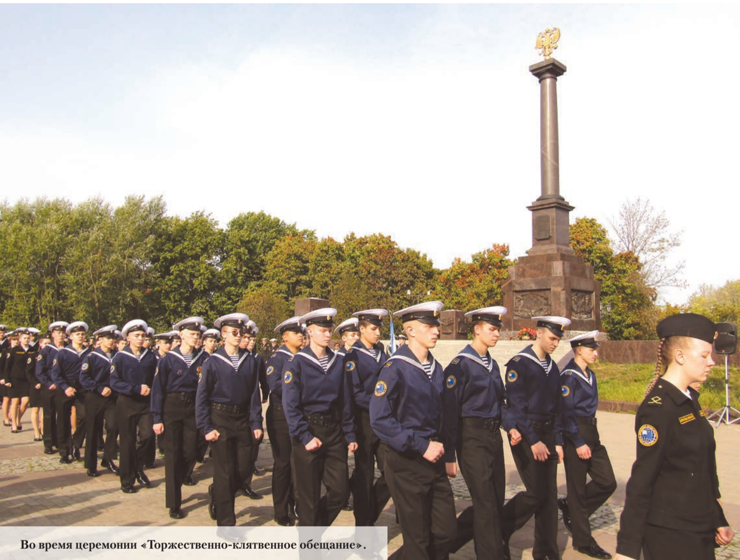
Во время церемонии «Торжественно-клятвенное обещание».

6 октября 2023 года № 40 (16+) Газета Ломоносовского района, города Ломоносов Петродворцового района. Выходит с 19 апреля 1931 года. www.baltluch.ru