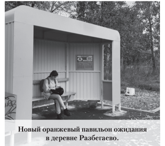
Новый оранжевый павильон ожидания в деревне Разбегаево.

пулярным. В 2008 маршрут был продлён до деревни Михайловка и переименован в к-639в, а спустя 11 месяцев после этого – до деревни Яльгелево. С 2015 года в летний период маршрут стали продлять до садоводства Синигейка. Закат маршрута пришёлся на пандемию, когда, во-первых, из-за ремонта Таллинского шоссе перестал выполняться заезд на улицу Стойкости. А во-вторых, упал пассажиропоток и перевозчик – ООО «Такси» – сократил выпуск до 4 машин, а через какое-то время и до двух. Конечно, специально ждать такой маршрут могли разве что обитатели Синигейки, и то, лишь в летний период, так как зимой машины следовали только до Яльгелево. Когда на маршрут вышла компания «Вест-Сервис», то ситуация ещё больше ухудшилась, на линии в основном работал только один автобус. А с 1 июля 2023 года маршрут и вовсе отменили, а на водителей маршрута №639а возложили обязанность пять раз в день заезжать в Синигейку. Несомненно, это ухудшение транспортного обслуживания, поскольку для такого магистрального маршрута заезд в Синигейку – полтора километра туда и обратно – нелогичен. Если судить по словам водителей, то им за этот крюк компания не платит. Поэтому они перестали с какого-то времени заезжать в Синигейку. Вот так постепенно от состояния более менее нормального транспортного обслуживания мы переходим до нулевого состояния транспортной доступности для некоторых населённых пунктов. И теперь зависит от нас – согласимся мы с таким положением дел или будем бороться за свои права.