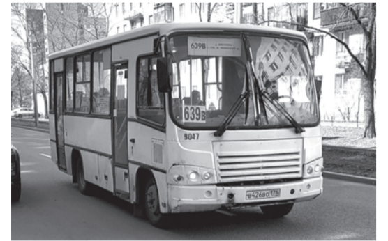
Маршрут 639В перестал существовать.

Недавно был отменён маршрут №639в «Станция метро Ленинский проспект Санкт-Петербург – деревня Яльгелево» с заездом в СНТ «Синигейка». Прежде чем рассказать, как теперь добираться до своего товарищества садоводы немолодого возраста с тележками и прочим неподъёмным инвентарём, немного вспомним историю маршрута. Маршрут №639в был открыт в начале мая 2003 года, трасса его проходила от станции метро Ленинский проспект до железнодорожной платформы в Красном Селе. «Фишкой» маршрута было то, что он проходил по улице Стойкости в Санкт-Петербурге, что при небольшом интервале сделало маршрут достаточно по-