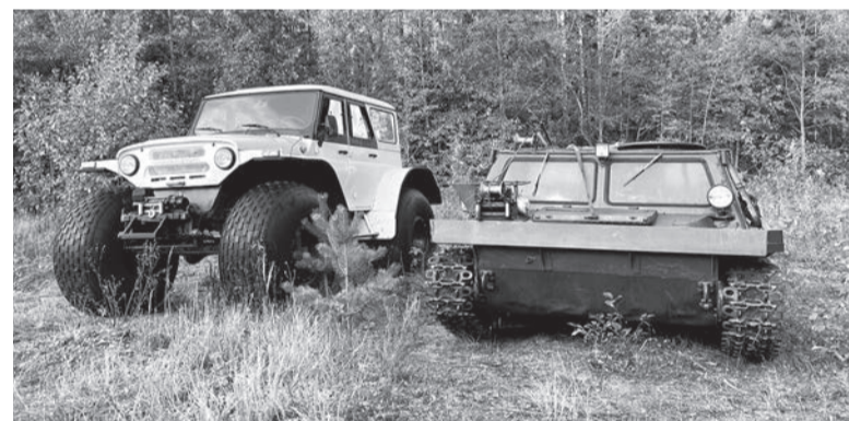
Современная техника позволила поднять самолёт в короткие сроки

При ударе о землю самолёт сильно пострадал. Бронелисты разорвало пополам, фюзеляж искорёжило. Тем удивительнее, что тела членов экипажа практически не были повреждены. Сохранилось обмундирование, документы. В кармане лётчика