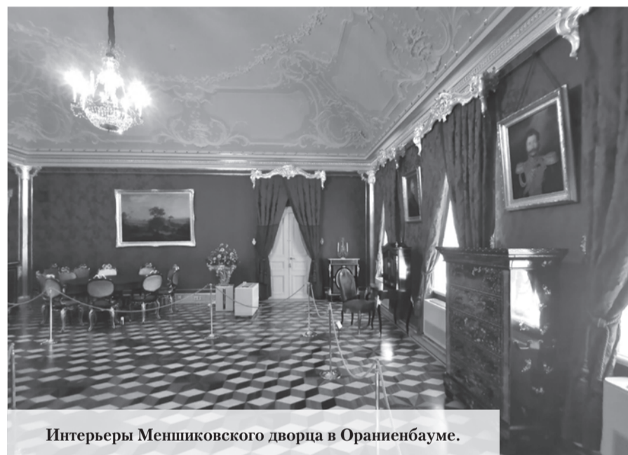
Интерьеры Меншиковского дворца в Ораниенбауме.

В 1717 году с западной стороны царского имения в Стрельне Меншиков выкроил для себя земельный участок под новую усадьбу, получив-