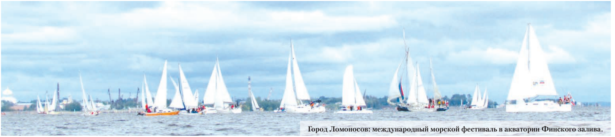
Город Ломоносов: международный морской фестиваль в акватории Финского залива.