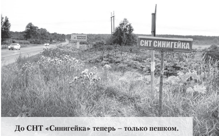
До СНТ «Синигейка» теперь – только пешком.