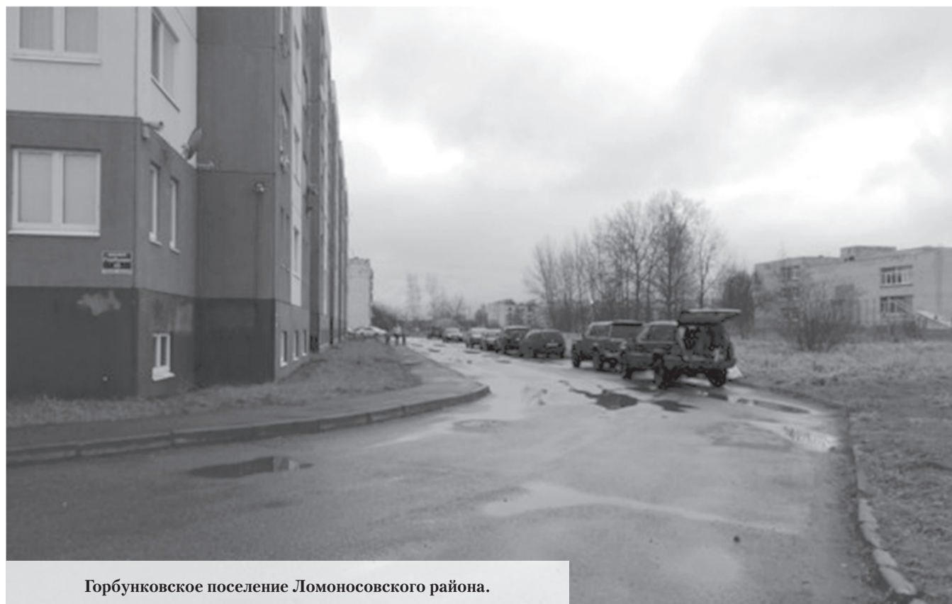
Горбунковское поселение Ломоносовского района.