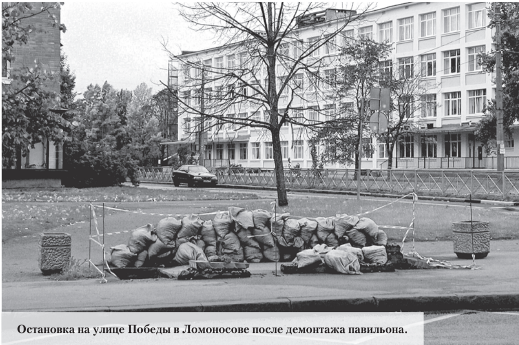
Остановка на улице Победы в Ломоносове после демонтажа павильона.

Вот ведь как бывает, когда ради чего-то нового и, как кажется, благого дела старое разрушается с такой безжалостностью до основания, что даже не знаешь, как к этому относиться. Неприятный осадок в душе остаётся надолго.