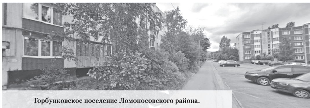
Горбунковское поселение Ломоносовского района.

Ни в коем случае не означает, – говорит председатель комитета по