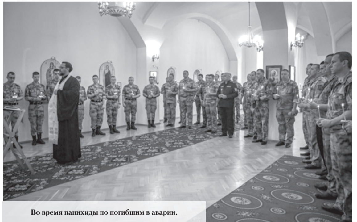
Во время панихиды по погибшим в аварии.