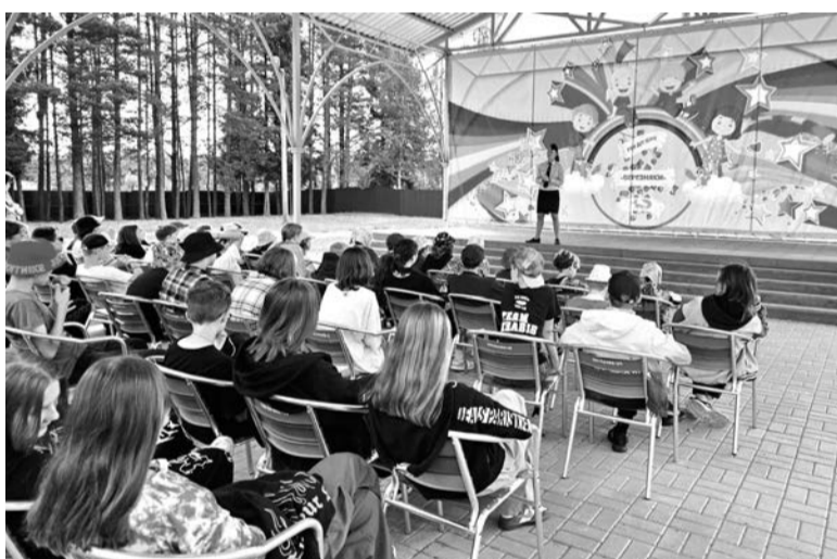
Госавтоинспекция активно работает с детьми во время летних каникул

БЕСЕДОВАЛ АЛЕКСЕЙ АСТАПЧИК