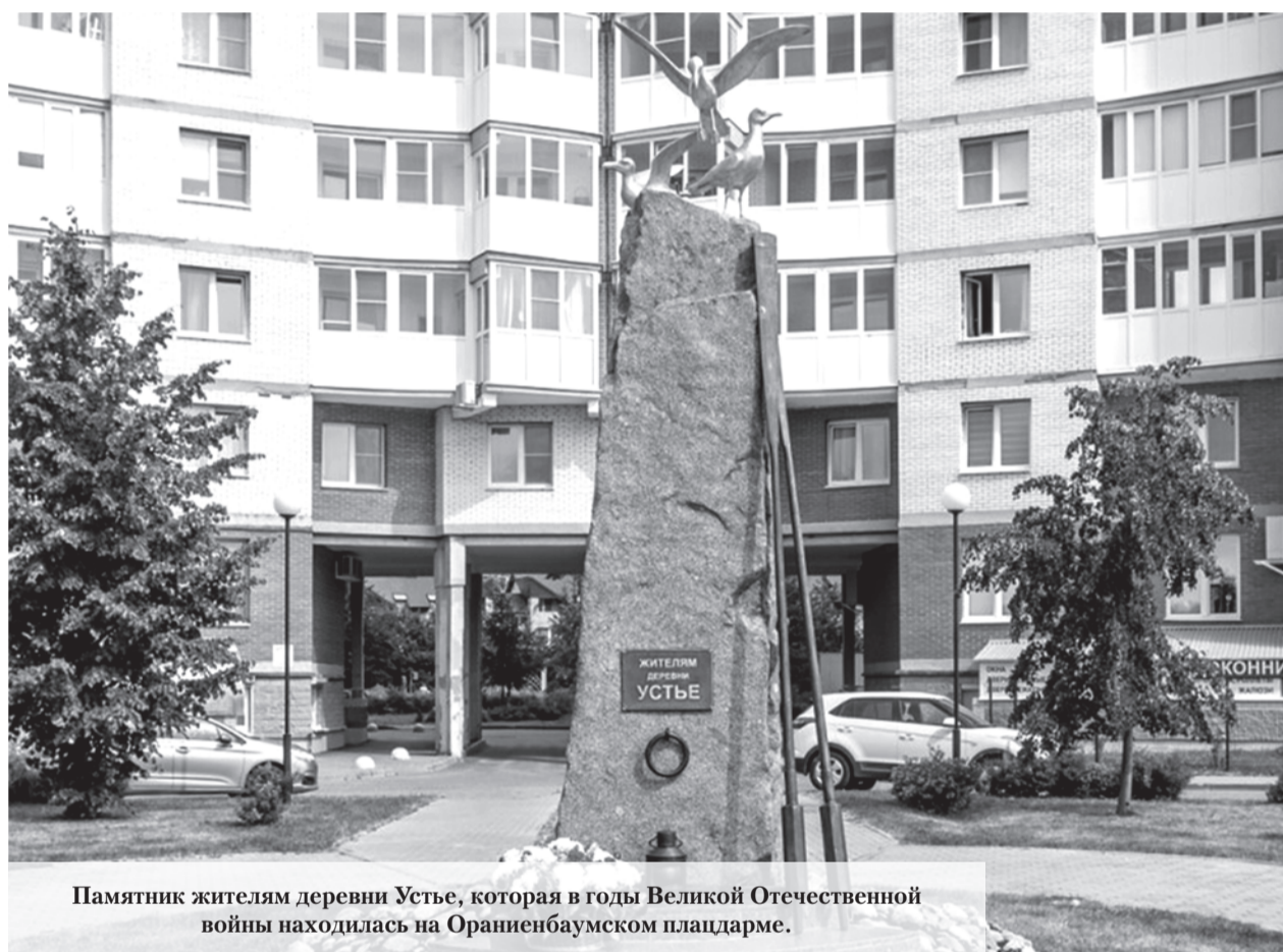
Памятник жителям деревни Устье, которая в годы Великой Отечественной войны находилась на Ораниенбаумском плацдарме.

было поначалу зимой. На лов выходили на санях. Любого человека на льду залива – отличная мишень. Маскхалатов гражданским не полагалось. В ход шли простыни, а ещё лучше – пододеяльники, которые просто распарывали по двум швам, чтобы оставался угол. Тут тебе и накидка, и капюшон. Такая нехитрая маскировка спасла жизни многим. Улов выбирали из сетей и фасовали, после чего сдавали военным и отправляли в блокадный Ленинград. Совсем немного рыбной мелочи рыбакам можно было взять себе: не более двух кило на семью, сколько бы человек в ней ни было. Рыбаки сами так решили на колхозном собрании. Но и эти два кило были спасением, потому что и в блокадном Ленинграде, и на Ораниенбаумском плацдарме катастрофически не хватало белковой пищи, что вызывало дистрофию и смерть. У тех, кто ловил рыбу на морозе и выбирал её из сетей, память об этом осталась до конца жизни: болели обмороженные руки. Труд рыбаков был тяжёлым,