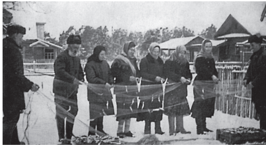
Рыбаки колхоза им.К.Маркса выбирают рыбу из сетей. 1942 год.