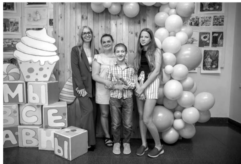
Особое внимание было уделено идеям по поддержке семей с детьми-инвалидами