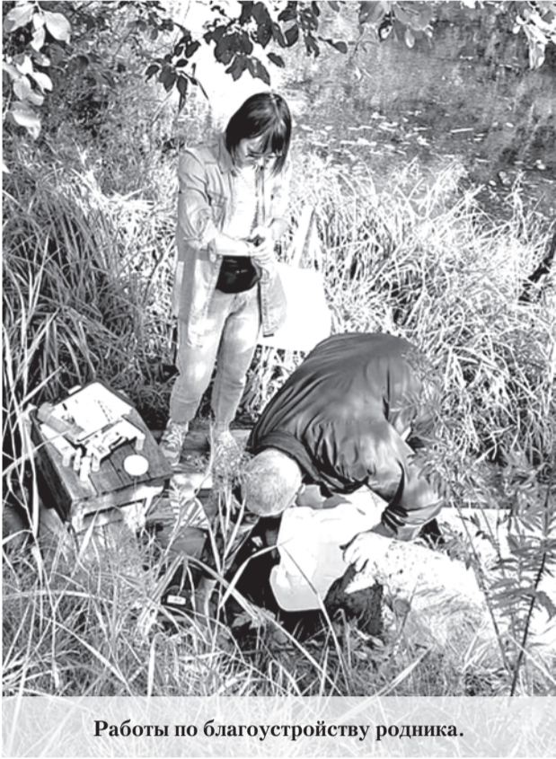
Работы по благоустройству родника.