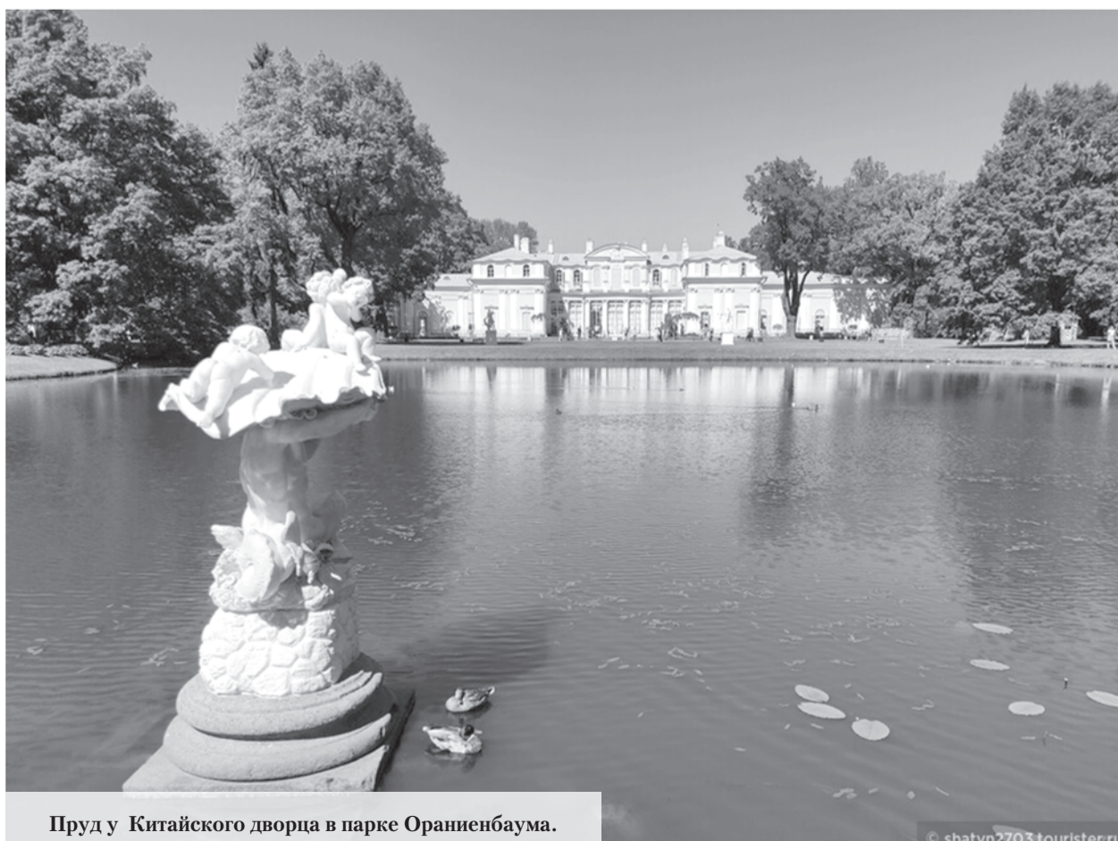
Пруд у Китайского дворца в парке Ораниенбаума.

Ольга БАРДЫШЕВА. Фото из открытых источников.