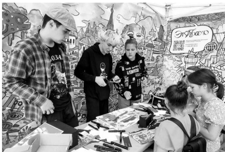
Участники молодёжного проекта «Это просто»