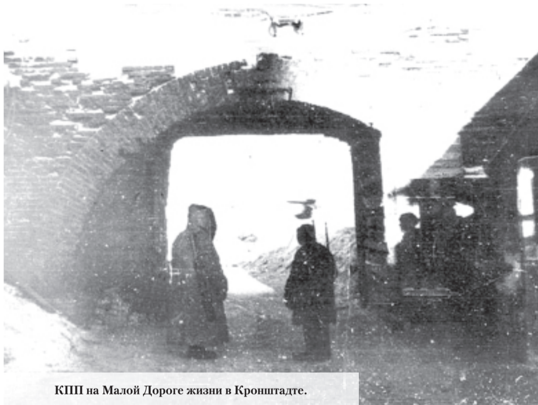
КПП на Малой Дороге жизни в Кронштадте.

Однако вода ещё выступала из-под льда у берега залива. «Поэтому машины шли друг