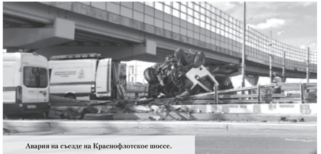
Авария на съезде на Краснофлотское шоссе.