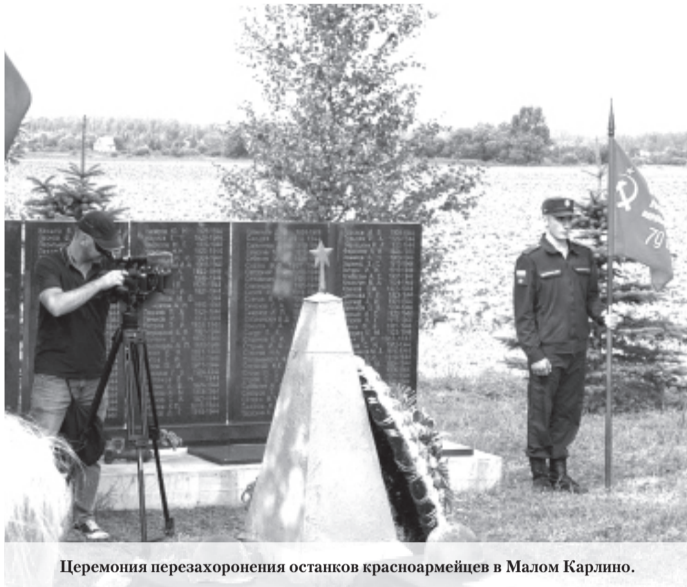
Церемония перезахоронения останков красноармейцев в Малом Карлино.

В Ломоносовском районе Ленобласти перезахоронили останки восемнадцати красноармейцев.