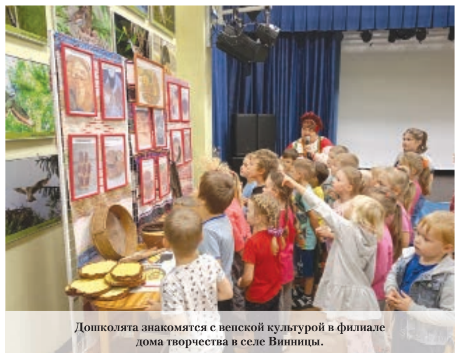
Дошколята знакомятся с вепской культурой в филиале дома творчества в селе Винницы.

Заявки и конкурсные работы, посвящённые этнокультурному достоянию финно-угорских и самодийских народов, принимаются до 31 октября по номинациям: живопись (акварель, гуашь); графика (карандаш, мягкие материалы, масляная пастель, тушь и перо); декоративно-прикладное творчество (бисероплетение, батик, вышивка, вязание, лепка, работа с деревом, ткачество); социальная реклама (короткие видеоролики, плакаты, посвящённые традициям и обычаям народов России, популяризации родного языка, народного костюма, традиционной кухни); мультимедийное творчество (видеокамп, видеосюжет, видеofilm, мультфильм и т.п.). В этом году учреждена спецноминация «Наставник». К ней относятся работы, созданные в любом виде изобразительного искусства совместно педагогом и учащимся, а также раскрывающие тему преемственности и передачи знаний. Презентация международной выставки запланирована на декабрь 2023 года.