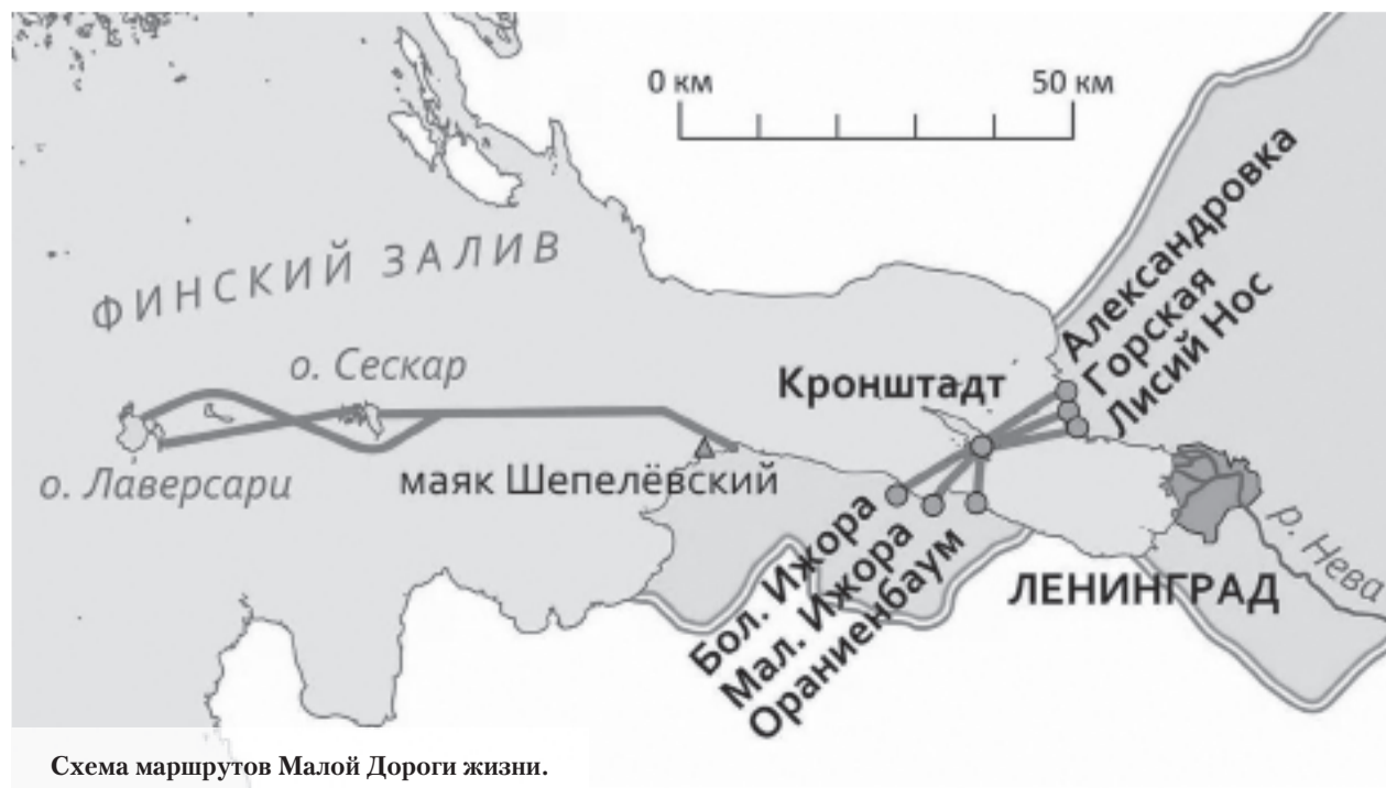
Схема маршрутов Малой Дороги жизни.