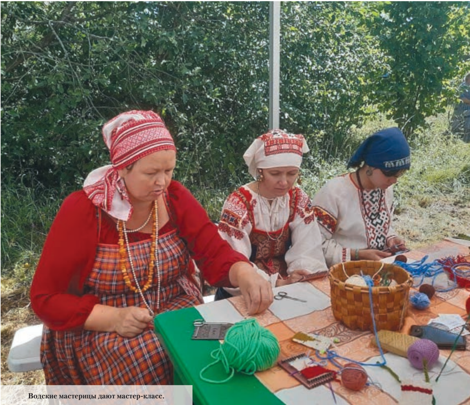
Водские мастерицы дают мастер-класс.