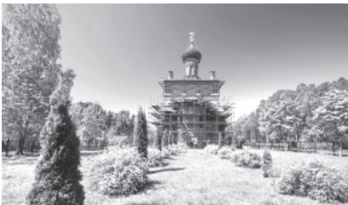
Реставрация внутри Троицкого собора в Гора-Валдае.