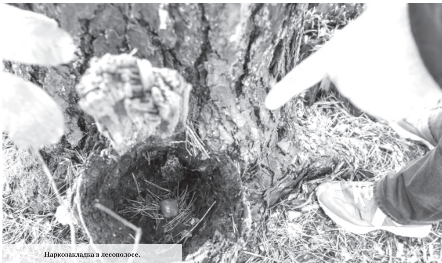
Наркозакладка в лесополосе.

«Лёгкий заработок в интернете» – такой рекламой сейчас пестрят странички в соцсетях и разные сайты. Чем может обернуться такая работа, как преступники заманивают людей в наркобизнес, как подростки и молодёжь становятся закладчиками наркотиков, почему не могут уйти из преступного бизнеса, и как быстро их вычисляют и задерживают правоохранители? Об этом наш сегодняшний разговор в рамках проекта «Территория жизни».