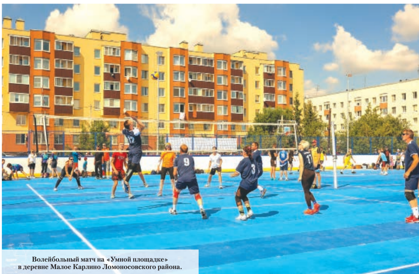
Волейбольный матч на «Умной площадке» в деревне Малое Карлино Ломоносовского района.

Физкультурно-оздоровительный комплекс открытого типа «Умная площадка» появился в деревне Малое Карлино Виллозского городского поселения Ломоносовского района Ленинградской области.