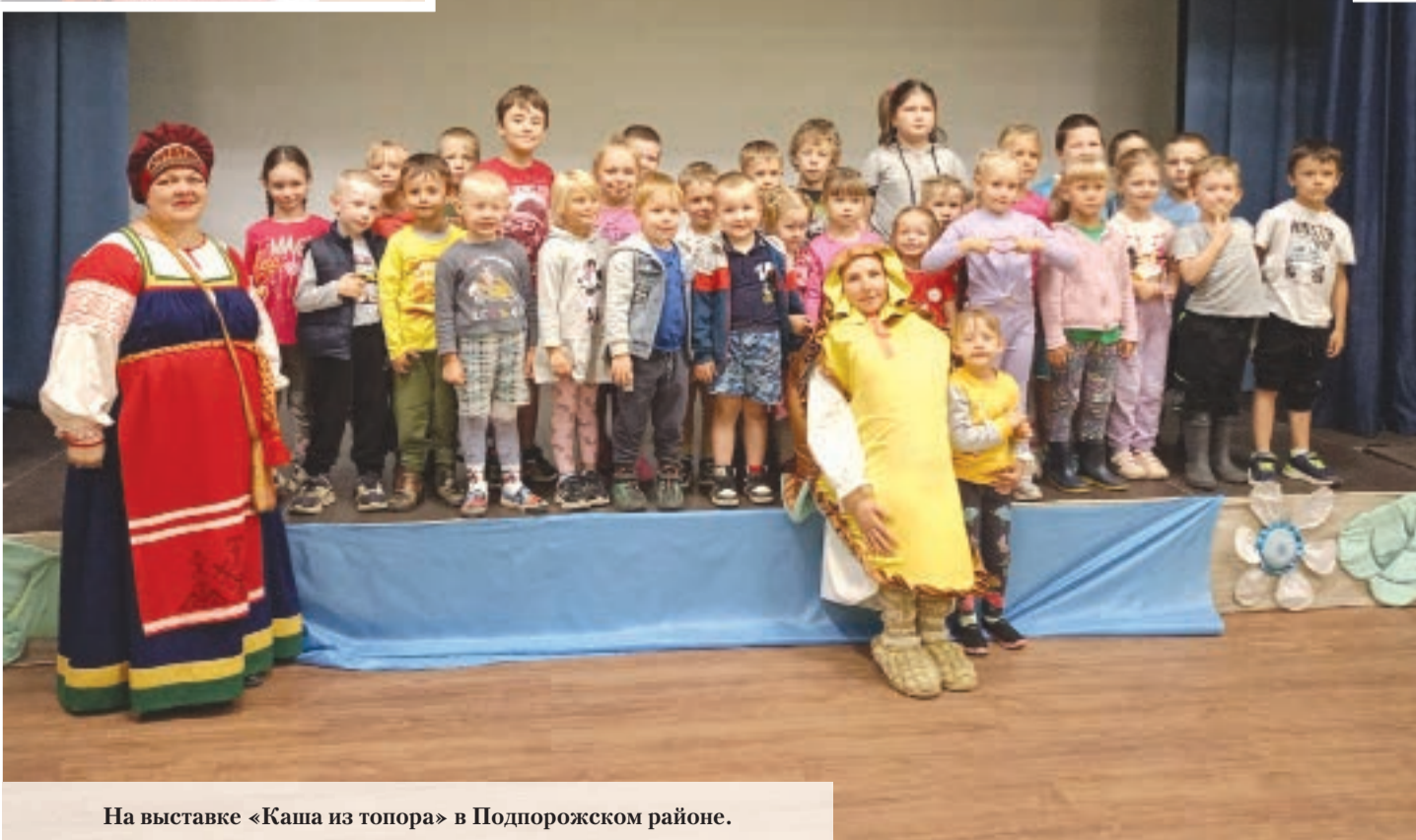
На выставке «Каша из топора» в Подпорожском районе.

Ежегодно 9 августа отмечается международный день коренных народов мира – праздник, посвящённый сохранению культуры и языка этих этнических общностей. Международный день коренных народов мира был установлен в 1994 году Генассамблеей ООН. Датой торжества был выбран день, когда в 1982 году прошло первое заседание рабочей группы по проблемам коренных народов.