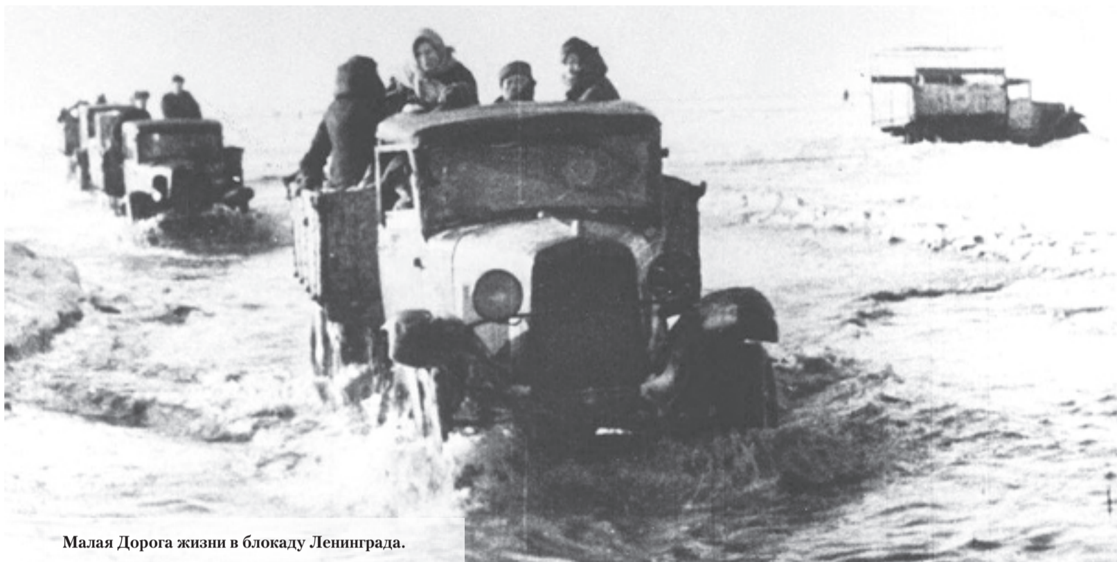
Малая Дорога жизни в блокаду Ленинграда.