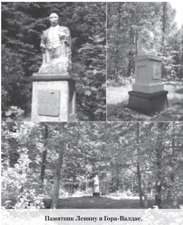
Памятник Ленину в Гора-Валдае.