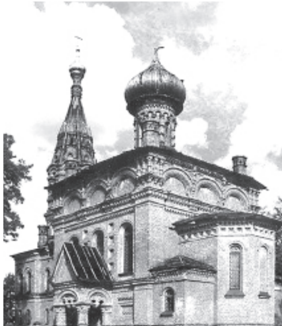
Троицкий собор в деревне Гора-Валдай до и во время реставрации.

храма Богоявления на Гутуевском острове уже построил по его заказу главный корпус Выборгской бумагопрядильной мануфактуры. Проект церкви Св.Троицы в усадьбе Алютино был утверждён в 1899 году. Троицкую церковь в деревне Гора-Валдай построили по-русски сказочную. С главками на тонких шейках, крыльцами на пузатых колонках, с декоративными фасадами, украшенными гирьками, кокошниками, порталами и наличниками. Освящал храм Иоанн Кронштадтский в 1903 году. Постройка обошлась в 300 тысяч рублей – порядка 300 миллионов по текущему курсу. Перешагнув шестидесятилетний рубеж, Иван Агапович решил оставить след и на своей малой родине в Ярославской губернии. Приехав туда, в знак благодарной памяти о родных местах, он предложил односельчанам на выбор: строительство собора или 70-километровой железной дороги до Пошехонья. Крестьяне выбрали собор, хотя в селе уже была крепкая каменная церковь, построенная в 1836 году, которая до наших дней не сохранилась. Для строительства вновь привлекли архитектора Косякова, который к тому времени уже стал директором института гражданских инженеров. В эти же годы в Кронштадте по его проекту возводился величественный Никольский Морской собор. Воронин пожертвовал миллион рублей на храм Спаса Нерукотворного Образа в селе Кукобой – в двух километрах от родного села купца Рябинки. Это была баснословная сумма для тех мест. На строительстве церкви работали, в основном, местные жители. Специально для возведения стен был по-