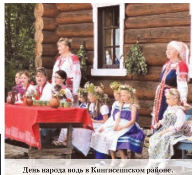
День народа водь в Кингисеппском районе.

Праздник был создан для привлечения внимания международной общественности к проблемам и потребностям коренных народов. Это касалось в том числе возможности свободно определять свою национальную принадлежность, жить на земле предков и распоряжаться её ресурсами, сохранять традиции, а также вести образование и общественную деятельность на национальном языке. В 1995 году было объявлено первое десятилетие коренных народов, которое дало толчок к усилению поддержки этих групп населения по всему миру. Уже в 2007 году была принята декларация о коренных народах. В ней утверждалось право этих народностей на определение своего политического статуса, участие в принятии решений на всех уровнях, если это касается их жизни, соблюдение и возрождение традиций. По данным ООН, в мире насчитывается около 476 миллионов представителей коренных народов, они проживают в 90 странах. Это около 5 процентов населения Земли. При этом представители этих народностей часто сталкиваются с дискриминацией, вынужденным переселением, болезнями, торговлей людьми и голодом. Поэтому важно объединить усилия по их поддержке на международном уровне. В России проживают 47 коренных малочисленных народов общей численностью более 300 тысяч человек. Они сосредоточены в северных регионах страны, а также в Сибири и на Дальнем Востоке.