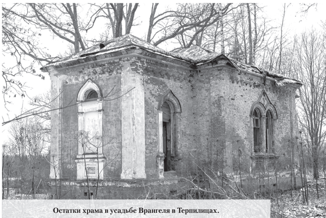
Остатки храма в усадьбе Врангеля в Терпилицах.

жёлтые фрагменты известняка. Внутри дворец полностью выгорел, зима прикрывает его рваные раны. Ранней весной и поздней осенью замок предстаёт во всей наготе своей незащитности – без крыши, заваленный