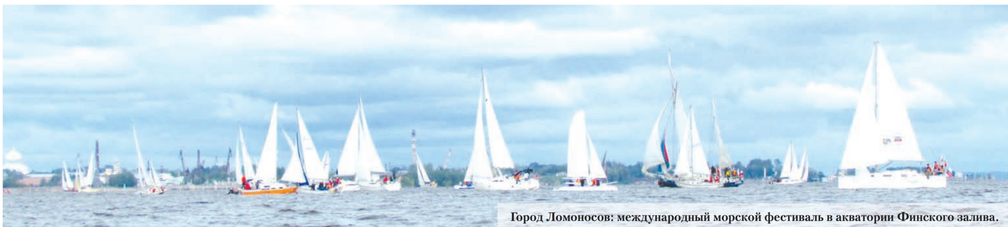
Город Ломоносов: международный морской фестиваль в акватории Финского залива.