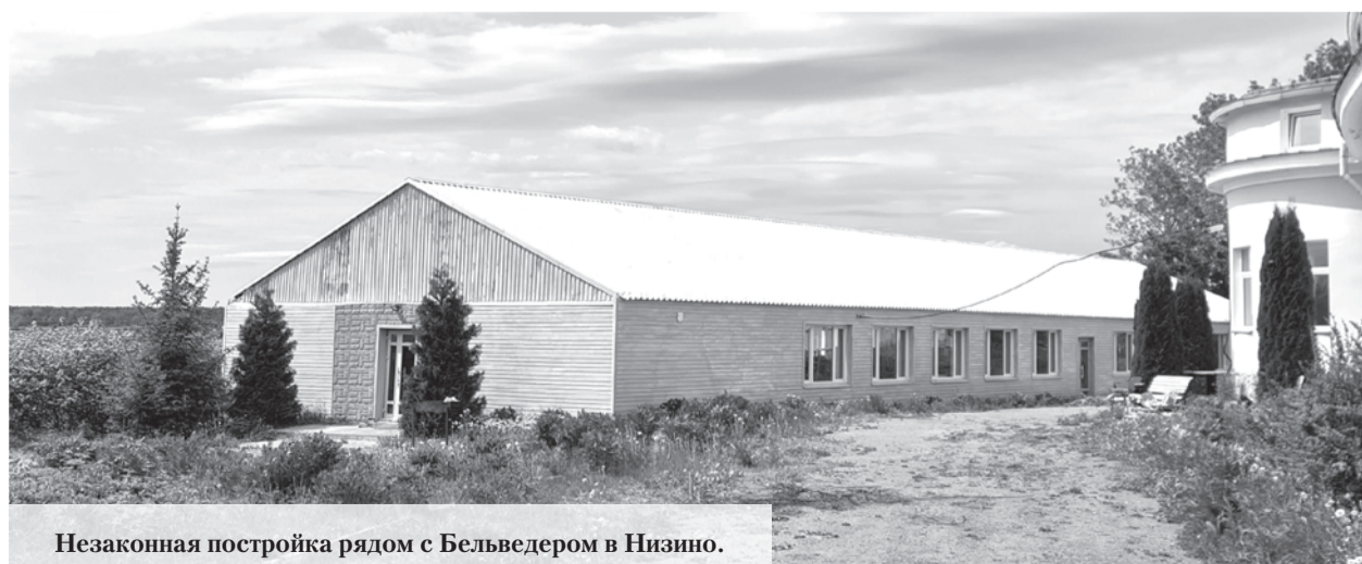
Незаконная постройка рядом с Бельведером в Низино.