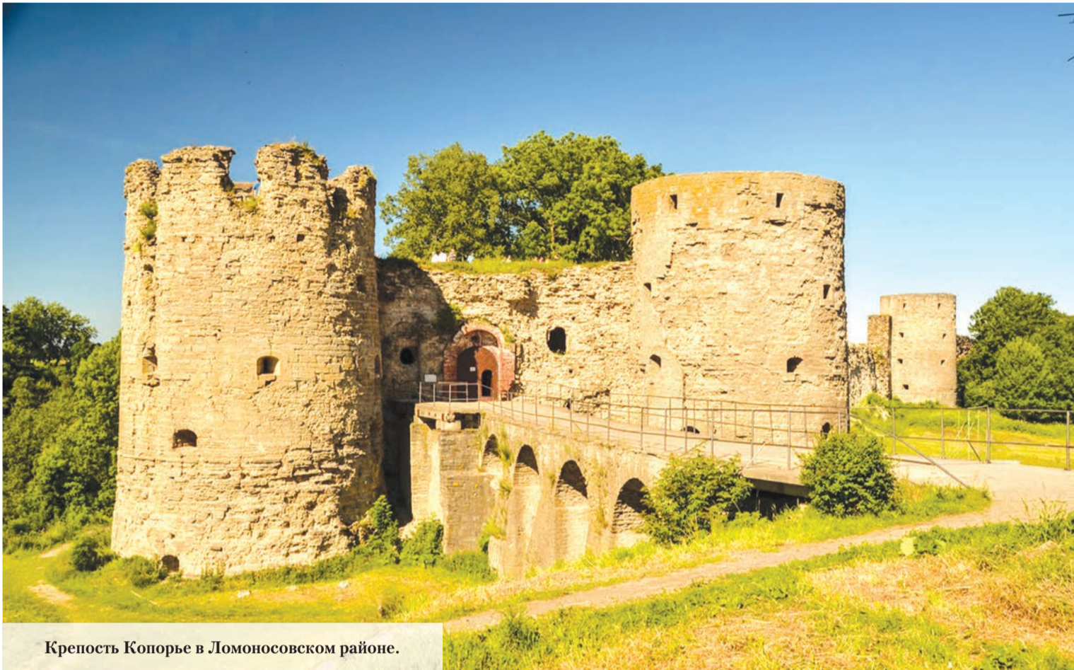
Крепость Копорье в Ломоносовском районе.