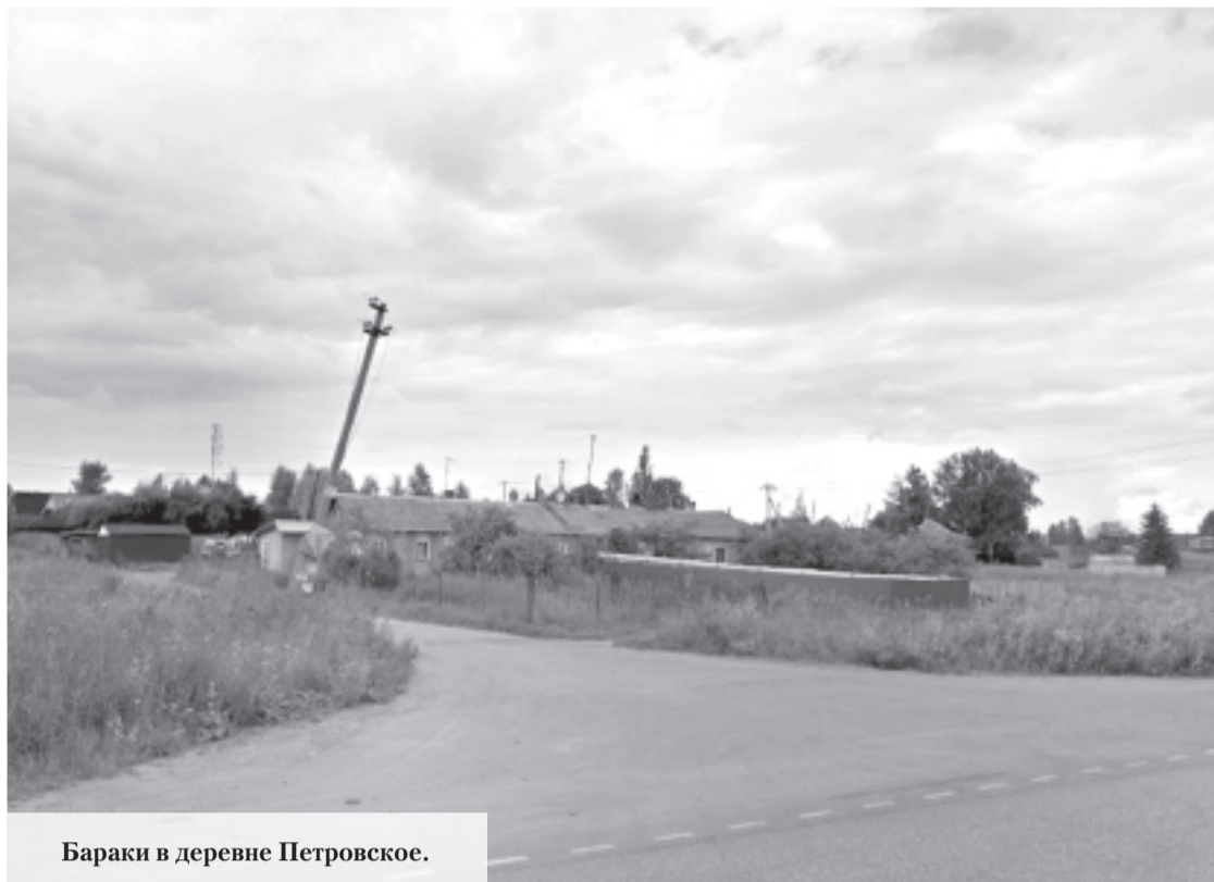
Бараки в деревне Петровское.

Так называемые блокированные дома, а точнее бараки, в деревне Петровское, посёлке Лебяжье и других населённых пунктах Ломоносовского района Ленобласти могут включить в программу расселения ветхого и аварийного жилья.