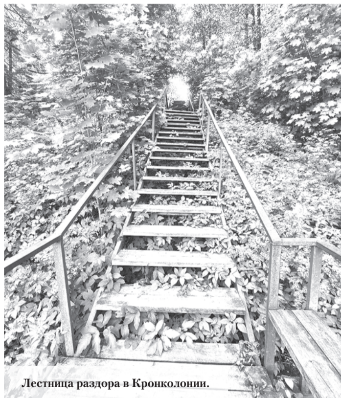
Лестница раздора в Кронколонии.

О следующей проблеме, которую можно отнести в разряд опасных, рассказывают жители деревни Низино Ломоносовского района. Они жалуются на аварийный детсад 1968 года постройки, в условиях которого приходится находиться маленьким детям. При этом они говорят, что буквально в 2020 году на ремонт садика было выделено 1847292,00 рублей, в 2021 году – 3502161,00 рублей, а в 2022 году – ещё 1989622,00 рублей. Итого 7339075,00 рублей. И где они? – задаются вопросом деревенские жители. По поводу текущей крыши, аварийного состояния стен и потолка в детсаду, плохого отопления и отсутствия системы безопасности они обращались и в роспотребнадзор, и в комитет по образованию, и к местным властям с депутатами, но помощи