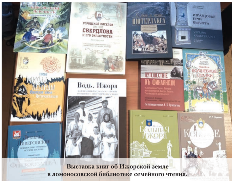
Выставка книг об Ижорской земле в ломоносовской библиотеке семейного чтения.