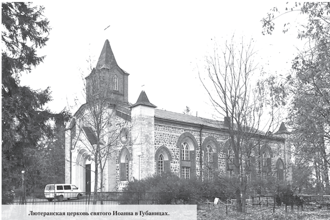
Лютеранская церковь святого Иоанна в Губаницах.