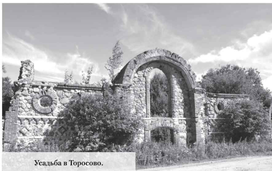
Усадьба в Торосово.

Следующая усадьба не оставляет равнодушным. Это усадебный комплекс Врангелей в деревне Торосово. Известная песня про белую армию и чёрного барона оставила неизгладимый след в умах советских граждан. Каждое подрастающее поколение, не очень чётко представляя себе российское прошлое, твёрдо знало, что барон Врангель – это ренегат, ненавистник светлого будущего. Сейчас, правда, всё доступнее становятся подлинные истории тех времён, где барон Врангель выступает уже в ином качестве, но мы не собираемся защищать барона – этот мужественный человек не нуждается в оправданиях. А вот погибающим усадьбам петербургской ветви его рода нужна немедленная защита. Когда въезжаешь в посёлок, то вначале внимание привлекают мощные амбары-вольварки через дорогу – явные остатки барской роскоши, а вскоре из густой зелени островка благородных деревьев проступают красные стены дворца. Зимой, когда деревья не закрывают обзор, дворец кажется стоящим практически на дороге. Поэтому даже с дороги видны следы разрушения. Увы, оставлены они не временем, а человеком. Усадебный дом, стилизованный под английскую готику, построен в 1870-е годы, то есть лет ему не так уж и много. Сделан он был крепко: стены сложены из красного кирпича (был в