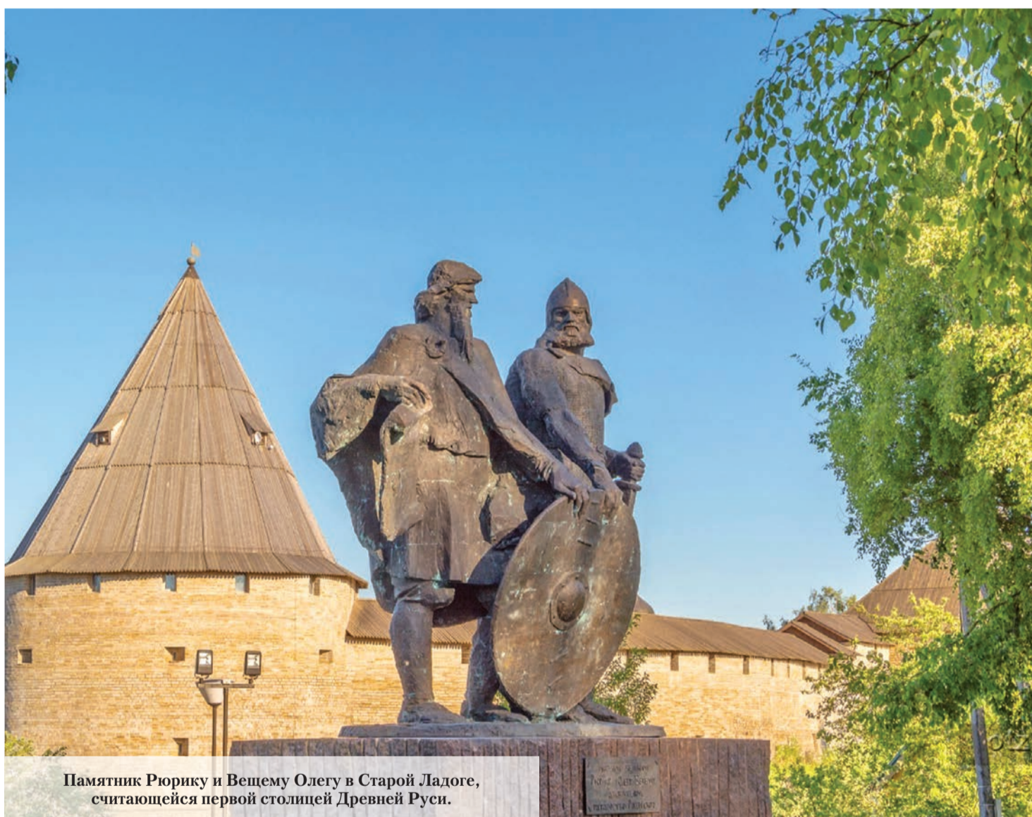
Памятник Рюрику и Вещему Олегу в Старой Ладоге, считающейся первой столицей Древней Руси.

Первого августа исполнилось 96 лет со дня основания Ленинградской области. В этом году празднование дня рождения региона состоится 5 августа в городе Тосно. Традицию ежегодно отмечать праздник в разных городах Ленинградской области решили не отменять даже после появления официальной столицы 47 региона – города Гатчина.