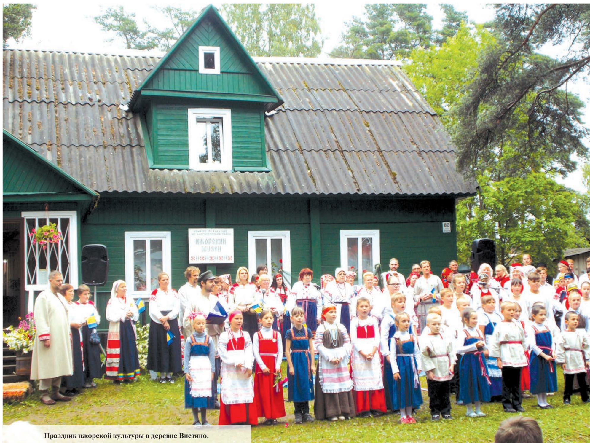
Праздник ижорской культуры в деревне Вистино.