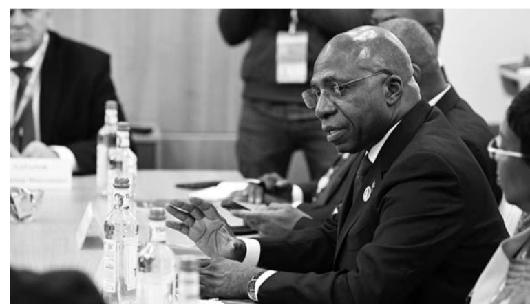
Тете Антониу, министр иностранных дел Анголы

— Мы благодарны за годы поддержки, оказанной советским народом. Прекрасно помним, как с вашей помощью у нас строились предприятия, откры-