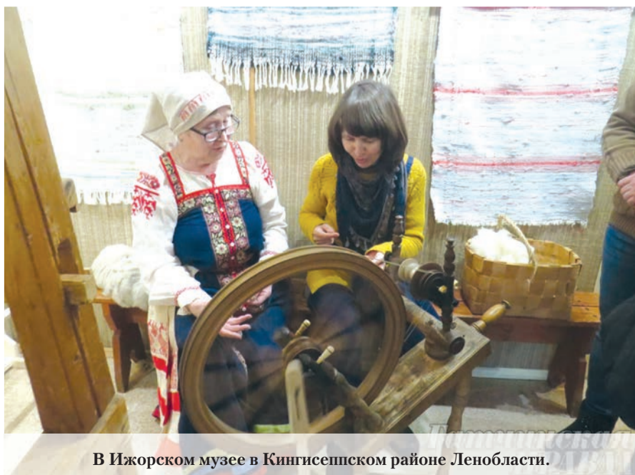
В Ижорском музее в Кингисеппском районе Ленобласти.