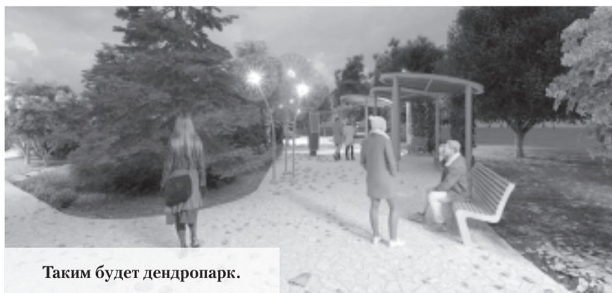
Таким будет дендропарк.

В Ропшинском поселении Ломоносовского района Ленобласти благоустроят общественную территорию «Дендропарк Большие Горки».