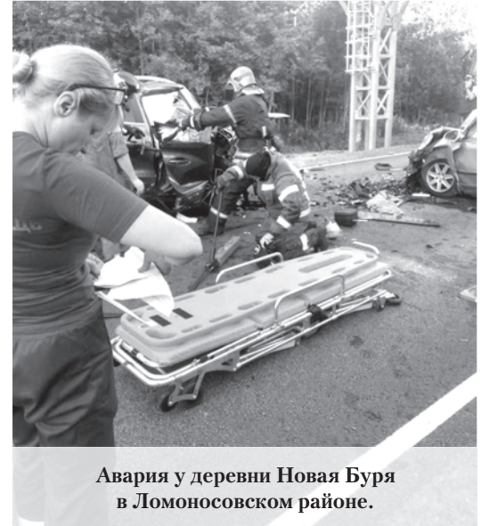
Авария у деревни Новая Буря в Ломоносовском районе.