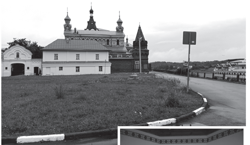
Никольская обитель в Старой Ладого.