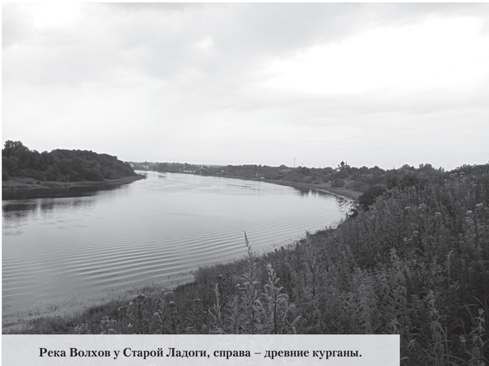
Река Волхов у Старой Ладого, справа – древние курганы.