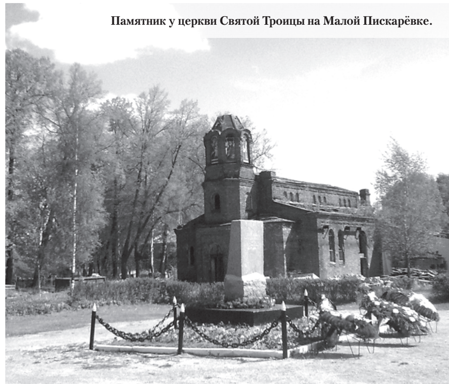
Памятник у церкви Святой Троицы на Малой Пискаревке.

Ещё в июле 1941 года решением военного совета Краснознамённого Балтийского флота кронштадтский сектор береговой обороны был разделён на три части: собственно Кронштадтский, Лужский и Ижорский. Ижорский укрепленный сектор держал оборону южного побережья Финского залива и являлся