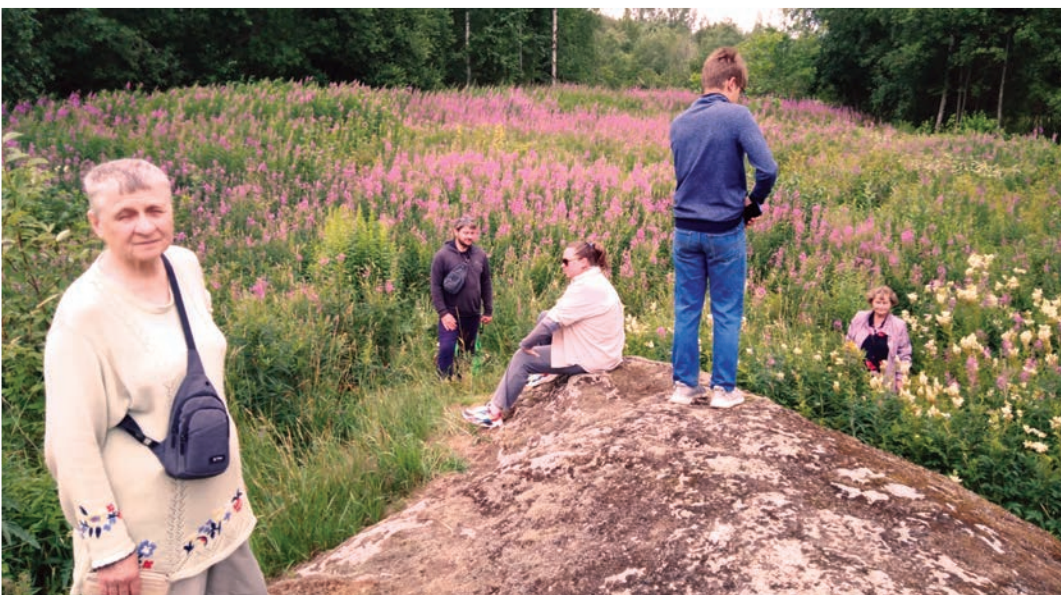
Жертвенный камень саамов «Бизон» в Пениковском поселении Ломоносовского района.

М.ВОЛОДИНА.