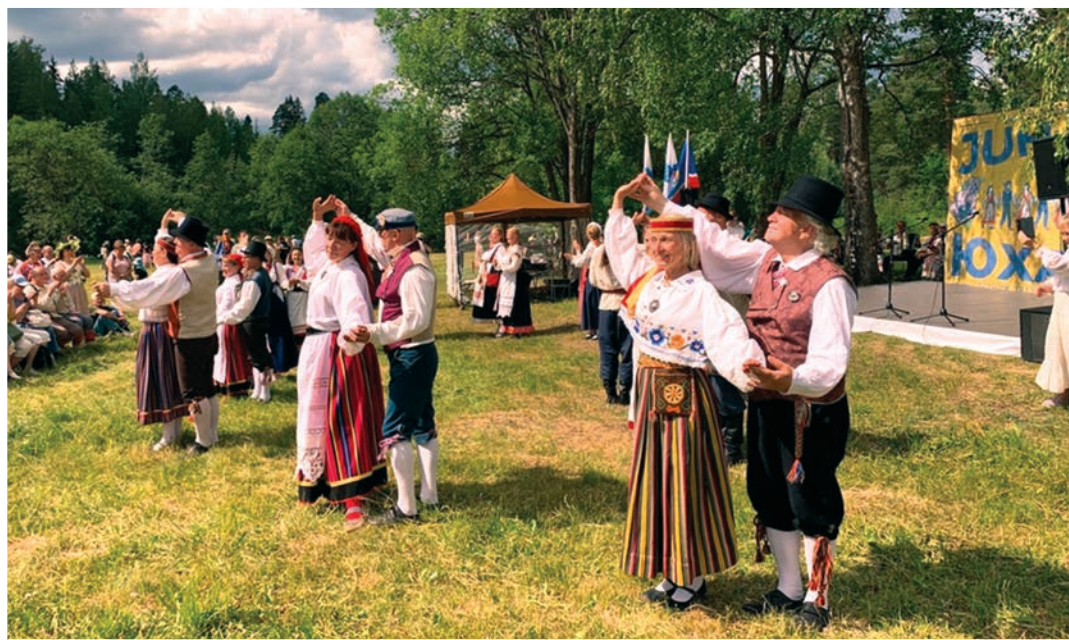
Танцы ингерманландских финнов на празднике Юханнус в Гатчинском районе Ленобласти.

посёлке Сиверский Гатчинского района, куда съехалось множество гостей, как говорится, со всех волостей, в том числе и из Ломоносовского района. Было весело, вкусно и очень красиво. Также, как и у славян на Ивана Купалу, на Юханнус, по традиции, у финно-угорских народов принято разжигать костры, петь песни до утра, одеваться в праздничные наряды или красочные вышитые национальные костюмы и плести венки. Основные символы праздника – огонь, вода и растения. Огонь олицетворяет жаркое летнее солнце, и через него нужно прыгать, чтобы год был удачливым. А можно, также на счастье и удачу, просто пустить по реке венок из полевых цветов. И самое главное – не забыть загадать желание. Праздновать Юханнус в Ленинградской области начали с 1989 года. На первых таких праздниках ингерманландских финнов в Гатчинском районе гостей было не более двух тысяч человек. Сегодня же областной Юханнус собирает вдвое больше участников. Лялин луг на реке Ордеж – очень живописное место в Гатчинском районе. Поэтому он не случайно выбран для проведения такого же красивого мероприятия, как народное гуляние на Юханнус.