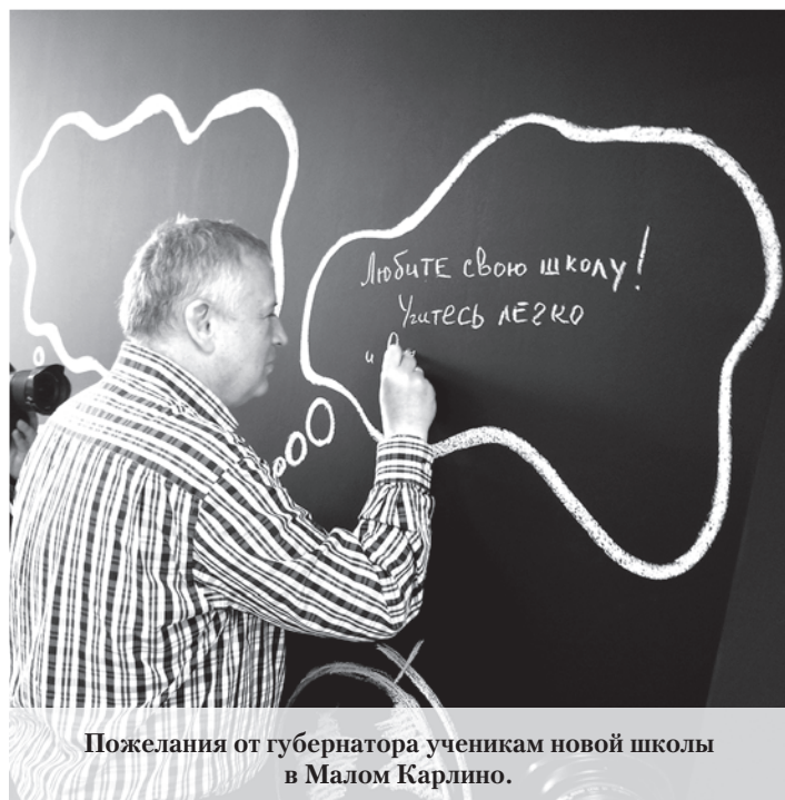
Пожелания от губернатора ученикам новой школы в Малом Карлино.