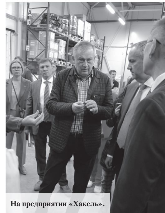
На предприятии «Хакель».

В конце рабочей поездки в Ломоносовский район Александр Дрозденко встретился с представителями бизнеса. По его словам, главной задачей правительства являются максимальная поддержка и помощь предприятиям, которые работают в 47-м регионе, вне зависимости от состава акционеров. «Для этого создана комплексная мера поддержки, которая направлена на снижение административных барьеров – «Зелёный коридор для инвестора». Предприятия должны работать, производить продукцию, зарабатывать и платить налоги. Вот основной посыл бизнесу», – заявил губернатор. Губернатор обратил внимание на то, что около 400 компаний, которые работают в Ленинградской области, являются организациями с зарубежным участием. Большая часть из них сохранили направление деятельности, сотрудников и продолжили работать в регионе. Например,