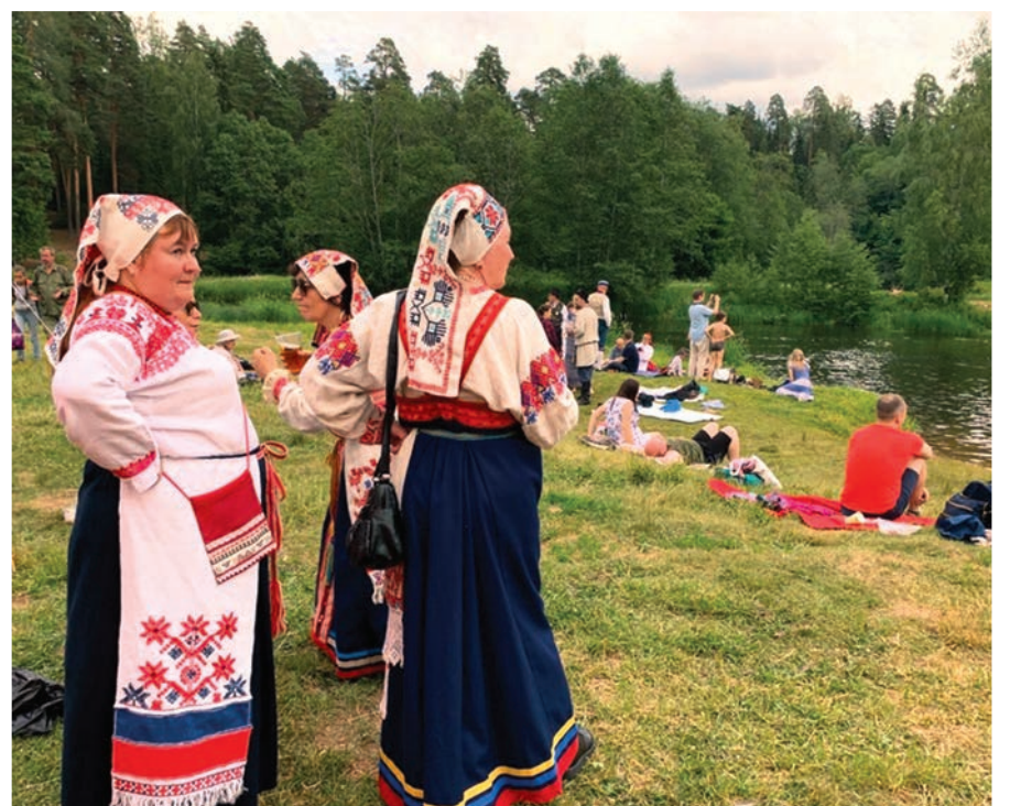
Купание на празднике Юханнус в реке Оредеж.