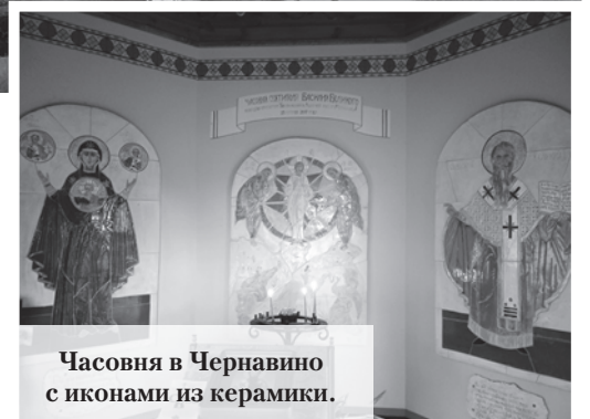
Часовня в Чернавино с иконами из керамики.