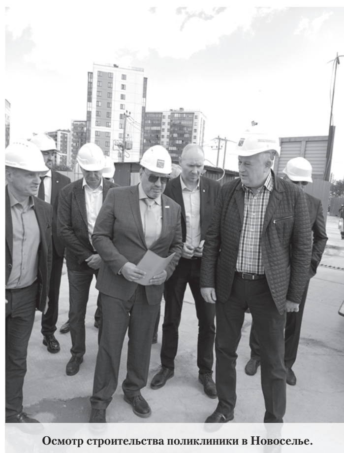
Осмотр строительства поликлиники в Новоселье.