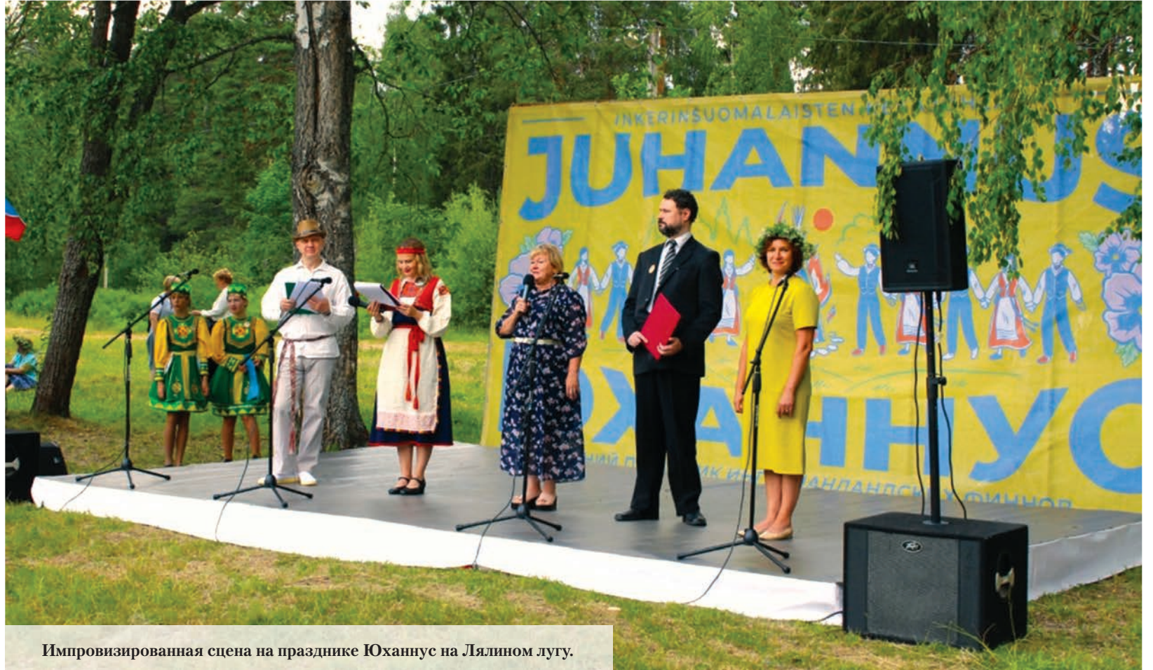
Импровизированная сцена на празднике Юханнус на Лялином лугу.

На Лялином лугу в этом году, впрочем, как и всегда, получился настоящий этнографический праздник: пёстрый от красочных национальных костюмов, живописный от изумрудной зелени трав и деревьев, от разноцветных венков, которые девушки плели на поляне под звуки народной музыки. На импровизированной сцене выступали фольклорно-этнографические коллективы из Гатчинского района, Ленобласти и Петербурга – более двадцати ансамблей. Конечно же, не обошлось без финских народных игр – метали сапоги и забивали гвозди, как учил всех желающих известный спортсмен Вильё Остонен. Развлекательная программа и аквагрим – для детей, мастер-классы, фотозоны, национальная кухня с разнообразными вкусами и торговые ряды – для всех гостей праздника. На радость и маленьким, и взрослым можно было по-настоящему походить бурёнку Зорьку, хоть и сделанную из фанеры. День Ивана Купалы, или Юханнус, или день летнего солнцестояния – можно по-разному называть этот праздник, который вот уже несколько лет подряд в Гатчинском районе организует местное общество «Инкери-Сеура» при помощи местных властей и районного руководства. Председатель общества