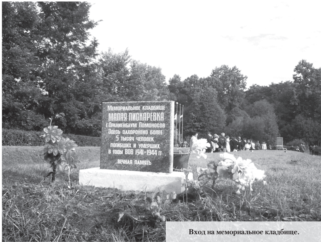
Вход на мемориальное кладбище.