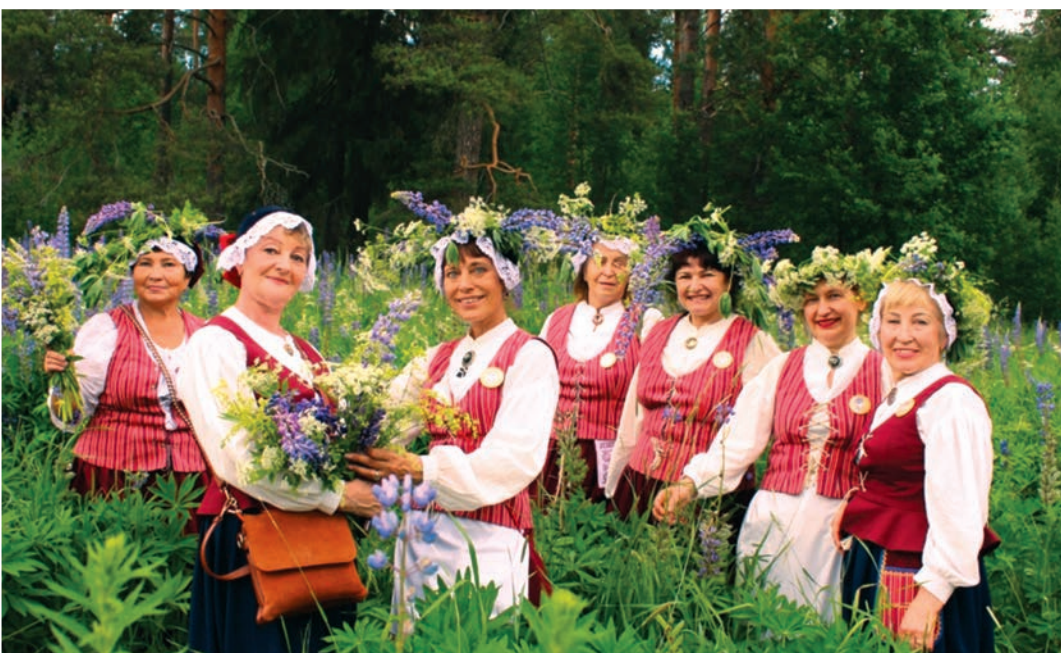
На празднике ингерманландских финнов Юханнус в Гатчинском районе Ленобласти.

Иван Купала — один из самых таинственных и необычных народных праздников, который ведёт начало с древних времён, с ним связано множество примет, обычаев и суеверий. Обряды на Ивана Купалу связаны с двумя природными стихиями – огнём и водой. Не случайно в ночь на Купалу костры разжигали по берегам рек, используя при этом «живой» огонь, получаемый путём трения. У купальских костров собиралась молодёжь и разворачивались гулянья. Чтобы приобрести удачу и крепкое здоровье, девушки и парни поодиночке или парами прыгали через огонь. В костёр бросали рубашку больного ребёнка, чтобы вместе с ней сгорела его болезнь. Матери проносили над костром детей в надежде на целебную и очистительную силу огня. После купальской ночи пепел от костров рассеивали по хлебным полям и огородам. Другие названия дня Ивана Купалы: Иванов день, Иванщина, Купала, Колосок, Ярило, Сонцекрес, Купайло, Иван-травник. Этот день считался временем откровения тайн природы. Люди верили, что в ночь на Ивана Купалу небеса и земля растворяются, звезды спускаются на землю, а солнце останавливается. Растения и животные в это время обретают возможность говорить, а вода перестаёт волноваться, замирает и становится целебной.