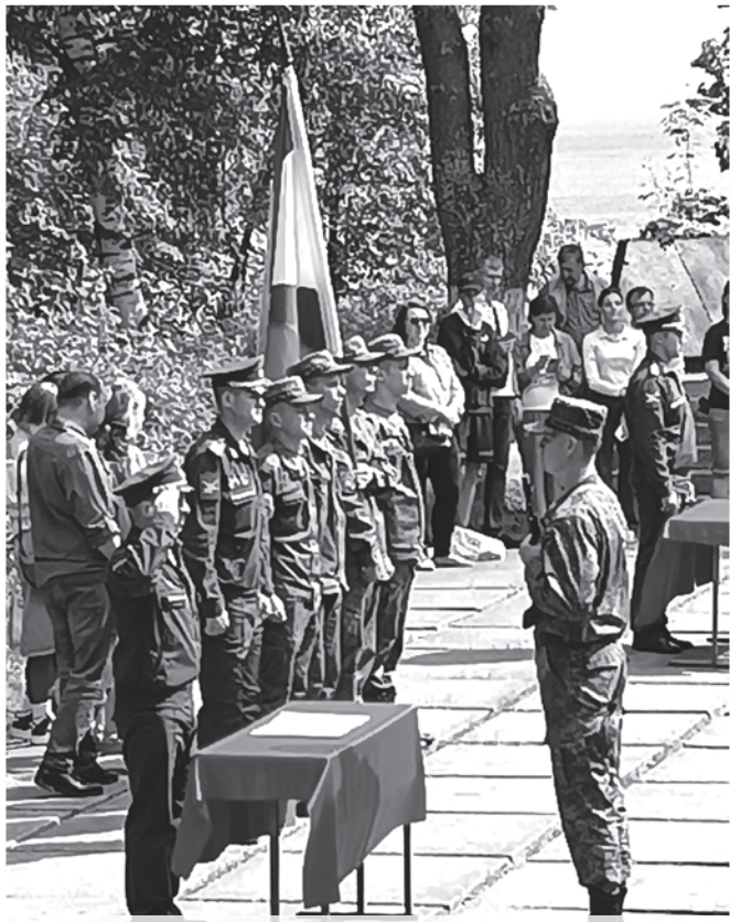
На форту Красная Горка выпускники военной кафедры из Москвы принимают присягу.