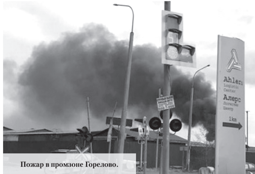
Пожар в промзоне Горелово.

главного управления МЧС по Ленобласти, около половины четвёртого дня 3 мая поступил сигнал о пожаре в деревне Малое Карлино Ломоносовского района. Горели частный дом, баня и легковой автомобиль на площади 204 квадратных метра. К половине шестого вечера пожар был ликвидирован дежурными сменами 134-й и 153-й пожарных частей Ленобласти и 33-м подразделением Петербурга. Пострадавших, по предварительным данным, нет. Как сообщает 47news, 6 мая чёрный столб густого дыма, поднимавшийся выше крыш жилых высоток, взвился на Волхонском шоссе, 2, за заводом «Волна». К 22.30 пожар был локализован, а к ночи окончательно потушен, сообщили в главном управлении МЧС по Ленобласти. Борьба с огнём длилась несколько часов, дежурным частям потребовалось подкрепление. Сначала