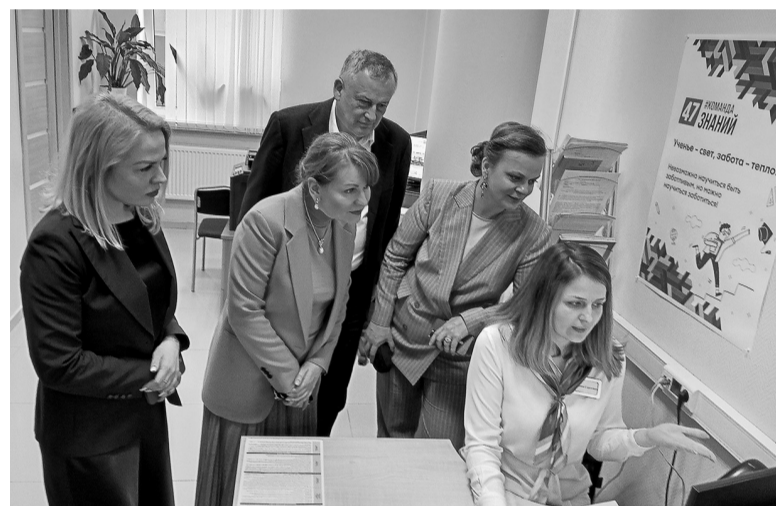
Ленинградский филиал фонда готовится к открытию

евых действий лекарствами и техническими средствами, не входящими в федеральный перечень льгот. Например, высокофункциональными протезами или мобильными колясками.