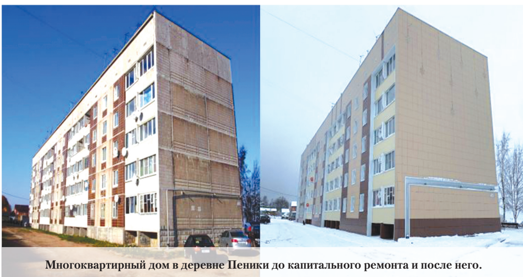
Многokвартирный дом в деревне Пеники до капитального ремонта и после него.

И. СИБИРЯКОВА.