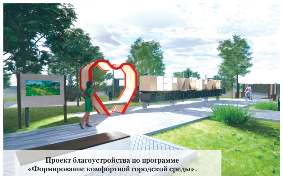
Проект благоустройства по программе «Формирование комфортной городской среды».