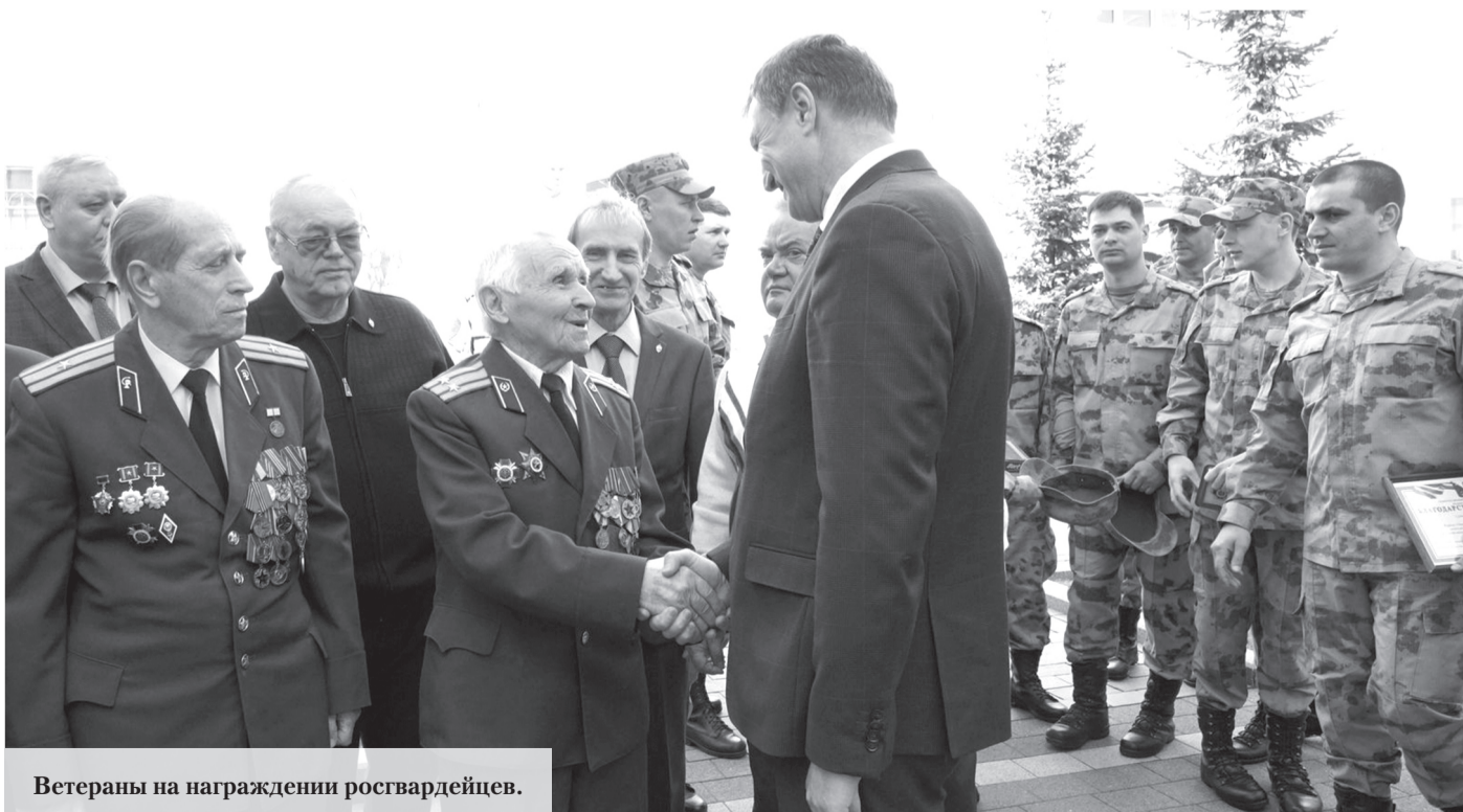
Ветераны на награждении росгвардейцев.