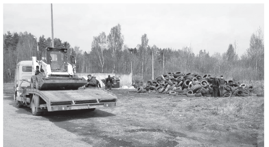
Очередная уборка старых автомобильных шин на улице Связи в Ломоносове.