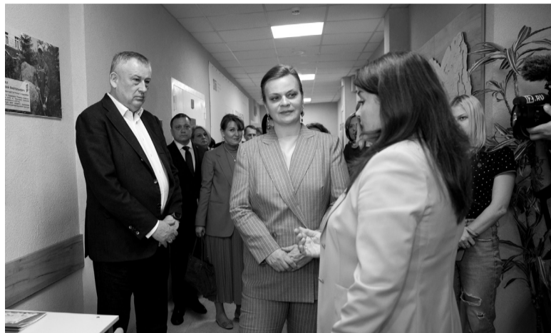
В работе фонда пригодится опыт Мультицентра социальной и трудовой интеграции

Что же смогут получить ветераны СВО, обратившись к специалистам фонда? Спектр социальных услуг — самый широкий. Это и санаторно-курортное лечение, и помощь с восстановлением утраченных документов, и обучение любой профессии вплоть до запуска своего бизнеса. Именно на «Защитников Отечества» возложен контроль за обеспечением ветеранов бо-