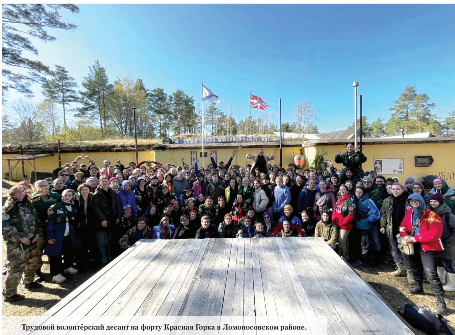
Трудовой волонтерский десант на форту Красная Горка в Ломоносовском районе.

В выходные на форту Красная Горка в Лебяженском городском поселении Ломоносовского района Ленинградской области высадился волонтерский десант из ста восьмидесяти человек – студенты из Санкт-Петербурга и Ленобласти. Мероприятие прошло в рамках областных молодежного добровольческого проекта «Вахта Памяти. Прорыв» и экологического проекта «Чистая Вуокса».