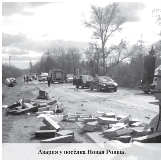
Авария у посёлка Новая Ропша.

В Ломоносовском районе Ленобласти столкнулись грузовик «Митсубиси» и легковой автомобиль «Тойота Лэнд Крузер».