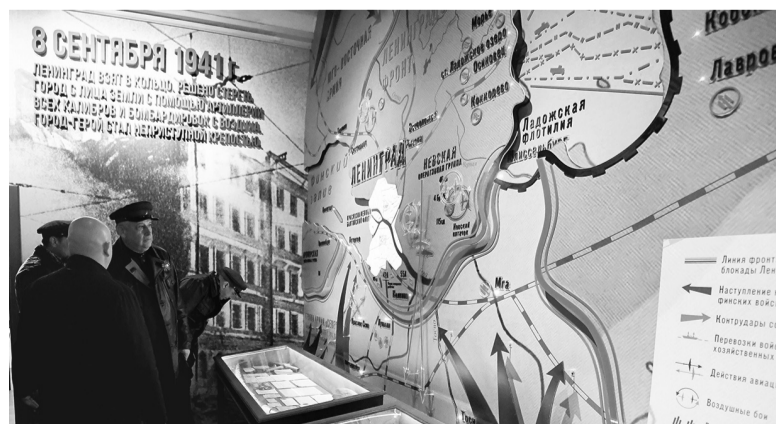
Ленинградская область бережно хранит память о Дороге жизни

ЛЮДМИЛА КОНДРАШОВА