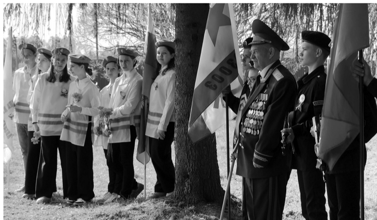
Аллея памяти военных журналистов становится новым местом притяжения для жителей Любани