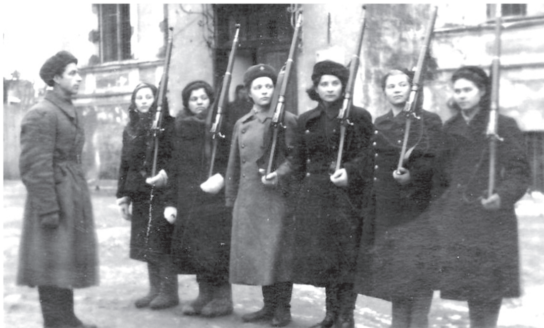
79-й истребительный батальон перед выходом на патрулирование в Ораниенбауме, 1941 год.