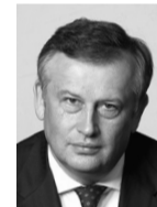
АЛЕКСАНДР ДРОЗДЕНКО, ГУБЕРНАТОР ЛЕНИНГРАДСКОЙ ОБЛАСТИ

Я благодарен Владимиру Владимировичу Путину за твердую поддержку нашей инициативы о комплексной модернизации Дороги жизни. Теперь наша задача — выполнить поручение президента. Мы должны сделать «Дорогу жизни» современным мемориальным объектом, достойным поколения внуков и правнуков тех, кто одержал великую Победу, кто отстоял Ленинград, кто освободил Ленинградскую область