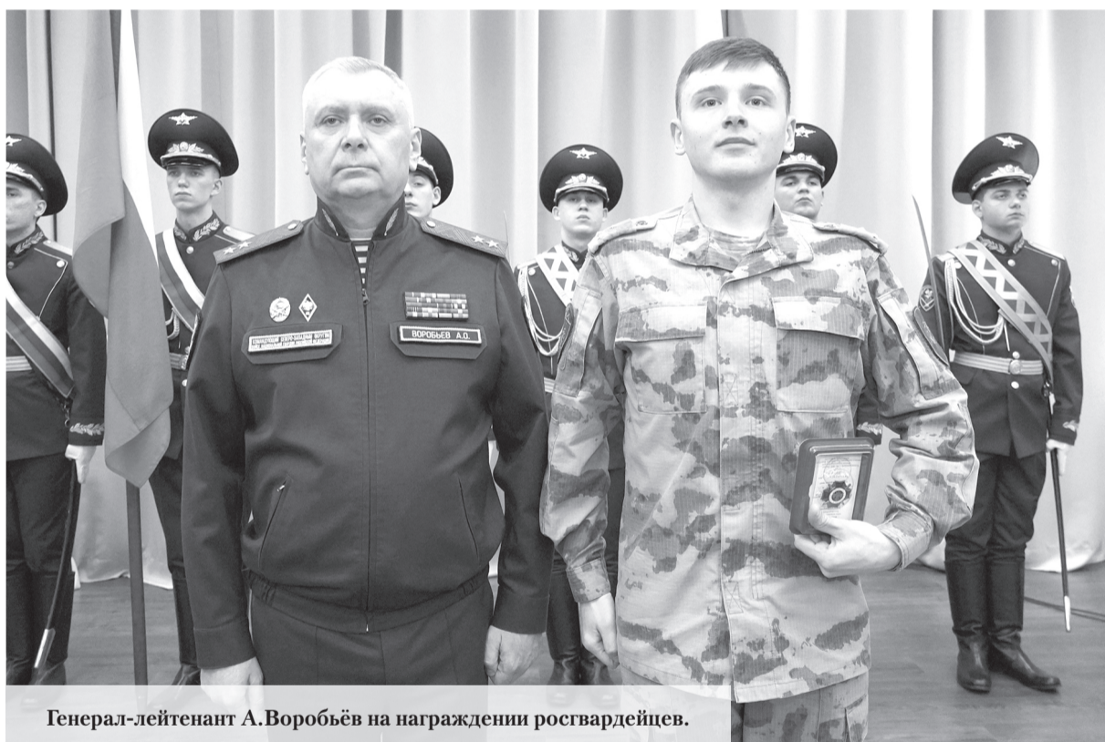
Генерал-лейтенант А.Воробьёв на награждении росгвардейцев.