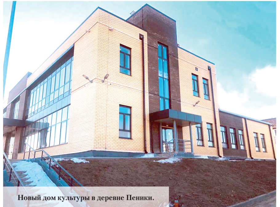
Новый дом культуры в деревне Пеники.