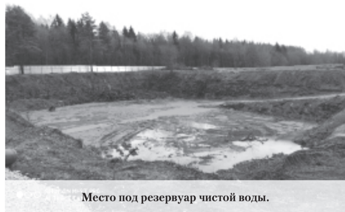
Место под резервуар чистой воды.