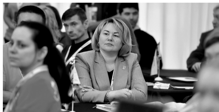
■ Лира Бурак — председатель комитета по местному самоуправлению, межнациональным и межконфессиональным отношениям Ленобласти

— За эти годы благодаря активному участию старост, членов общественных советов и инициативных комиссий создано 10 тысяч очень нужных людям объектов общественной инфраструктуры. Вначале на поддержку инициатив жителей закладывалось 60 млн рублей. Последние годы на 500 инициативных проектов регион выделяет субсидии в сумме 460 млн. И только в 2022 году число жителей, получивших пользу от реализации инициативных предложений, составило более 700 тысяч человек.