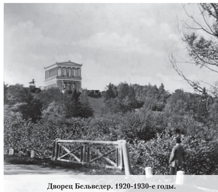
Дворец Бельведер. 1920-1930-е годы.