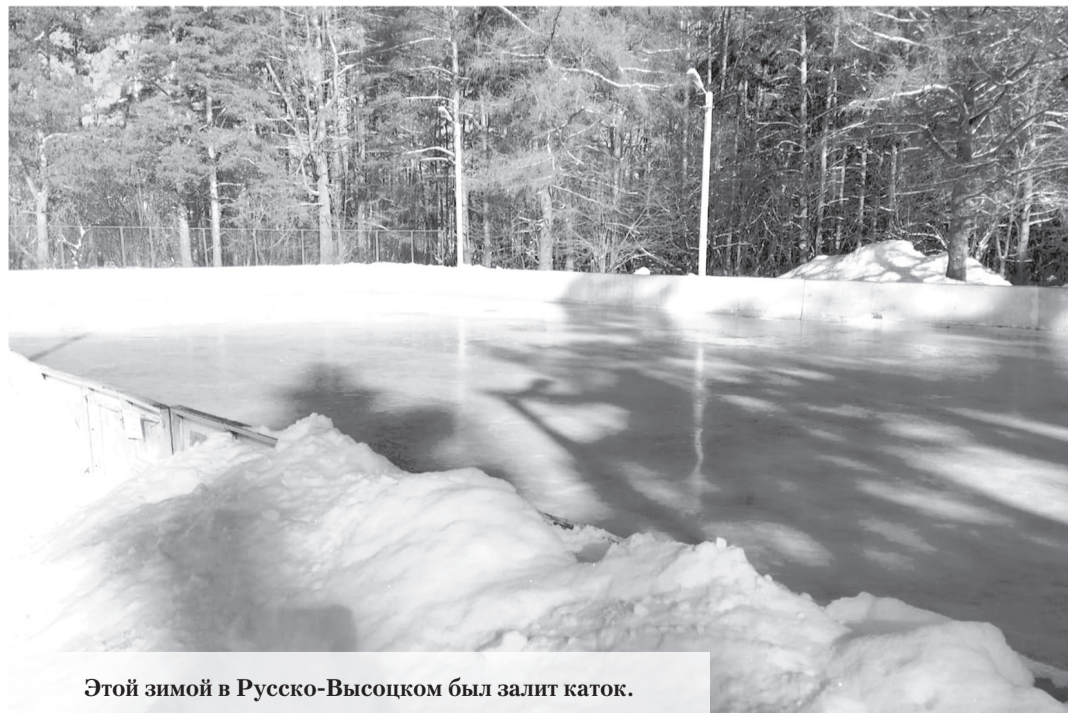
Этой зимой в Русско-Высоцком был залит каток.

Будут произведены устройство пожарных водоёмов в населённых пунктах и обследование территории на наличие несанкционированных свалок, а также их ликвидация. Продолжится технологическое присоединение уличного освещения, реализация программы догазификации, которая позволит бесплатно подвести газ до границ участка в газифицированных населённых пунктах.