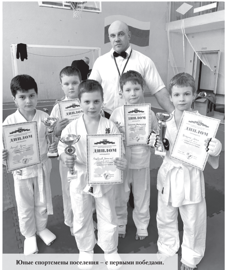
Юные спортсмены поселения – с первыми победами.

В планы на 2023 год, озвученные местной администрацией, входят ремонт улично-дорожной сети, ремонт и установка щебёночного покрытия в зоне активной застройки индивидуальных жилых домов. Планируются формирование земельных участков под контейнерными площадками и разработка проектов организации дорожного движения.