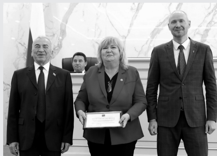
Очередное награждение победителей состоится 31 мая