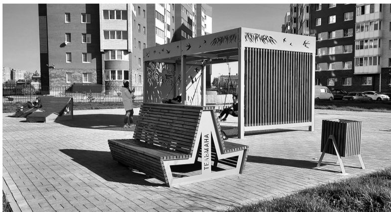
■ Благоустройство набережной Ижоры в посёлке Тельмана по программе инициативного бюджетирования