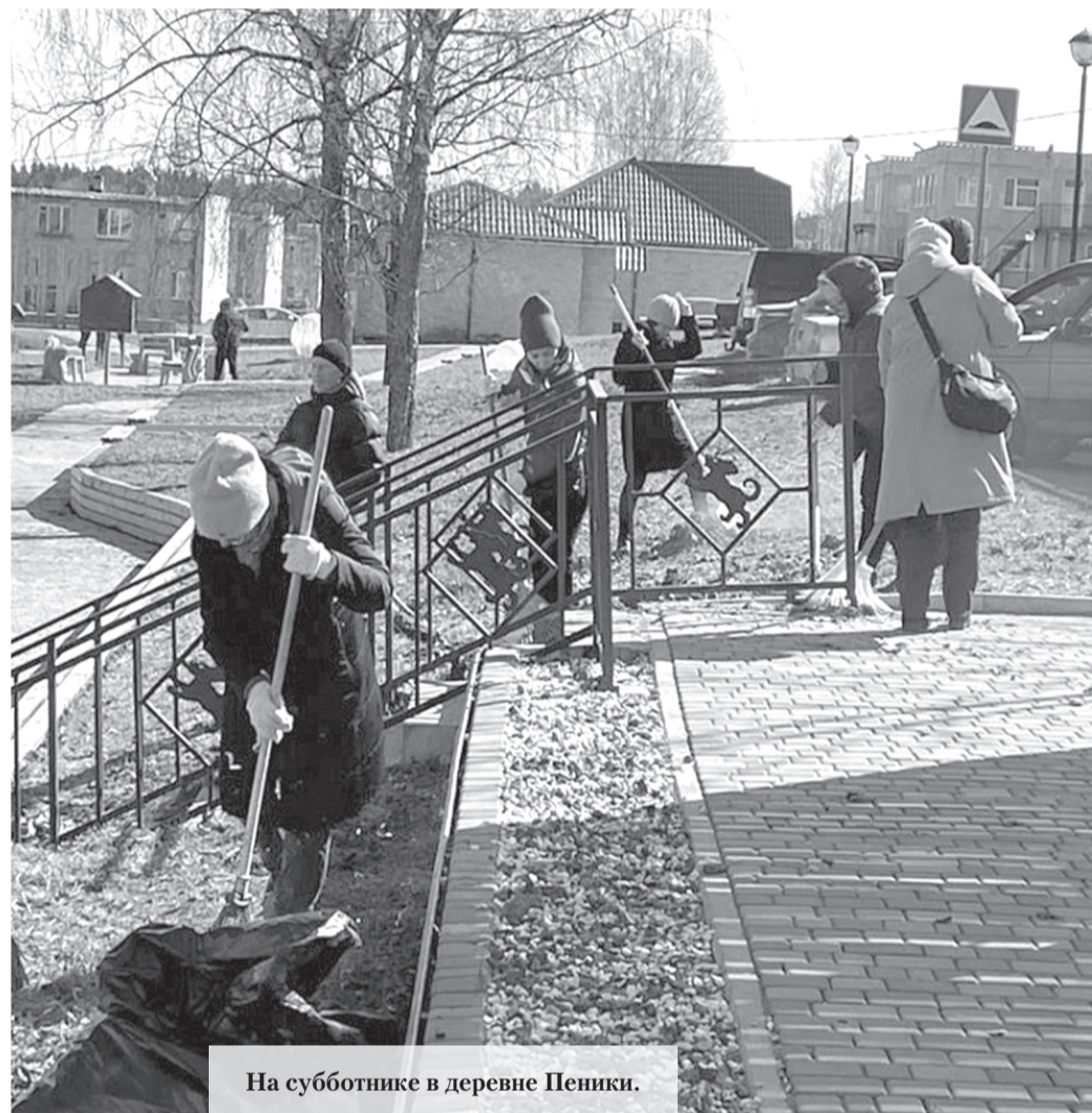
На субботнике в деревне Пеники.