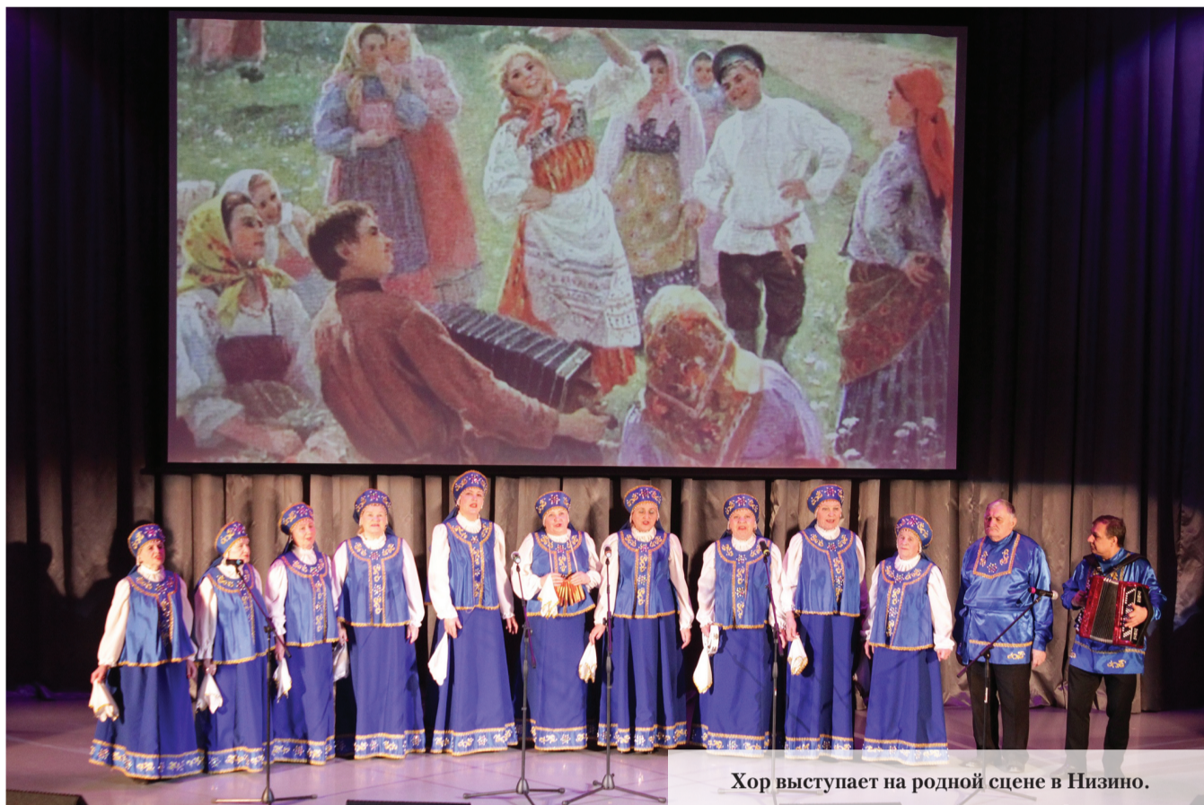
Хор выступает на родной сцене в Низино.