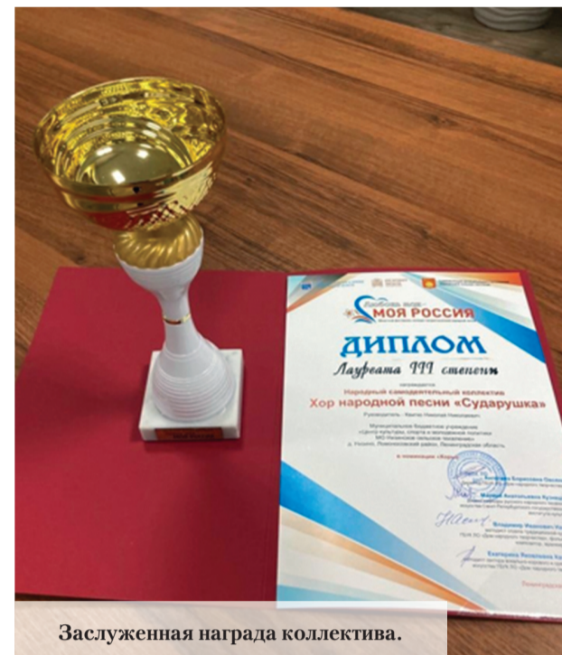
Заслуженная награда коллектива.