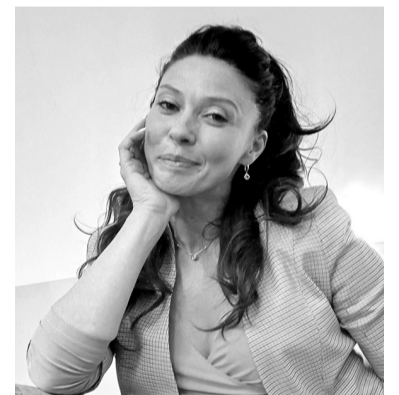
Актриса и музыкант Анна Музыченко

— Это же моя профессия. Смешить людей — так здорово!