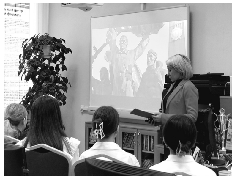
«Разговоры о важном» также посвящают памяти героев Великой Отечественной войны