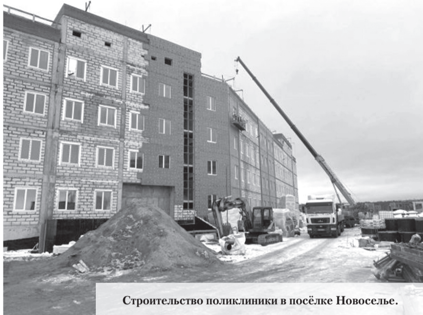
Строительство поликлиники в посёлке Новоселье.

В больницу села Русско-Высоцкое Ломоносовского района Ленинградской области поставят машину скорой помощи.