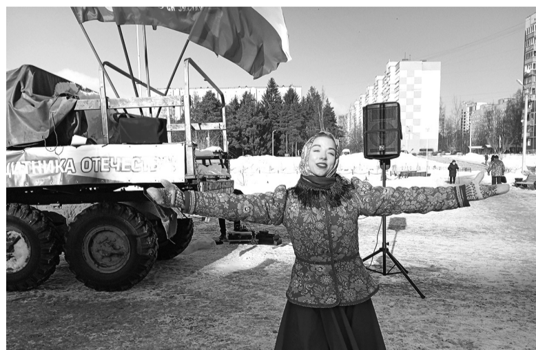
Для настоящего праздника большая сцена не нужна

— Горячий чай артистам! И на сцену! — звучит команда режиссёра, хотя никакой сцены вокруг мы не наблюдаем. Есть только небольшая помост на площади в Парке героев посёлка Сертолово. Вокруг — звуковая аппаратура, пара микрофонов на стойках и стекающиеся на звуки музыки зрители.