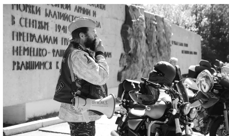
Традиционный мотопробег по местам воинской славы