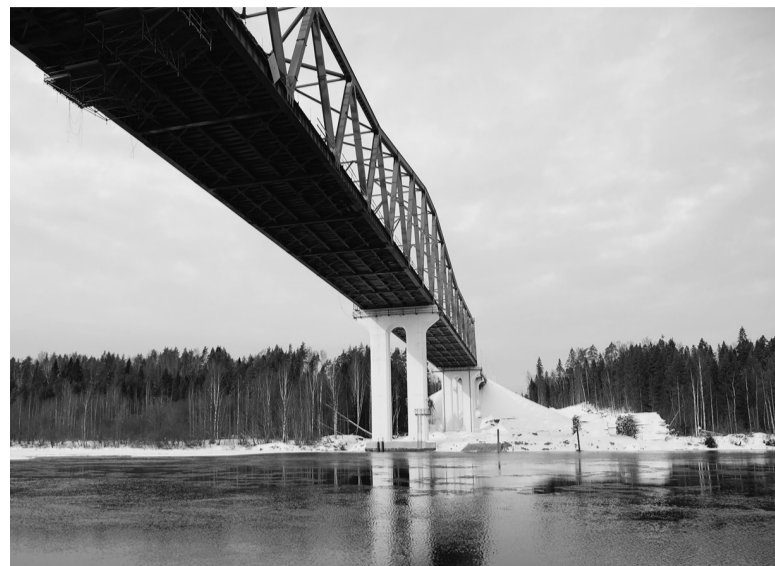
Мост через Свирь повысит уровень транспортного сообщения в Подпорожье

— Переправа решит проблему транспортного сообщения двух частей Подпорожья и значительно улучшит логистику на востоке области. Кроме того, это составная часть перспективного строительства новой дороги на Петрозаводск, дублёра трассы «Кола», — поделился до-