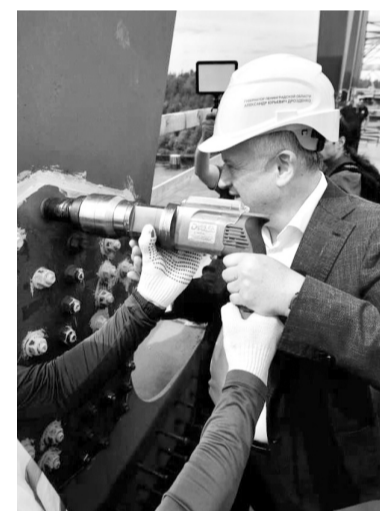
Пролёты моста соединили прошлым летом