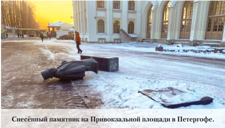
Снесённый памятник на Привокзальной площади в Петергофе.

В Новом Петергофе убирали снег, а заодно убрали памятник Александру Штиглицу. Трактор задел постамент, и бронзовый памятник Штиглицу рухнул на Привокзальной площади.