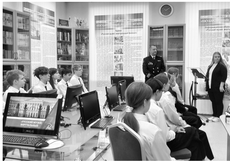
Тематический урок в Кировской гимназии имени Героя Советского Союза Султана Баймагамбетова

В сентябре в российских школах и учреждениях среднего профессионального образования ввели еженедельные «Разговоры о важном». Каждый понедельник теперь начинается с церемонии поднятия государственного флага под звуки российского гимна. Затем — 30-минутный классный час, тема которого обычно связана с важной исторической датой или государственным праздником. Например, уже прошли тематические уроки «День Конституции», «День Героев Отечества», «День матери», «День российской науки», «Прорыв блокады Ленинграда».